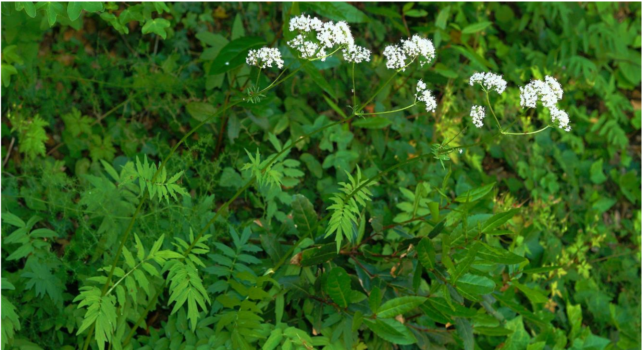
Abb. 19: Valeriana wallrothii ; Erstfund für die Insel Krk; Foto: Jürgen HERBST; confirm. Ioana M. PADURE.

Valeriana wallrothii KREYER (Abb. 19) !!Neu für die Insel Krk/Veglia/Vöglis!! ; sehr selten. Diese Sippe ist im nördlichen Teil der istrischen Halbinsel im bergigen Teil in feuchten Wäldern nicht selten, doch hier auf der Insel in unmittelbarer Meeresnähe unter Acer monspessulanum und Laurus nobilis (Vrbnik/Verbenico/Vörbnick: N 45°04'28,76", E 14°40'20,30", 40 m alt.) eine absolute Überraschung, entdeckt von Alexandra & Jürgen HERBST am 13.05.2018.