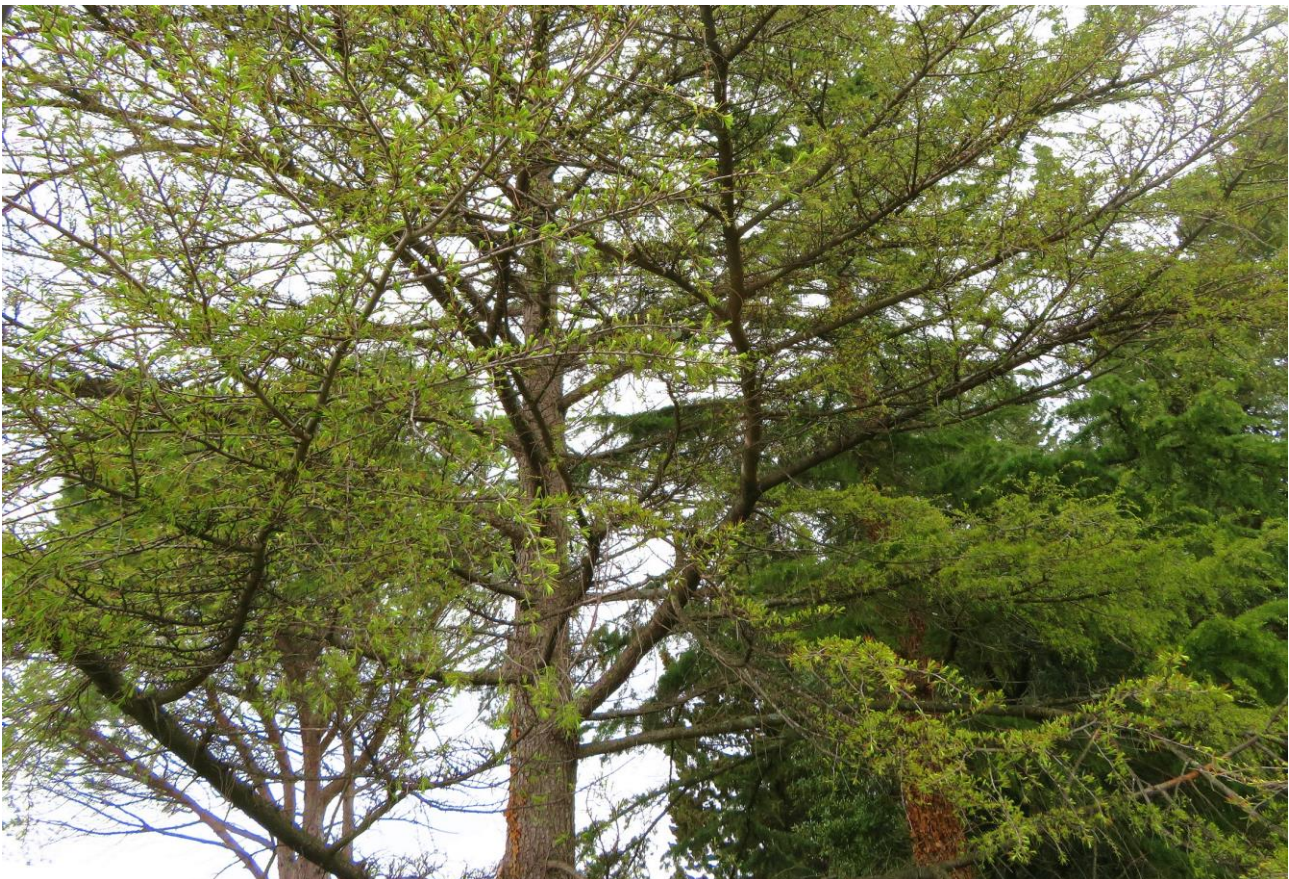
Abb. 2: Larix decidua subsp. decidua ; Erstfund für die Insel Krk (kultiviert).

Larix decidua MILL. subsp. decidua (Abb. 2); sehr selten kultiviert. Erstmals in Kultur beobachtet: SSW Malinska/Malisca/Durischal, Milčetići, N 45°07'13,14", E 14°31'22,84", 8 m alt.; 12.04. 2019.