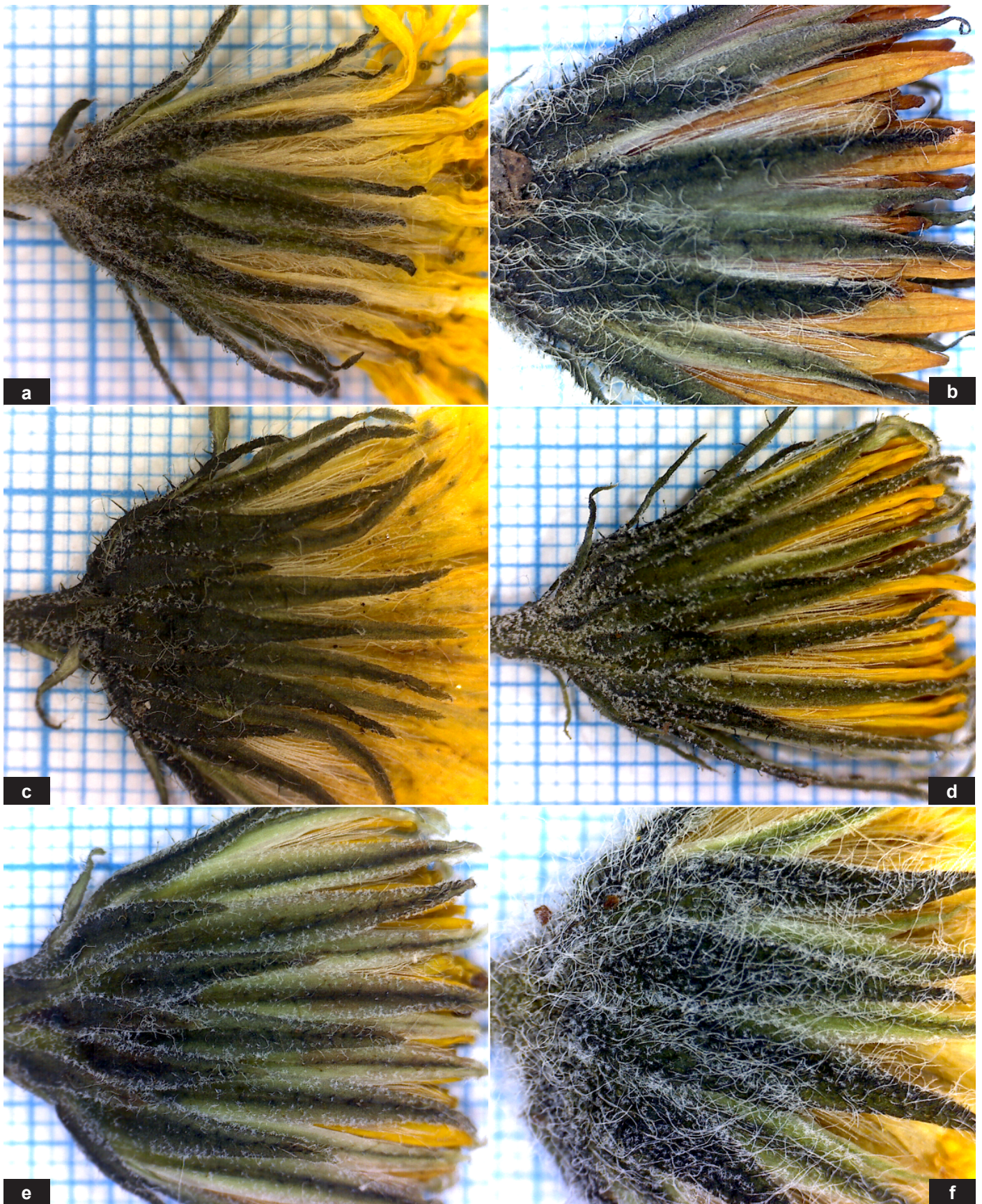
Fig. 17: Tracht der Körbe – a: H. picenorum subsp. falsobifidum , b: H. montis-florum subsp. soldanoi , c: H. orodoxum subsp. pseudonaegelianum , d: H. glaucum subsp. serenaiae , e: H. bupleuroides subsp. tririvicola , f: H. chloropsis subsp. apuianorum .