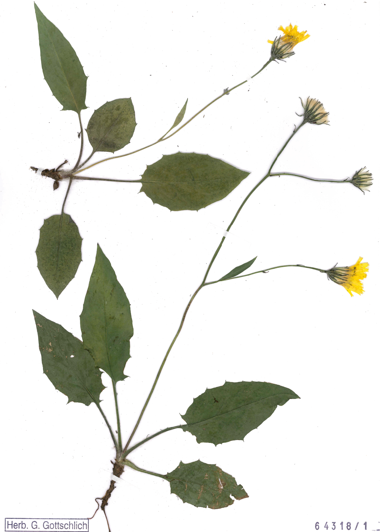
Fig. 7: Hieracium squarrososofurcatum (Habitus).