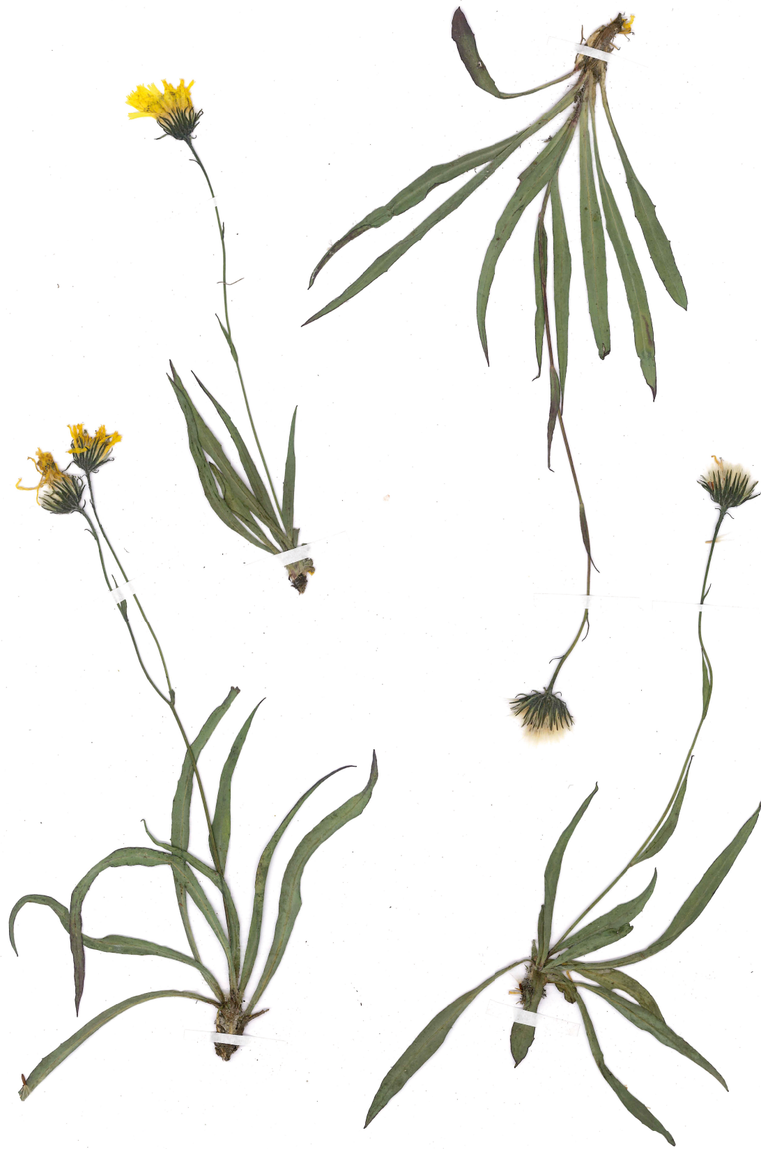
Fig. 11: Hieracium orodoxum subsp. pseudonaegelianum (Habitus).