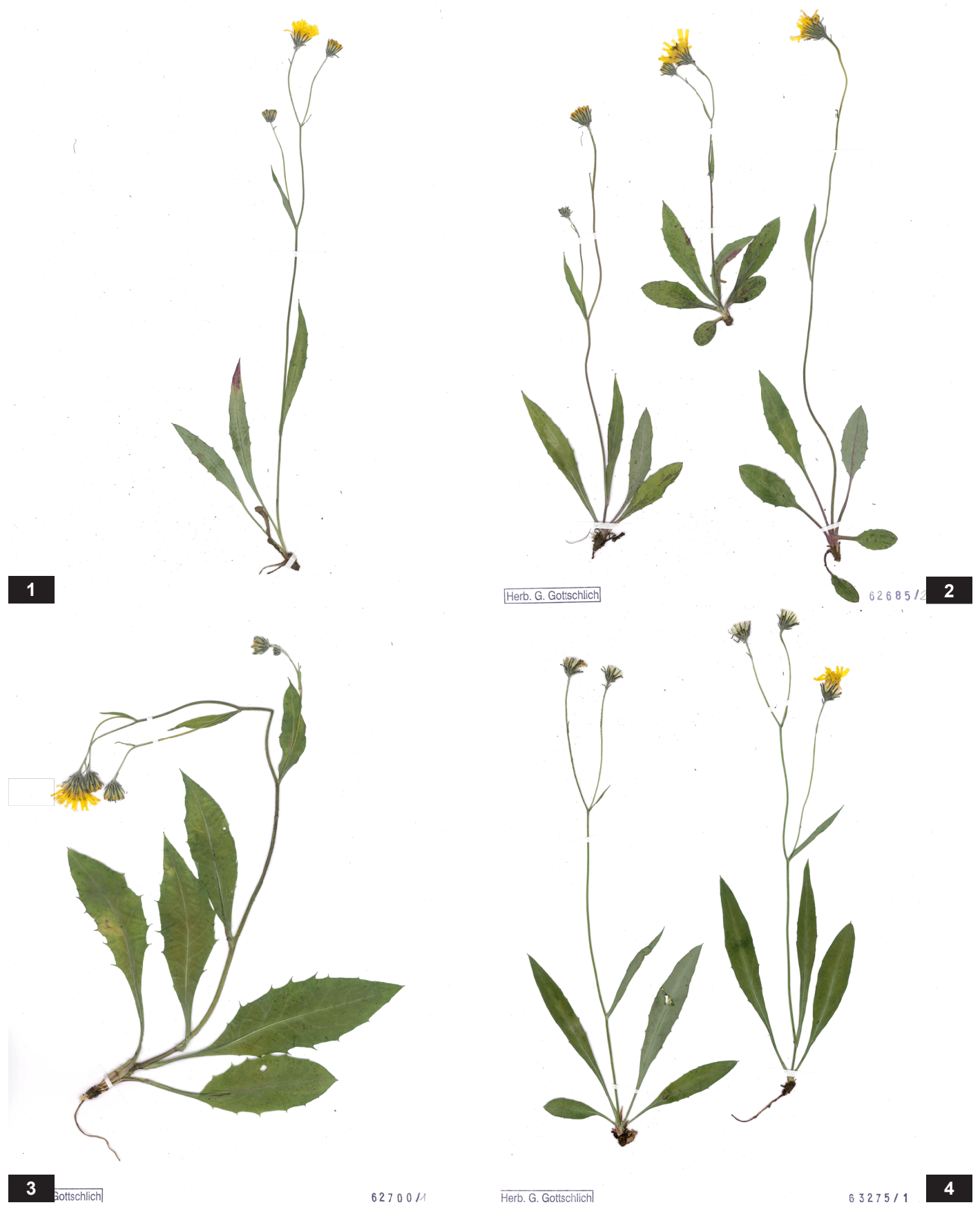
Fig. 2: Morphologische Variabilität von Hieracium juengeri .