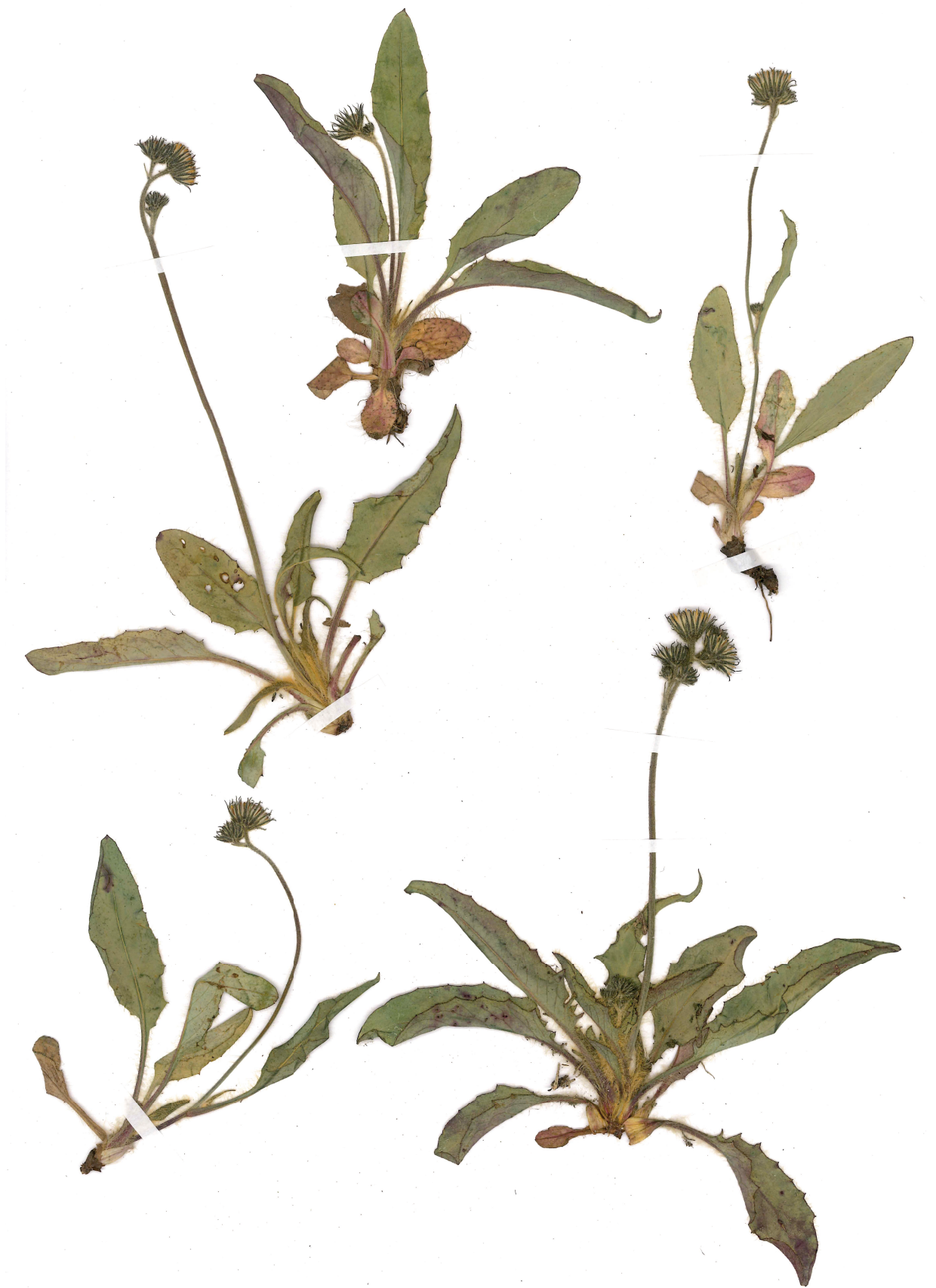
Fig. 15: Hieracium schmidtii subsp. marchettii (Habitus).