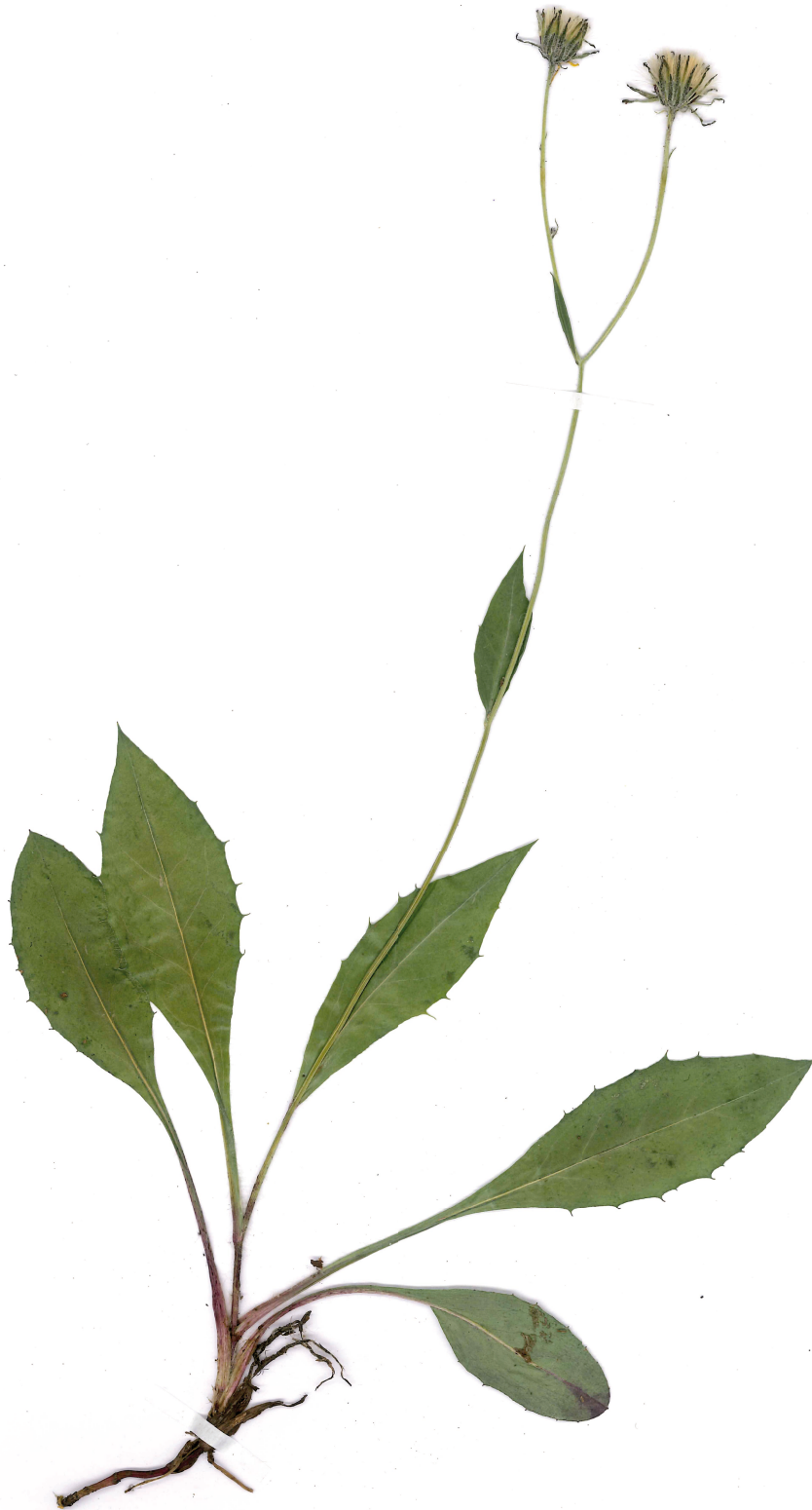
Fig. 5: Hieracium sparsivestitum (Habitus).