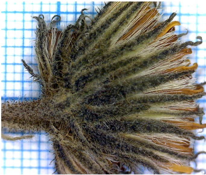
Fig. 18: Tracht der Körbe: H. schmidtii subsp. marchettii .