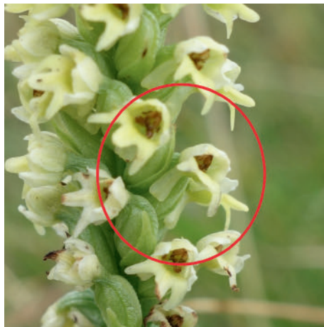
Abb. 25: Der Sporn von Pseudorchis albida ist am Ende stumpf und gegabelt, 3,8–4 mm lang, 03.07.2019, Spital am Pyhrn, Wurzeralm, Halssattel, OÖ.