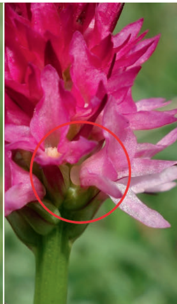
Abb. 23: Sporn von Nigritella bicolor var. bicolor und var. rubida erreicht eine Länge von 1,5–1,8 mm, 03.06.2018, Spital am Pyhrn, Lahnerkogel, OÖ.