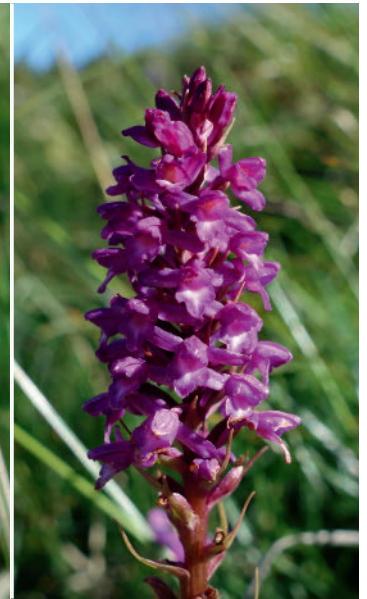
Abb. 4: Gymnadenia odoratissima , Spital am Pyhrn, Lahnerkogel, 01.07.2018, OÖ.