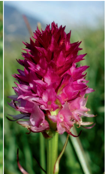
Abb. 8: Nigritella bicolor var. bicolor , Spital am Pyhrn, Lahnerkogel, 14.07.2020, OÖ.

gemeinsam mit Gymnadenia odoratissima und den vom Autor gefundenen Hybriden am selben Standort vorkommen, würde diese Kombination auch als Eltern der neu gefundenen Hybride ×Gymnigritella (im Jahr 2018 insgesamt 11 Exemplare) in Frage kommen. Die Hybride ×Gymnigritella suaveolens (Abb. 13, 17, 28) mit den Eltern Gymnadenia conopsea \times Nigritella rhellicani , würde ich wegen ihrer dunklen Blütenfarbe, den größeren, weiter geöffneten duftlosen Blüten, einem längeren Sporn (Länge 5 mm) und den wesentlich breiteren Laubblättern vorerst