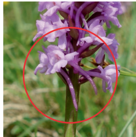
Abb. 26: Der Sporn von Gymnadenia conopsea var. alpina , ist 15,2–17 mm lang und spitz zulaufend, 03.07.2019, Spital am Pyhrn, Wurzeralm, Halssattel, OÖ.

von Nigritella bicolor Pollenpakete an den Saugrüssel angeheftet bekommen und beim Besuch einer Gymnadenia -Pflanze Pollen auf deren Narbe abgeben.