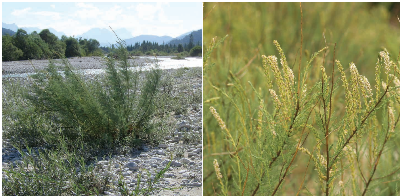
Abb. 1: links: Wuchsform – ausdauernder Strauch mit basaler Verzweigung rutenförmiger Äste; rechts: Blütenstände und Kurztriebe.

Dabei bilden Weiden-Tamarisken-Gebüsche, zusammengefasst als „3230 Alpine Flüsse mit Ufergehölzen von Myricaria germanica “, den zentralen Habitattyp für die europäischen Bergregionen. Die Ufer-Tamariske selbst kann dabei als Indikatorart für naturnahe sand- und schotterreiche Flussalluvione charakterisiert werden.