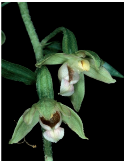
Abb. 6: Epipactis voethii , Cz, Kloboučky, 30.07.2004