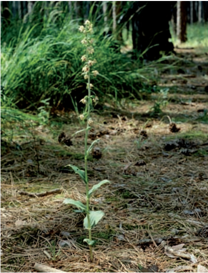
Abb. 1: Epipactis lapidocampi , Au, Weikersdorf, 13.07.2006