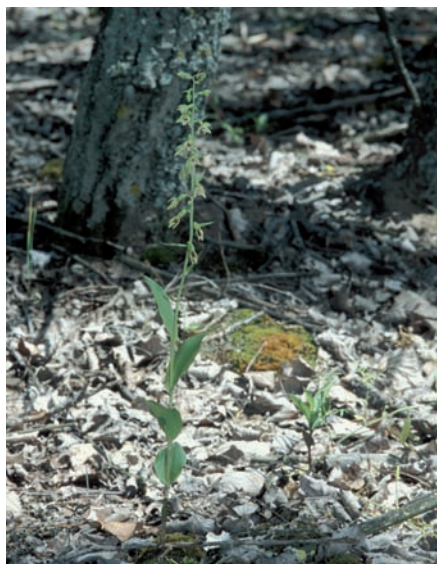
Abb. 15: Epipactis bugacensis , Hu, Soltvadkert, 26.06.2004