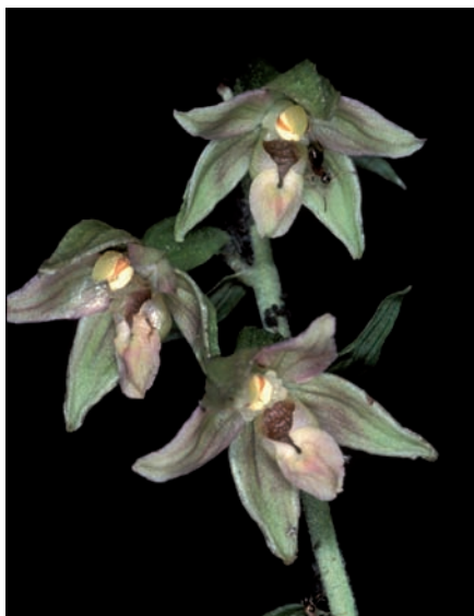
Abb. 8: Epipactis komoricensis , Sk, Ilava, 17.07.1999