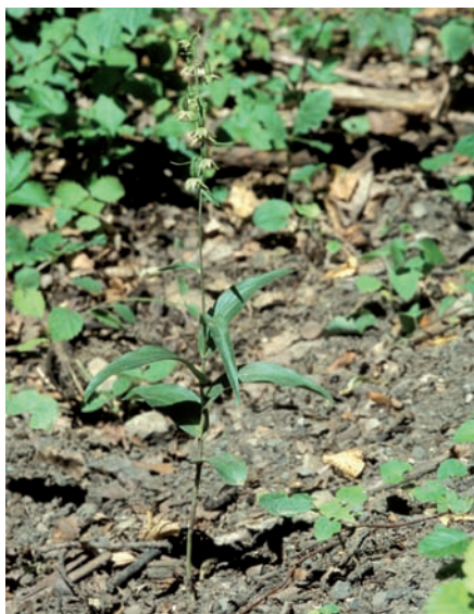
Abb. 5: Epipactis voethii , Cz, Koryčany, 31.07.2004