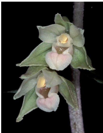
Abb. 12: Epipactis pseudopurpurata , Sk, Trenčianske Teplice, 17.07.1999