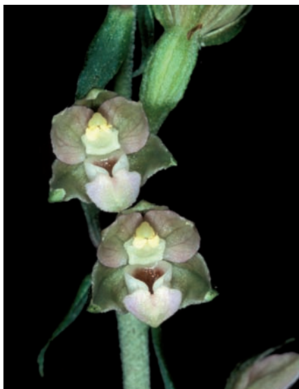
Abb. 14: Epipactis nordeniorum , Hu, Pécsvárad, 03.08.2004