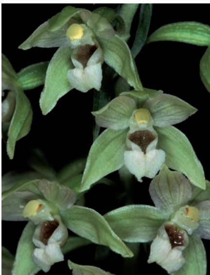
Abb. 20: Epipactis tallosii , Hu, Tiszaderzs, 15.07.2003