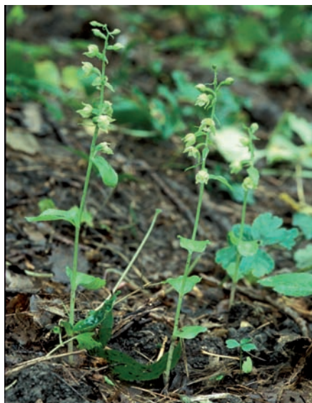
Abb. 23: Epipactis moravica , Cz, Králov, 06.08.2005