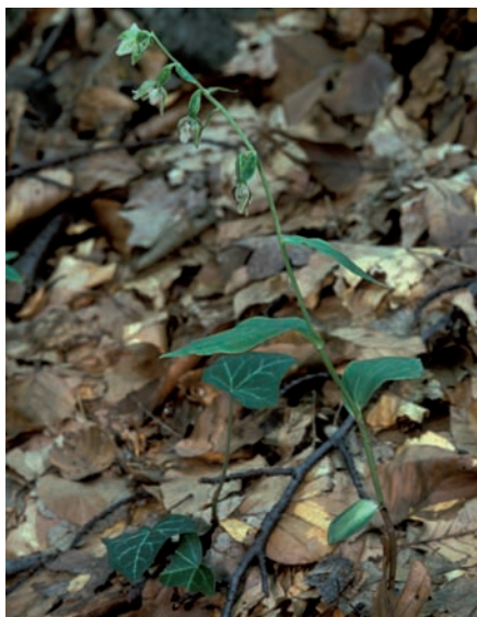
Abb. 7: Epipactis komoricensis , Sk, Ilava, 17.07.1999