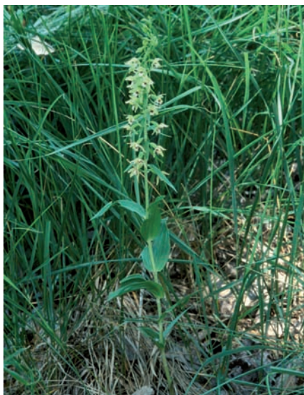
Abb. 19: Epipactis tallosii , Hu, Tiszaderzs, 15.07.2003