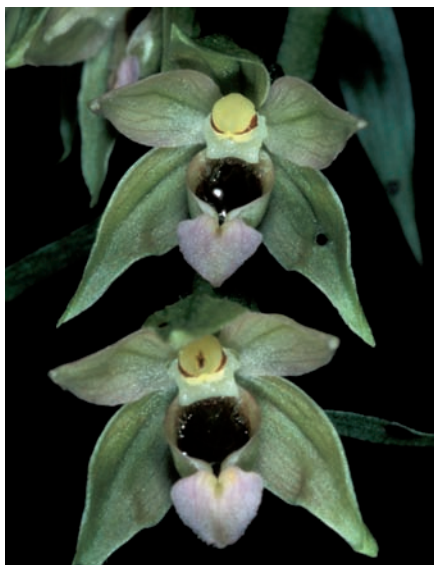
Abb. 22: Epipactis mecsekensis , Hu, Pécsvárad, 03.08.2004