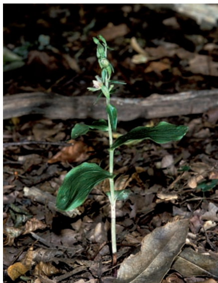
Abb. 13: Epipactis nordeniorum , Au, Lichendorf, 02.08.1993