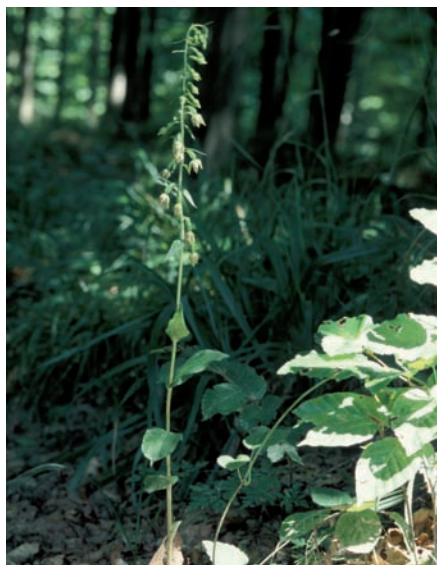
Abb. 21: Epipactis mecsekensis , Hu, Pécsvárad, 17.08.2004