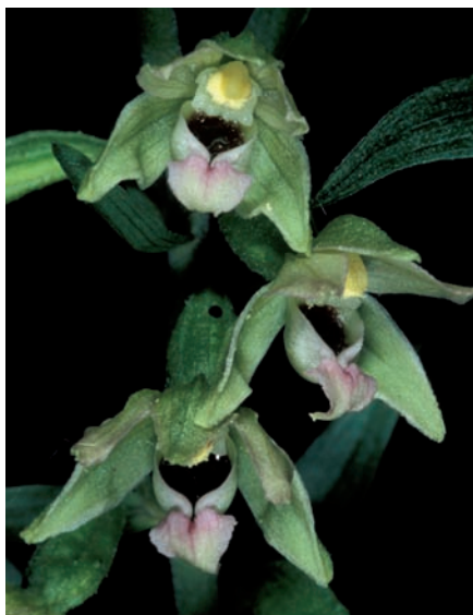
Abb. 16: Epipactis bugacensis , Hu, Soltvadkert, 26.06.2004