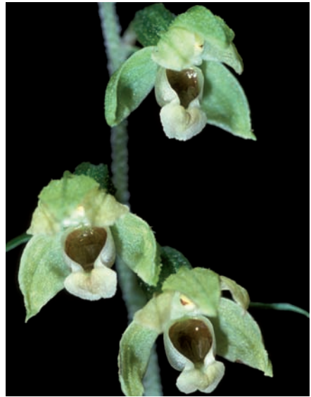
Abb. 4: Epipactis pontica , Au, Stift Rein, 03.08.1993