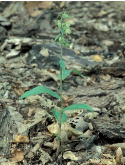
Abb. 3: Epipactis pontica , Au, Kohfidisch, 04.08.2004