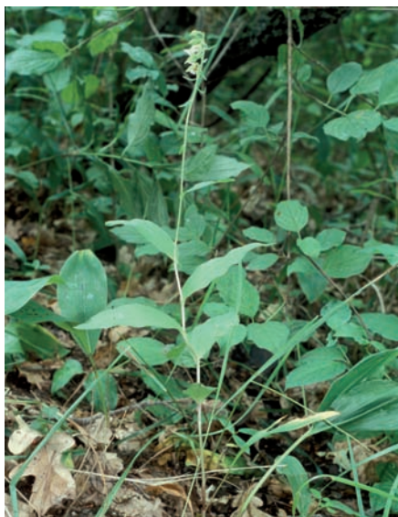
Abb. 25: Epipactis guegelii , Rm, Letea, 10.07.2006