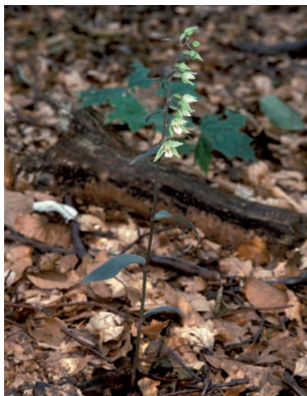
Abb. 11: Epipactis pseudopurpurata , Sk, Trenčianske Teplice, 17.07.1999