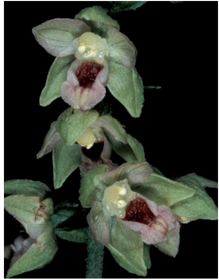
Abb. 2: Epipactis lapidocampi , Au, Weikersdorf, 13.07.2006