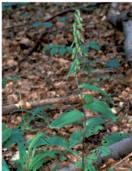
Abb. 9: Epipactis futakii , Sk, Trenčianske Teplice, 17.07.1999