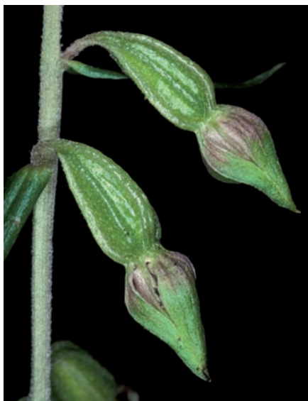
Abb. 10: Epipactis futakii , Sk, Trenčianske Teplice, 17.07.1999