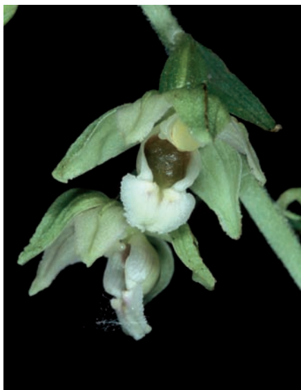
Abb. 27: Epipactis guegelii , Rm, Letea, 09.07.2006