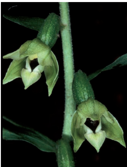
Abb. 18: Epipactis albensis , Cz. Suchá Loz, 06.08.2005