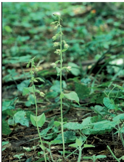
Abb. 17: Epipactis albensis , Cz, Králov, 07.08.2005