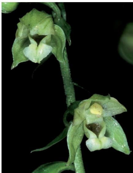
Abb. 24: Epipactis moravica , Cz, Králov, 06.08.2005