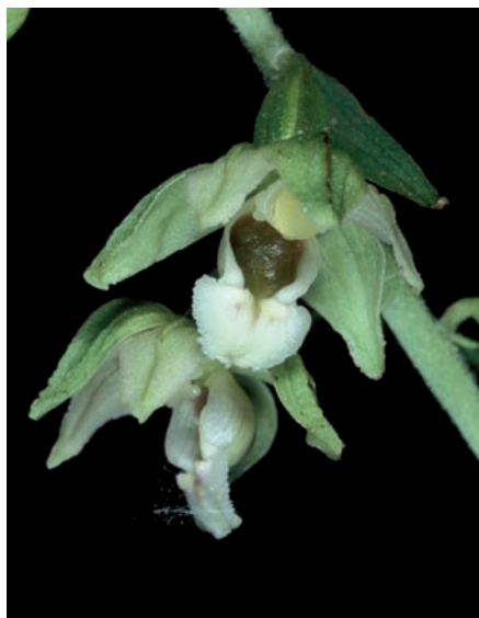
Abb. 27: Epipactis guegelii , Rm, Letea, 09.07.2006