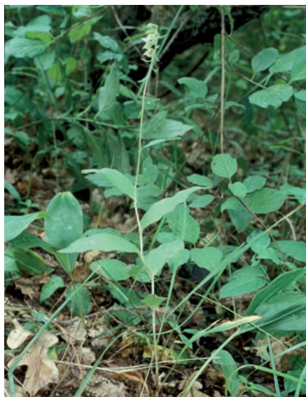
Abb. 25: Epipactis guegelii , Rm, Letea, 10.07.2006