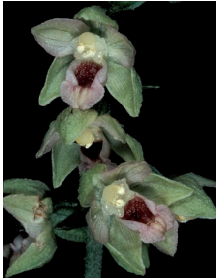
Abb. 2: Epipactis lapidocampi , Au, Weikersdorf, 13.07.2006