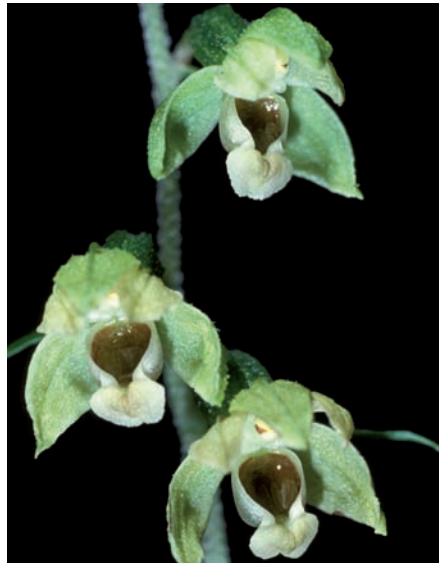
Abb. 4: Epipactis pontica , Au, Stift Rein, 03.08.1993