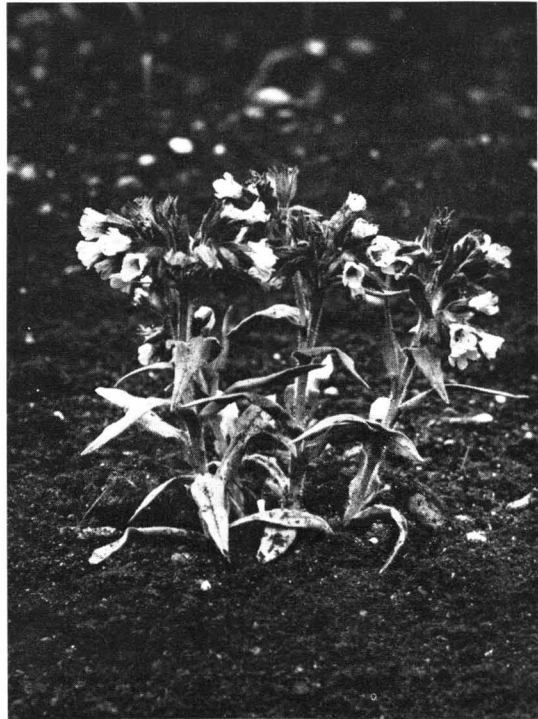
Abb. 2. Pulmonaria angustifolia vom gleichen Fundort; kultiviert im Botanischen Garten München.