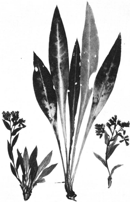
Abb. 1. Pulmonaria angustifolia von Stetten bei Karlstadt in Unterfranken. Herbarexemplare.