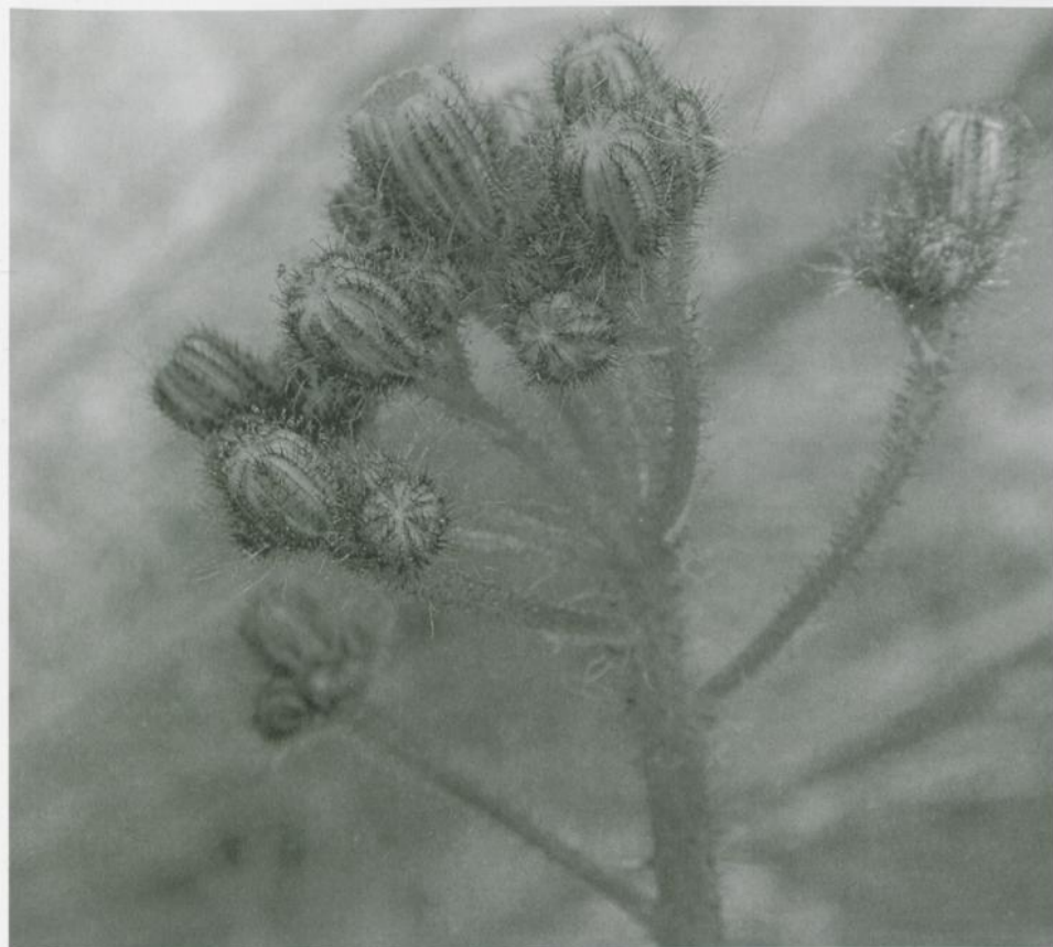
Abbildung 2. Hieracium bauhini subsp. besserianum ist eine im Aachener Raum verbreitete Sippe mit apomiktischer Fortpflanzung. B – Kelmis, TK 5202.31, 20.05.2004.

Abb. 1 zeigt einen Vergleich der Ergebnisse des Kastrationsexperiments zu relativ hochgradig apomiktischen Sippen der Untergattungen Hieracium und Pilosella . Es zeigen sich hierbei