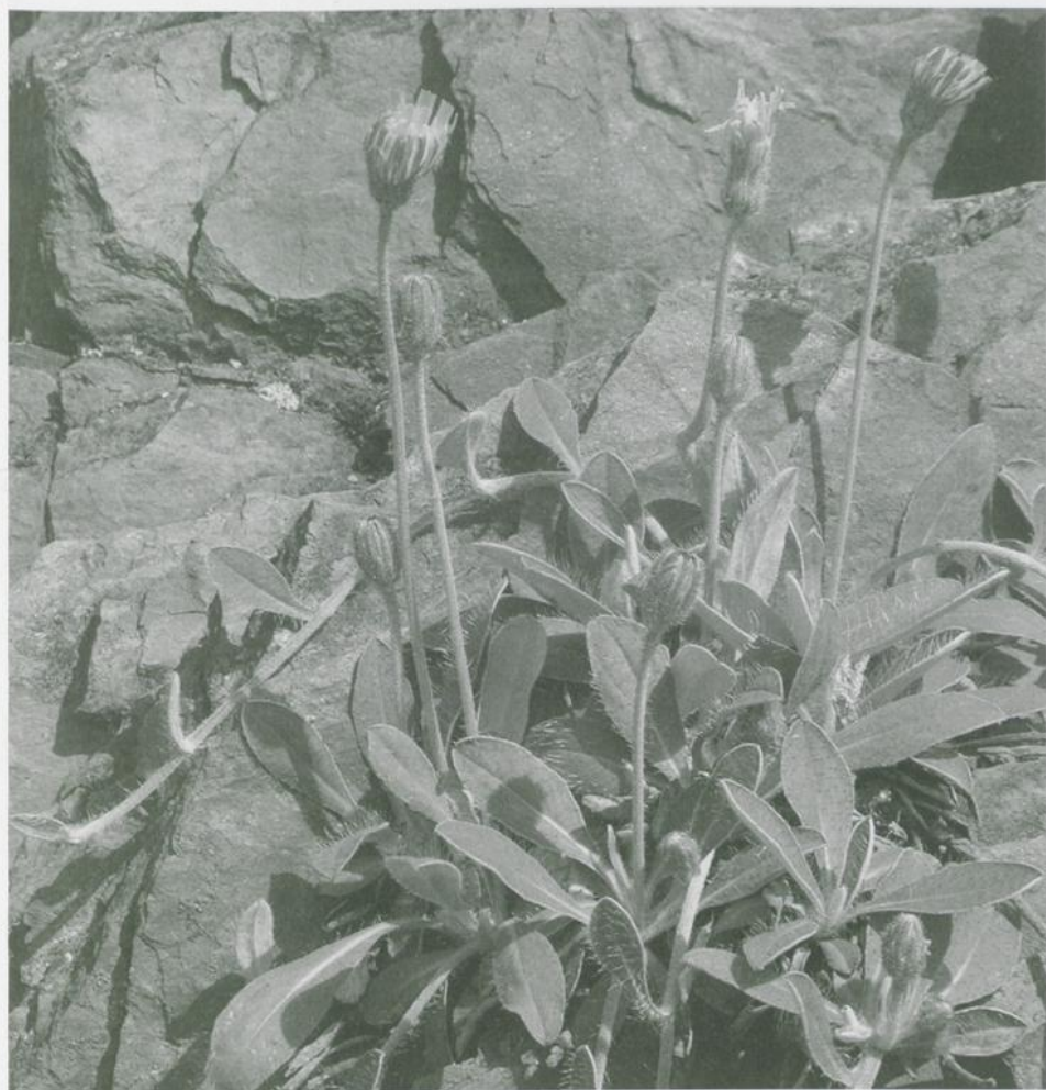
Abbildung 3. Hieracium pilosella ist im Rheinland weitgehend sexuell. Das gilt auch für morphologisch auffällige und lokal relativ einheitliche Population wie z. B. die um Altenahr (TK 5407.44, 06.06.2006) an natürlichen und naturnahen Felsstandorten zu findende Lokalpopulation.

Es handelt sich um ein spät blühendes, hochwüchsiges Hieracium piloselloides mit doldigem bis doldenrispigem Kopfstand. Die Köpfe sind relativ hell und tragen viele lange Haare und mäßig Flocken und Drüsen. Die Grundblätter sind oberseits öfter reichhaarig, spatelig bis lanzettlich und hell blaugraugrün. Flocken sind noch nicht einmal auf der Mittelrippe der Blatt-