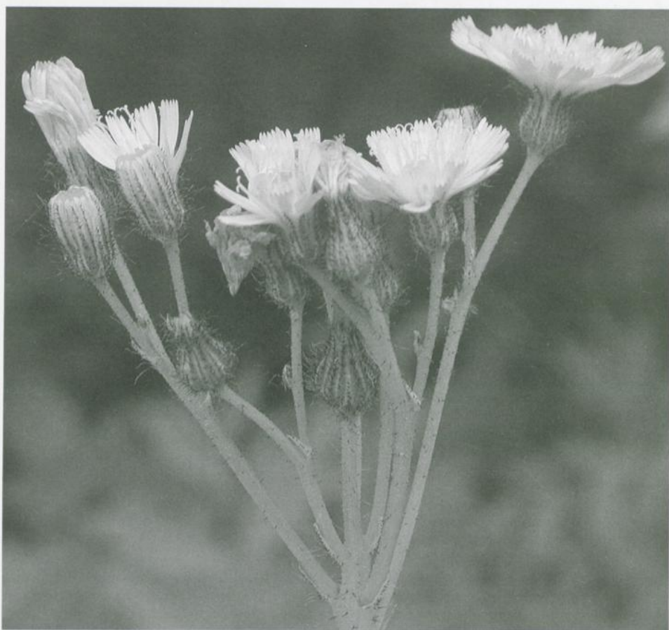
Abbildung 4. Das einzige (fast) sexuelle hochstängelige Hieracium der Untergattung Pilosella gehört zu Hieracium piloselloides s. lat. Aachen, TK 5202.12, 14.06.2009.