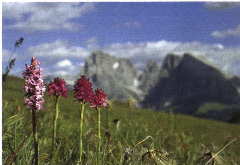
Abb. 1: Gymnadenia conopsea (links) und Gymnigritella suaveolens. Dolomiten.