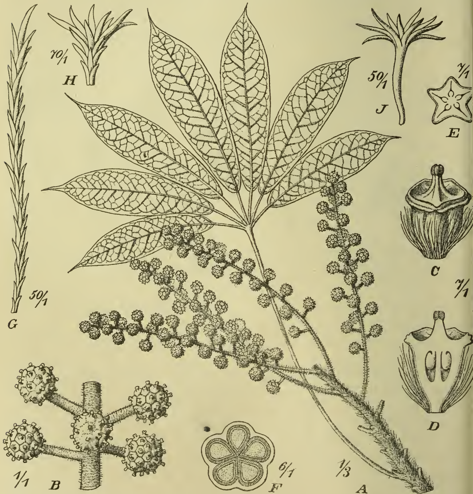
Fig. 4. Schefflera setulosa Harms. A Blütenstand mit Blatt, B Teil des Blütenstandes mit abgeblühten Köpfchen, C Blüte ohne Blumenblätter, D im Längsschnitt, E Fruchtknoten im Querschnitt, F Frucht im Querschnitt, G, H, J Haare vom Fruchtknoten, Köpfchenstiel und Blatt.

10. Sch. setulosa Harms n. sp. — Frutex comosus, ramulis apice dense vel densissime setuloso-hispidis (setulis longis molliusculis subsericeis), serius subglabrescentibus; folia ampliuscula digitata, petiolo basi setuloso