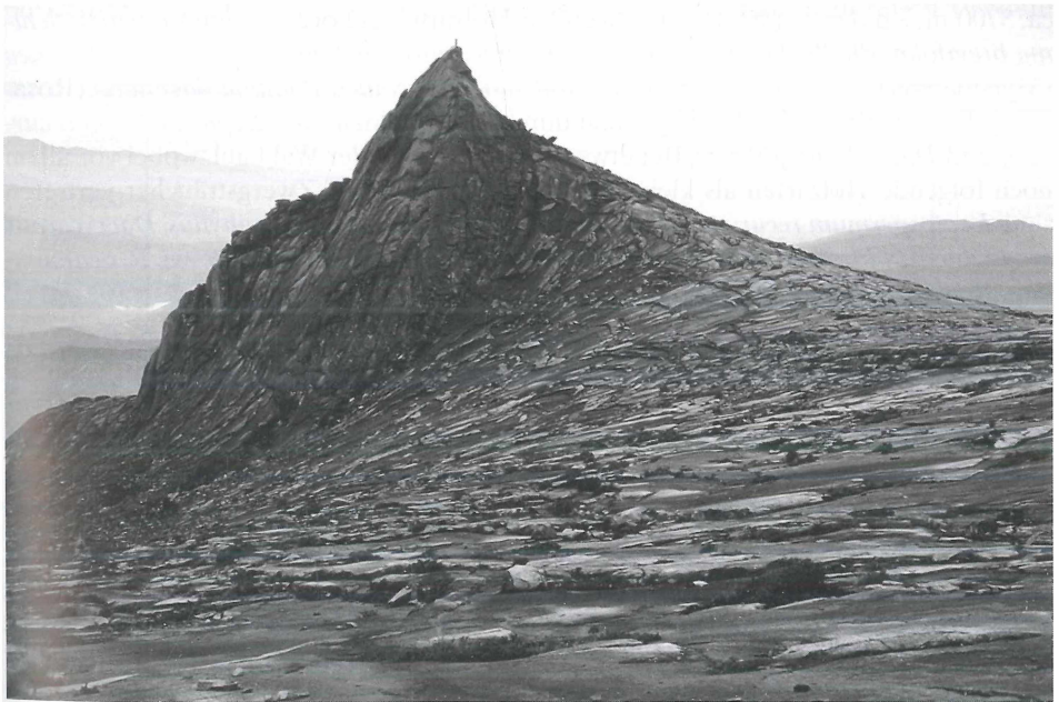
Foto 4: South Peak (3933 m). Im Vordergrund der eiszeitlich großflächig polierte Granit mit den obersten spalterartigen Zwergsträuchern ( Leptospermum recurvum , Rhododendron ericoides ).