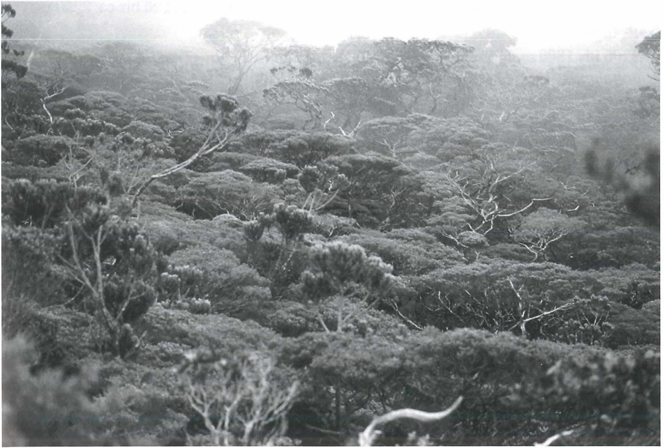
Foto 3: Oberer Bergregenwald der Wolkenzone (ca. 2600 m), bestehend vor allem aus Leptospermum recurvum und dem Nadelholz Dacrydium gibbsiae (im Vordergrund links und Mitte).