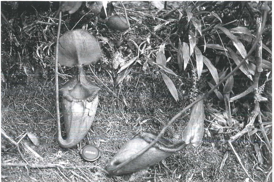
Foto 2: Nepenthes kinabaluensis , eine endemische Hybride von N. rajah und N. villosa . Verbreitet im oberen Bergregenwald, ca. 3000 m.