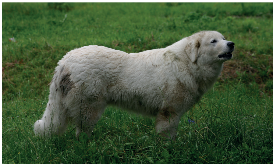
Tradici slovenských čuvačů-hlídačů stád pomáhá zachovat projekt organizace Slovak Wildlife Society (více na str. 22-23)