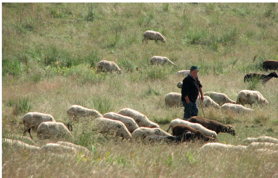
Přímý dohled nad přemísťujícími se stády ovcí je neodmyslitelnou součástí pastevecké praxe například v Rumunsku