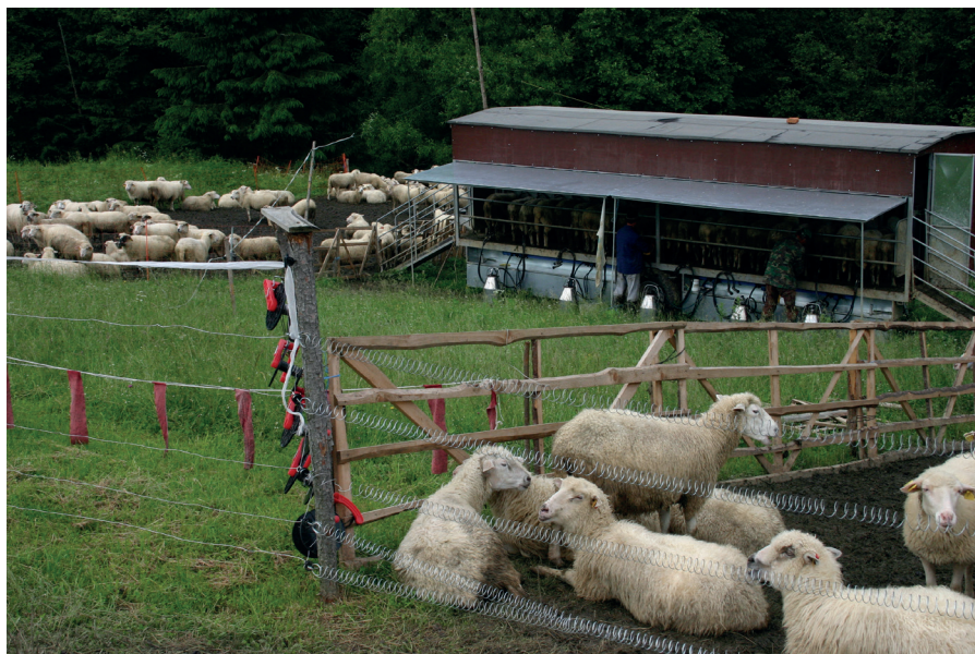
Ovčí farma na středním Slovensku, jištěná před útoky šelem elektrickým ohradníkem s několika dráty

S kontrolou dostatečného napětí v ohradníku mohou být nápomocny světelné, zvukové nebo SMS alarmy, které v případě poklesu napětí v ohradníku, způsobeného např. pádem stromu, prorůstáním trávy nebo jiným poškozením, podají signál. Majitel tak minimalizuje čas, během kterého ohradník není funkční.