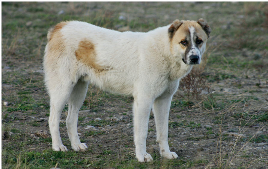
Středoasijský pastevecký pes se běžně používá k hlídání stád například v Gruzii

Uzbekistán a Ruska můžeme setkat s různě pojmenovanými místními variantami (al-abaj, dahmarda apod.). Pastevci těmto psům, kteří se tradičně využívají také k psím zápasům, často kupírují uši a zkracují oháňky.