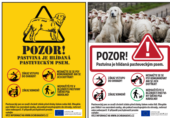
Ukázky upozornění používaných u stád ovcí chráněných pyrenejskými horskými psy v Českém ráji

majitele psa v případě, že by pastevecký pes přesto napadl člověka nebo jiného psa, který by vniknul do ohrady? Pokud péče o psa nebyla zanedbaná a pes slouží vlastníku k výkonu povolání či k jiné výtěžné činnosti nebo obživě, stojí občanský zákoník (č. 82/2012 Sb.) spíše na straně vlastníka psa, tedy chovatele, který za případnou škodu není odpovědný (viz právní rozbor v Příloze 3). Zatím však soudy žádný podobný případ neřešily a existují tak jen 2 nezávislé právní výklady, které tento přístup podporují 2 .