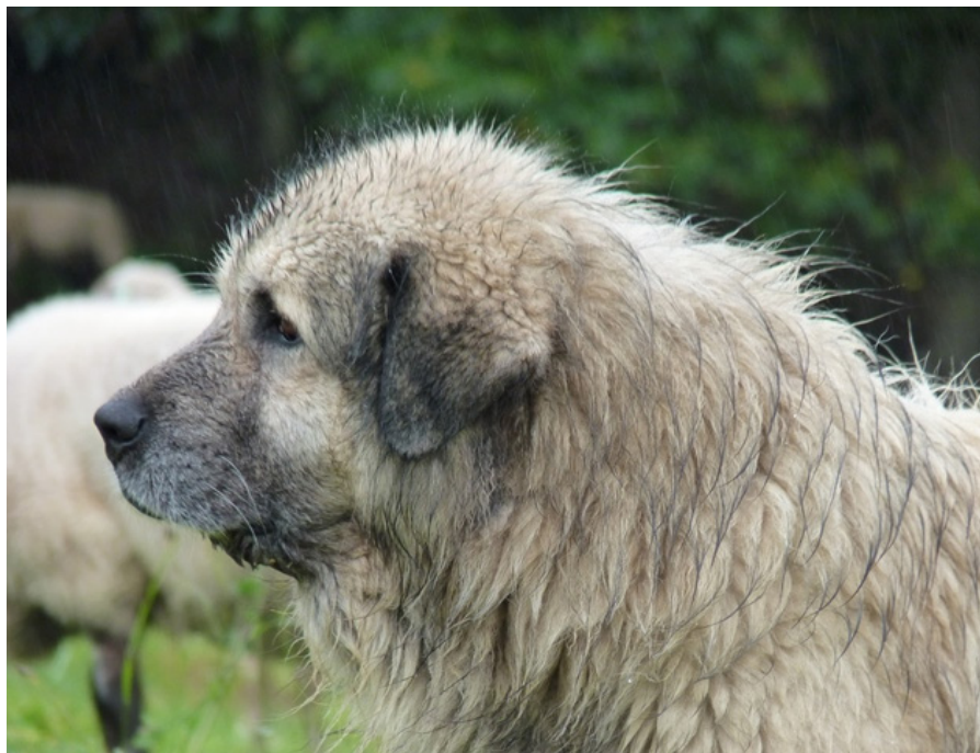
Šarplaninský pastevecký pes používaný k hlídání ovcí v Beskydech