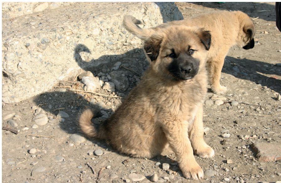
Dvouměsíční štěně křížence kavkazského pasterveckého psa, jehož rodiče byli dobrými hlídači dobytka

Vyberte si štěňata od osvědčeného chovatele a nechte si ukázat jejich rodiče, alespoň matku. Prostředí by mělo být čisté a štěně sebevědomé, společenské a přátelské, vyzrálé a silné, s pevnými nohama. Nemělo by trpět výtokem z očí, nosu a uší. Zjistěte stav svalů a kostry, zkontrolujte, zda je hlava správně tvarovaná. Čelist a zuby by měly být pěkně rovně střižené. Neberte si štěně, které je velmi plaché nebo naopak velmi dominantní nad svými sourozenci. Rodiče by měli mít zdravé plece, nohy a chodidla a neměli by mít poruchu růstu kyčlí. Ujistěte se, že ani jeden rodič se nechová příliš agresivně ani plaše, protože tyto znaky mohou zdědit jeho potomci.