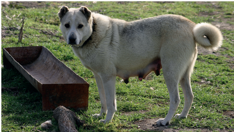
Kojící fena středoasijského pasteveckého psa, proti útokům vlků chráněná obojkem s trny

před medvědy a vlky v Itálii už více než dva tisíce let. Mezi další bílá plemena patří kuvasz, podhalaňský ovčák, slovenský čuvač a pyrenejský horský pes. Pastevci zřejmě také bílé psy snáze rozeznávali ve tmě od vlků.