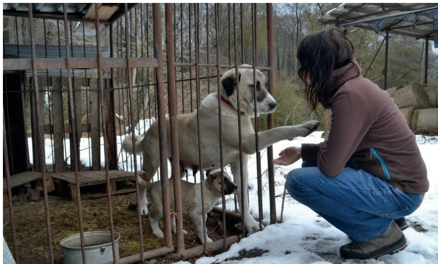
Fena anatolského pasteveckého psa se štěnětem v pracovním chovu na Slovensku

Starobylé psí plemeno, pocházející z Anatólie, dnešního Turecka. Jeho nejčastější plavé zbarvení s černými ušima a maskou bývá označováno jako kangal nebo karabaš. Psi jsou mohutně stavění, hbití a dosahují váhy 40–60 kg. Povahou patří mezi mírnější plemena, která nejsou agresivní k lidem, svá stáda však svědomitě chrání proti všem vetřelcům. K ochraně stád před útoky šelem se využívají také na Slovensku nebo v Německu.