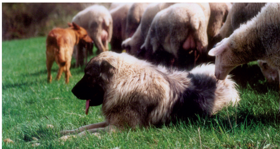
Kavkazský pastevecký pes v těsném kontaktu s ovce, Slovensko

Výše popsaný systém je vhodný pro mnoho chovatelů. V případě malých farem, kam pravidelně přicházejí různé skupiny lidí, však může být vhodnější jiný systém. Majitelé jedné australské farmy s lamami alpaka prováděli své psy (maremmy) na vodtku po farmě a seznamovali je s jejími částmi včetně kurníků a výběhů. To dělali tak dlouho, dokud s nimi pes nechodil a neposlouchal je bez vodtka. Pes se tak seznámil s oblastí, kterou měl hlídat, obdržel patřičné instrukce a postupně si vytvořil k alpakám potřebné pouto.