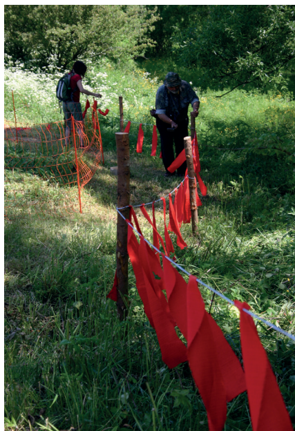
Instalace barevných flader, umísťovaných 1,5–2 metry od elektrického ohradníku Tato zradidla mohou až dva měsíce fungovat jako ochrana proti útokům vlků