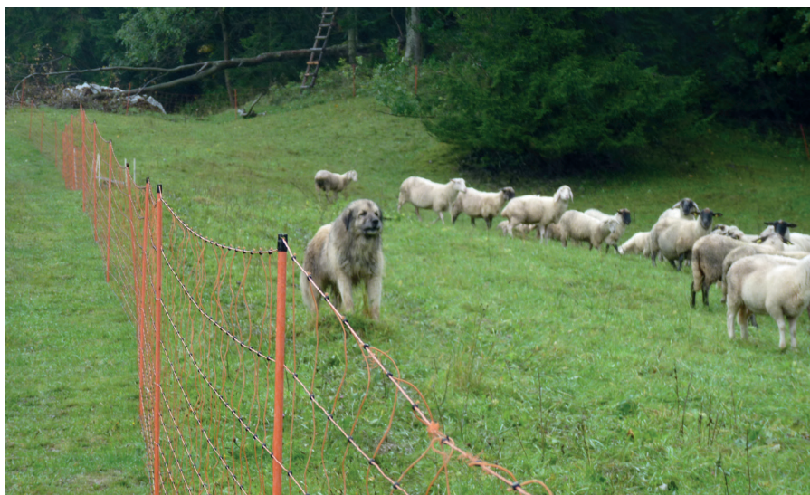
Kombinace pasterveckého psa (šarplaninec) a elektrického ohradníku slouží jako účinná ochrana před útoky šelem v Javorníkách na území CHKO Beskydy