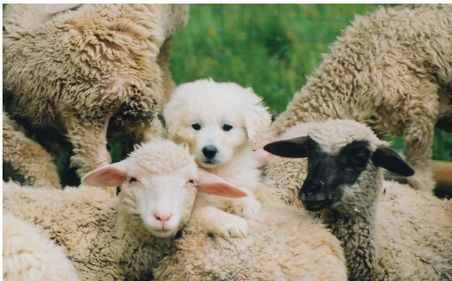
Osmítýdenní štěně slovenského čuvače se poznává s ovce

Pokud chceme, aby pes pobýval se stádem co nejvíce, je nutné, aby se stal součástí stáda už v mladém věku. „Psa je třeba vychovávat se zvířaty, jež bude chránit. Měl by se s nimi sblížit a vytvořit si k nim pouto“ (Raymond Coppinger). Mezi 4 a 14 týdny věku mají domácí psi tzv. „zásadní období“, během kterého si dokážou vytvořit vztahy nejen s jinými psy, ale i s dalšími druhy zvířat včetně zvířat hospodářských. Tento proces je usnadněn tím, že pastevečtí psi mají pouze slabě vyvinuté lovecké instinkty a dobytek je tudíž mezi sebe snadněji přijme.