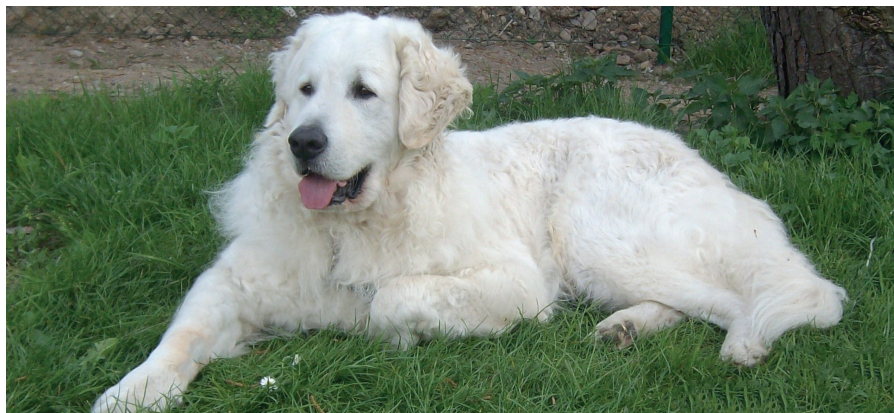
Kuvasz – Foto: Sabine A. Schneiderová

Efektivita kuvaszů jako pasteveckých hlídacích psů není oproti jiným plemenům dosud zcela prozkoumána. Jisté však je, že jsou poměrně aktivní, agresivní a rychle útočí.