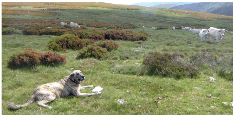
Jeden z mastinů chrání stádo krav ve Španělsku, Kastilie a León