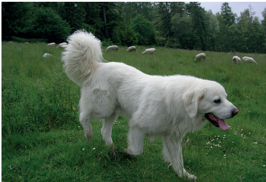
Podhalaňský ovčák z polských Bieszczad

Podhalaňský ovčák, známý také pod názvem tatranský ovčák, bývá často k vidění v polských Karpatech, kde s úspěchem brání stáda ovcí před šelmami. Toto jeho tradiční využití propagují od poloviny 90. let ochránáři a biologové v Beskydech a Bieszczadech. Dobře vycvičený podhalaňský ovčák prý dokáže ovce nejen hlídat, ale také je shánět a nahánět dle instrukcí pastevce, ačkoliv si při tom počíná jinak než specializovaní honáčtí psi jako border kolie. Také se tvrdí, že tito ovčáci raději zůstávají u stáda, než by pronásledovali šelmy.