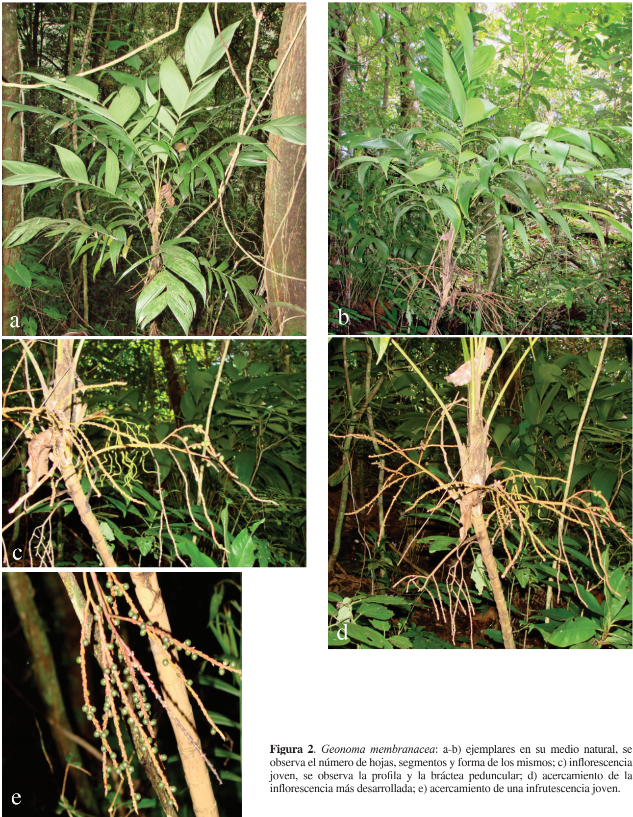
Figura 2. Geonoma membranacea : a-b) ejemplares en su medio natural, se observa el número de hojas, segmentos y forma de los mismos; c) inflorescencia joven, se observa la profila y la bráctea peduncular; d) acercamiento de la inflorescencia más desarrollada; e) acercamiento de una infrutescencia joven.