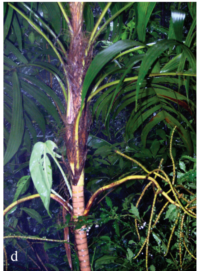
Figura 3. Geonoma undata : a-b) ejemplar en su medio natural, mostrando número de hojas, segmentos y forma de los mismos; c) acercamiento donde se observa la inflorescencia infrafoliar y los entrenudos del tallo; d) acercamiento de la inflorescencia, donde se puede observar la bráctea peduncular muy larga