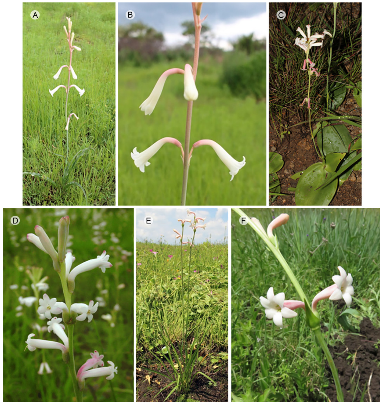
Figura 1: A, B. Polianthes montana Rose; C, D. P. platyphylla Rose; E, F. P. venustuliflora E. Solano, García-Mend. & R. Ríos-Gómez.

cm, sucesivamente más cortas hacia el ápice, lineares, las florales ovadas, ápice largamente acuminado, reduciéndose gradualmente en tamaño hacia la porción distal; bracteolas lineares a lanceoladas, ápice agudo; inflorescencia una espiga, 24-68 cm de largo, nudos florales 3-7, entrenudos que disminuyen de tamaño hacia la porción distal, el basal 2-11.5 cm de largo; flores sésiles, geminadas, color blanco, rosadas después de la antesis, fragantes, 1.9-2.8