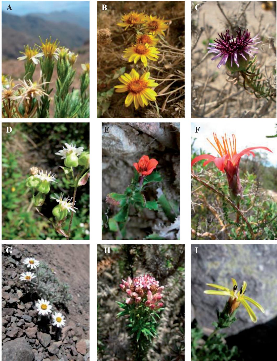
FIGURA 1. Ejemplos de especies chilenas endémicas de la subfamilia Mutisioideae. A: Chaetanthera glandulosa var. glandulosa J. Remy, Cordillera El Melón, enero 2011; B: Chaetanthera incana Poepp. ex Less., Cerros de Cantillana, diciembre 2010; C: Gypothamnium pinifolium Phil., Paposo, octubre 2009; D: Moscharia pinnatifida Ruiz & Pav., Ocoa, noviembre 2010; E: Mutisia brachyantha Phil., Vilches, enero 2011; F: Mutisia spectabilis Phil., Cuesta El Espino, septiembre 2009; G: Oriastrum apiculatum (J. Remy) A.M.R. Davies, Portillo, enero 2010; H: Oxyphyllum ulicinum Phil., Paposo, octubre 2009; I: Perezia poeppigii Less., Portillo, enero 2010.