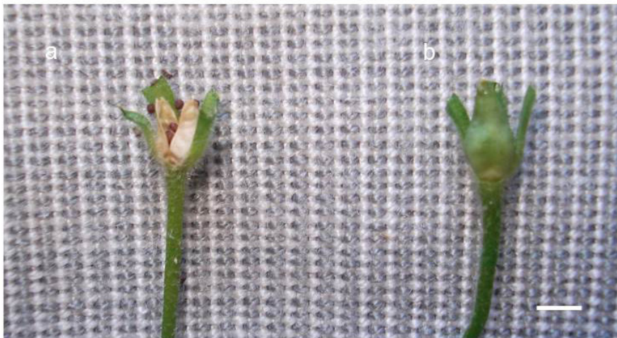
Fig. 3. Formación de frutos en especies nativas de Petunia utilizadas en los cruzamientos intergenéricos. a- Frutos con dehiscencia de Petunia interior x Calibrachoa caesia . b- Fruto inmaduro de Petunia interior x Calibrachoa hybrida 'kabloom yellow'. Aumento: barra = 3 ml Fig. 3. Fruit formation in native Petunia species used in intergeneric crosses. a- Fruits with dehiscence of inner Petunia x Calibrachoa caesia . b- Immature fruit of Petunia interior x Calibrachoa x hybrida 'kabloom yellow'. Increase: bar = 3 ml

glanduloso-pilosos. Hojas basales con pecíolo de hasta 15 mm, tornándose más cortos o sésiles hacia el ápice; láminas de 34-55 x 15-35 mm, elípticas, angostamente-elípticas u ovadas, ápice agudo, base atenuada, decurrente formando un falso pecíolo, densamente glandular-pilosa, membranácea, con nervadura primaria evidente, secundarias poco evidentes. Flores axilares con pedicelos de 28-33 mm, ascendentes, glandular-pilosos; cáliz formado por cinco sépalos con lóbulos de 8-10 x 2 mm, verdosos, linear-oblongos, ápice obtuso, glandular-piloso; corola de 25-30 mm de longitud, acampanulada-infundibuliforme, ligeramente zigomorfa, purpúrea, con garganta purpúrea-clara hacia el interior del tubo, algo reticulada, limbo de 28-33 mm de diámetro, con lóbulos suborbiculares, ápices obtusos; filamentos adnatos 2,5-4,5 mm a la base de la corola, el menor de 7-10 mm, el par mediano de 11-13 mm y el par mayor de 12-15 mm, anteras de 1-1,5 mm, abriéndose completamente, polen amarillo; ovario de 1.8-2,2 mm, cónico, estilo de 9-11 mm, estigma dilatado, obcónico (Fig. 4 y 5).