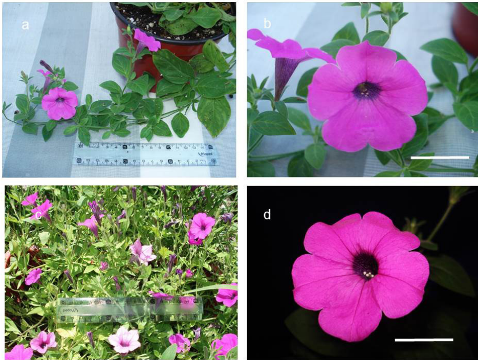
Fig. 4. Morfología del híbrido entre Petunia y Calibrachoa (HPC). a- Vástago con flores. b y d- Detalle de la flor. c- Planta cultivada en cantero al aire libre. Aumento: barra = 20 ml