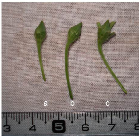
Fig. 1. Formación de frutos en especies nativas de Petunia utilizadas en los cruzamientos intergenéricos. a- Petunia integrifolia x Calibrachoa thymifolia . b- Petunia integrifolia x Calibrachoa caesia . c- Petunia integrifolia x Calibrachoa x hybrida 'kabloom yellow'.

Fig. 1. Fruit formation in native Petunia species used in intergeneric crosses. a- Petunia integrifolia x Calibrachoa thymifolia . b- Petunia integrifolia x Calibrachoa caesia . c- Petunia integrifolia x Calibrachoa x hybrida 'kabloom yellow'.