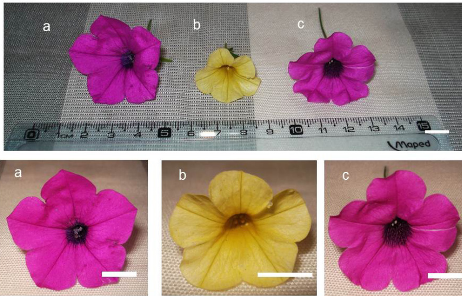
Fig. 5. Características morfológicas de la flor del híbrido HPC y sus parentales. a- Detalle de la flor de Petunia inflata . b- Detalle de la flor de Calibrachoa hybrida 'kabloom yellow'. c- Detalle de la flor de HPC. Aumento: barra = 10 ml