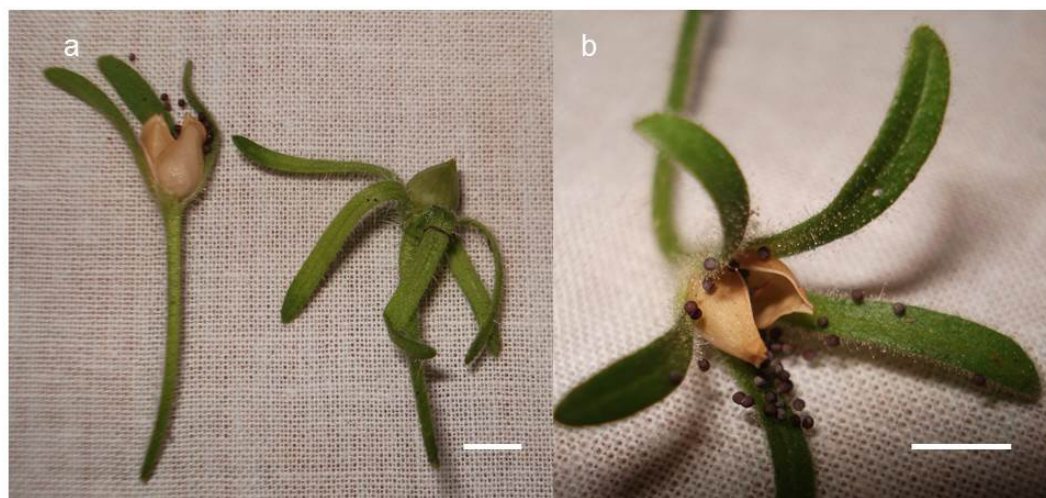
Fig. 2. Formación de frutos en especies nativas de Petunia utilizadas en los cruzamientos intergenéricos. a- Frutos de Petunia inflata x Calibrachoa caesia . b- Fruto con dehiscencia de Petunia inflata en cruzamiento testigo ( P. inflata x P. inflata ). Aumento: barra = 4 ml

Fig. 1. Fruit formation in native Petunia species used in intergeneric crosses. a- Petunia integrifolia x Calibrachoa thymifolia . b- Petunia integrifolia x Calibrachoa caesia . c- Petunia integrifolia x Calibrachoa x hybrida 'kabloom yellow'.