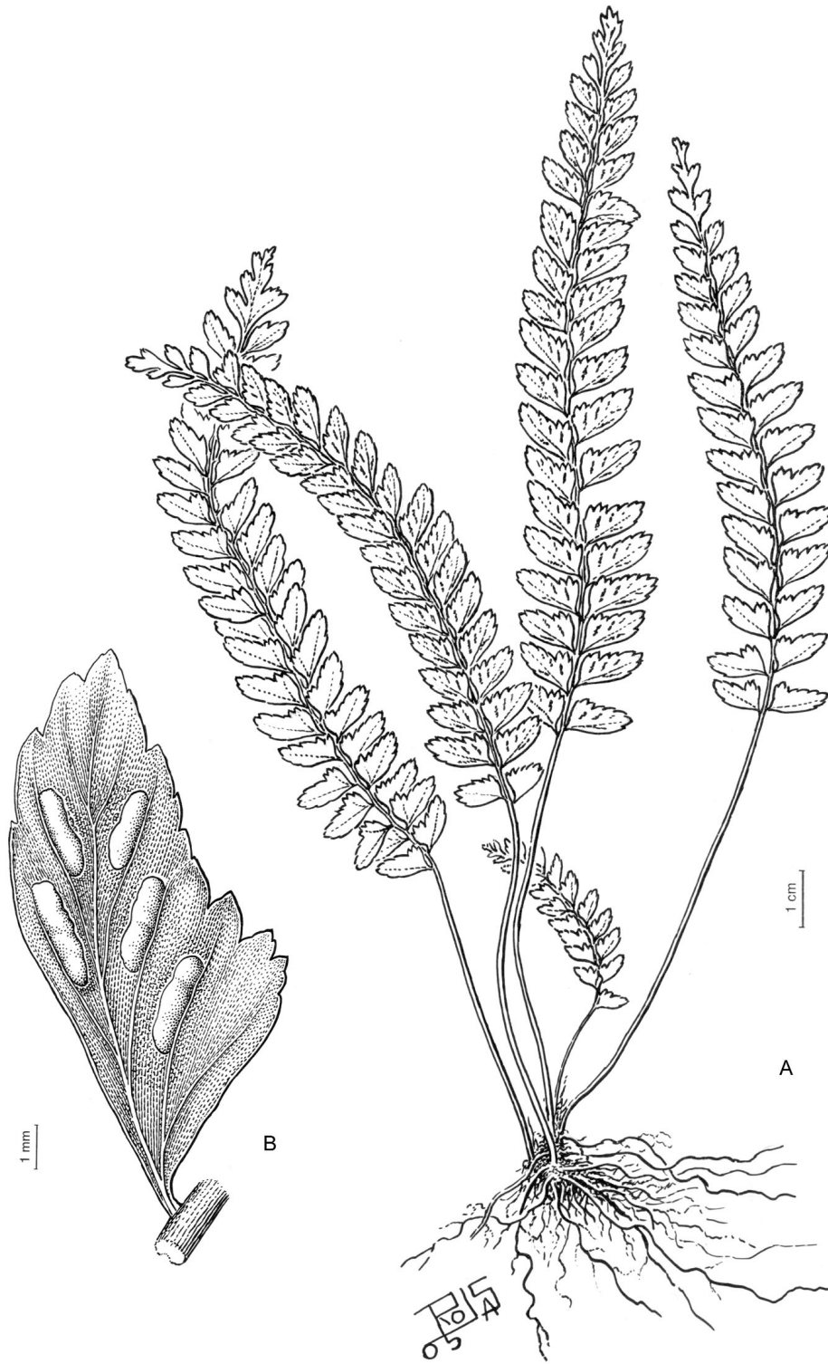
Fig. 2. Asplenium pulchellum . A , aspecto general, B , pinna fértil. De Biganzoli et al. 1293, (SI).