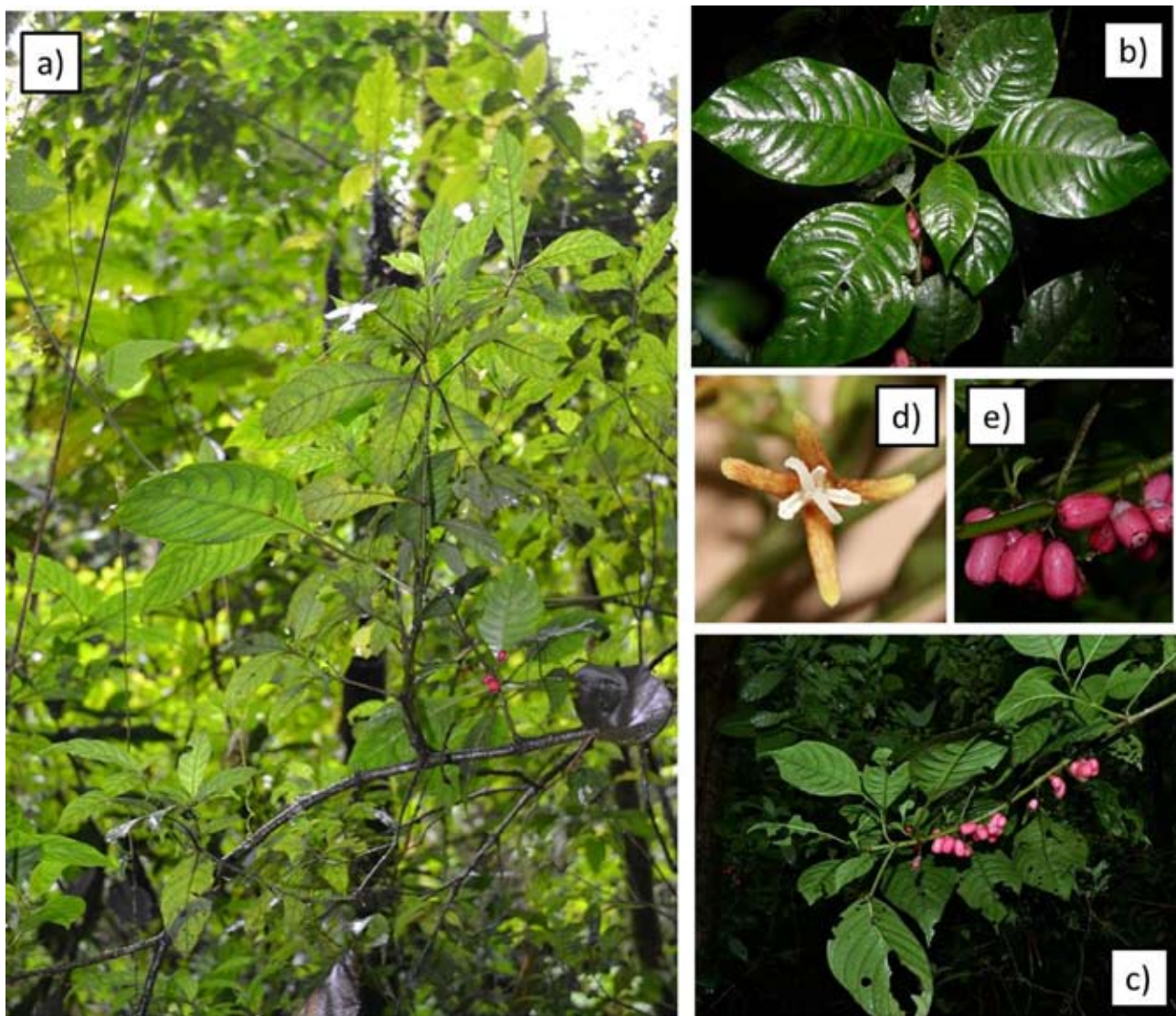
Figura 2. Fotografías que muestran diferentes estructuras de Hoffmannia arqueonervosa Cast.-Campos. a, rama; b, haz de las hojas mostrando las nervaduras; c, envés de las hojas mostrando la nervadura y el arreglo de los frutos en la rama; d, flor; e, frutos.

mm de longitud, de 0.1 mm de grueso; estigma bifurcado, de 3-4 mm de longitud, de 2.1 mm de ancho, lóbulos, de 2.0-2.5 mm de longitud, generalmente retrorsos cuando están bien desarrollados; ovario 4-acostillado, de 2.4-3.8 mm de longitud, glabro. Fruto cilíndrico, ocasionalmente globoso, rojo o rosa, glabro, lustroso, de 0.9-1.7 cm de longitud, de 0.6-1.1 cm de ancho; semillas numerosas, de forma irregular, pardas, reticuladas, de 0.4-0.6 mm de longitud, de 0.3-0.4 mm de ancho. Todas las medidas de las estructuras morfológicas de este taxa se realizaron con material fresco.