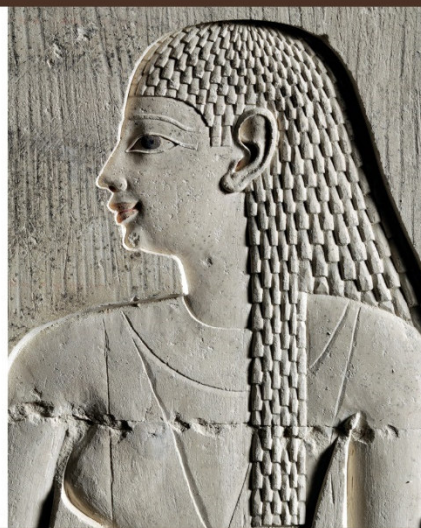
Žena z Abúsíru

Výstavní síň U kostela, vernisaž v sobotu 25. 6. 2022 v 16.00 hod.