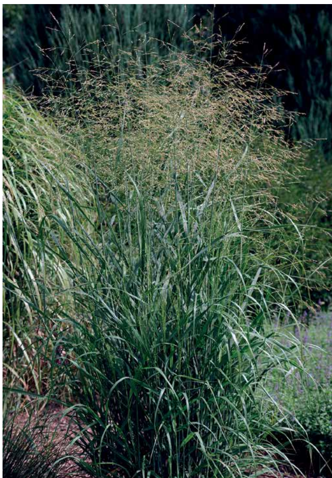
PANICUM virgatum 'Emerald Chief'