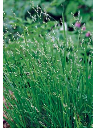
MELICA uniflora f. albida