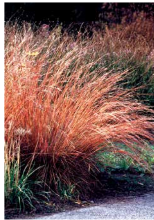
ANDROPOGON scoparius (in fall)