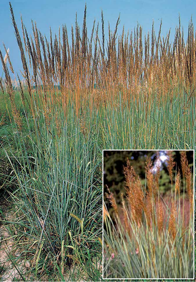
SORGHASTRUM nutans 'Indian Steel'