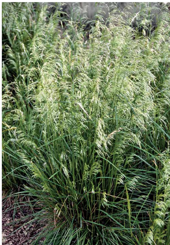
DESCHAMPSIA cespitosa 'Pixie Fountain'