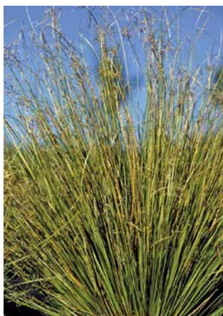
CAREX buchananii f. viridis 'Green Twist'