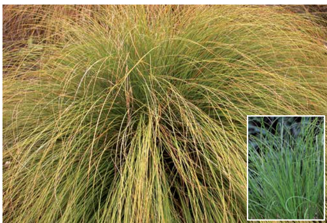
CAREX flagellifera 'Kiwi'