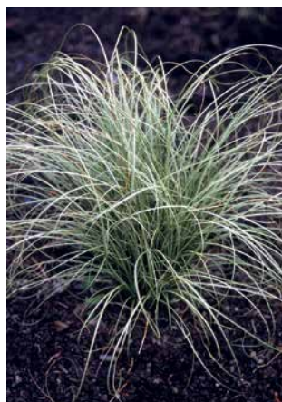
CAREX albula 'Frosted Curls'