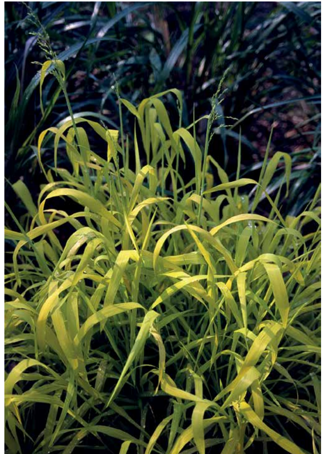
MILIUM effusum 'Aureum'