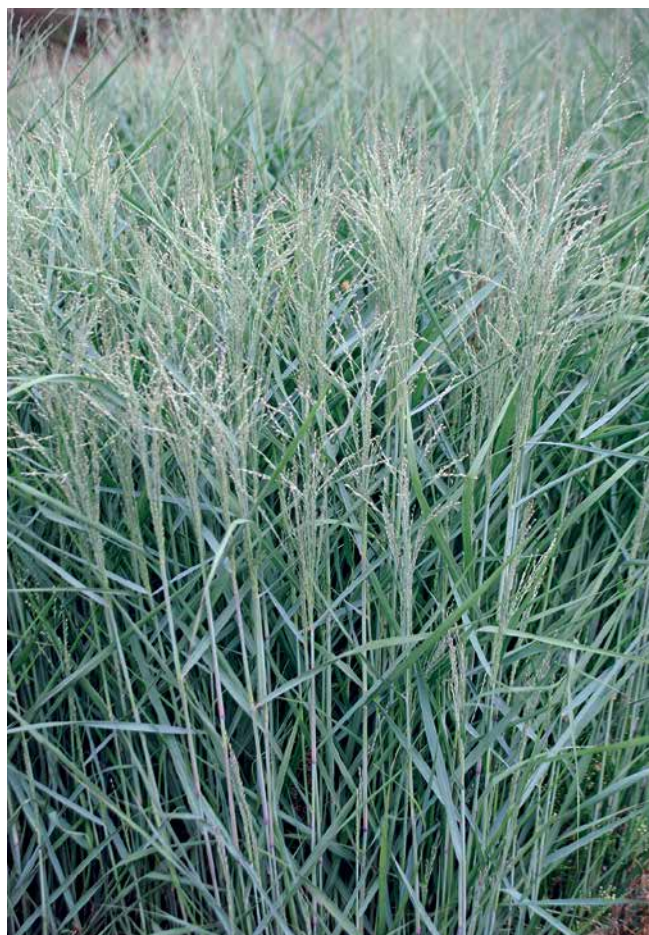
PANICUM virgatum 'Blue Giants'