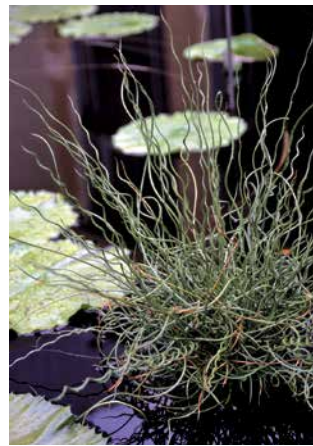
JUNCUS effusus 'Spiralis'