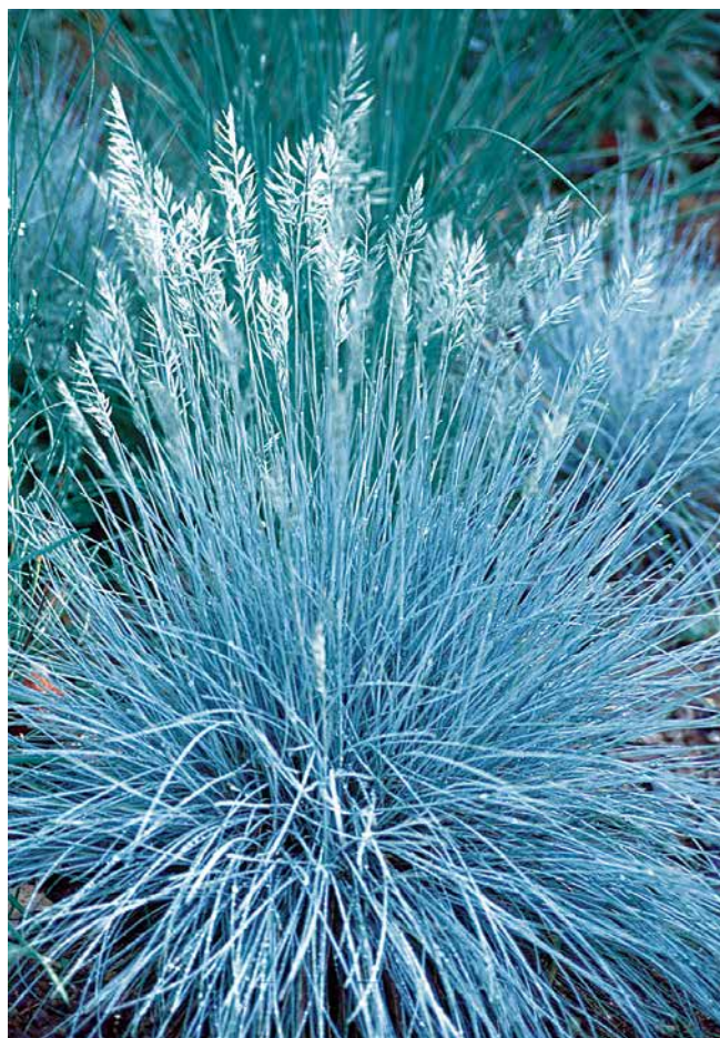
FESTUCA glauca 'Blue Select'