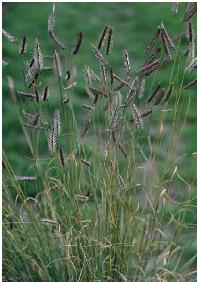
BOUTELOUA gracilis 'Bad River'