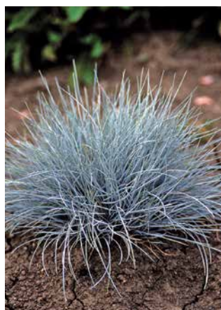
FESTUCA valesiaca var. glaucantha