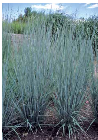
ANDROPOGON scoparius 'Prairie Blues'