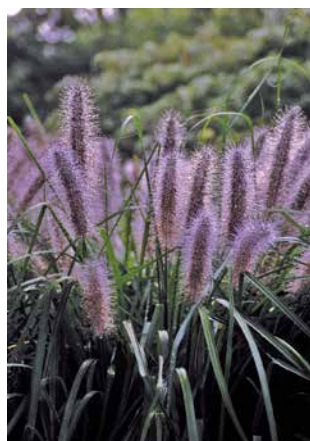
PENNISETUM alopec. var. viridescens