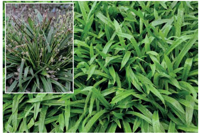
CAREX plantaginea 'Blue Ridge'