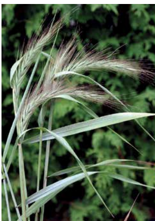
ELYMUS canadensis 'Icy Blue'