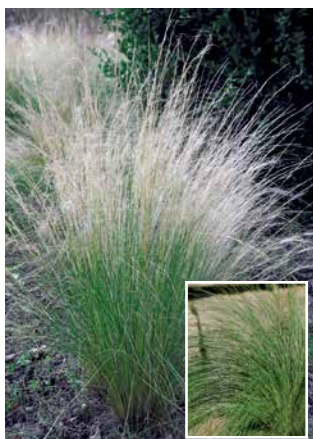
STIPA trichotoma 'Palomino'