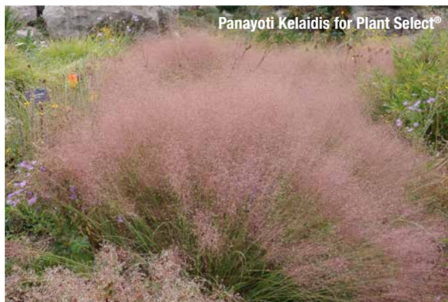
Panayoti Kelaidis for Plant Select®