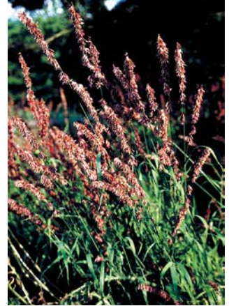
MELICA altissima var. atropurpurea