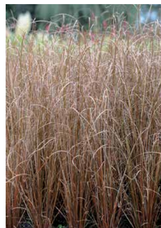
CAREX buchananii 'Firefox'