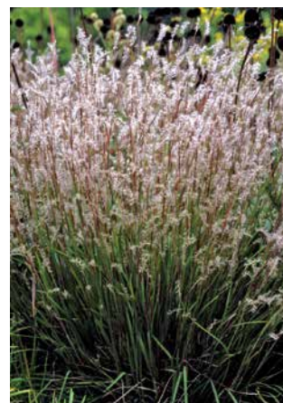
ANDROPOGON scoparius 'Blaze'