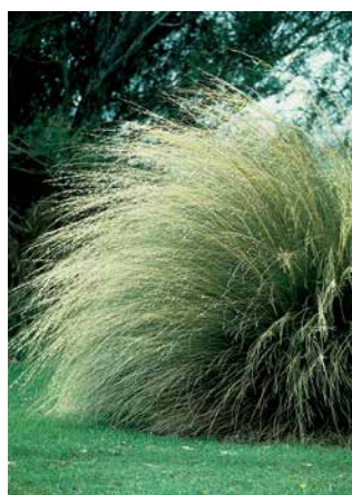
CHIONOCHLOA rubra ssp. cuprea