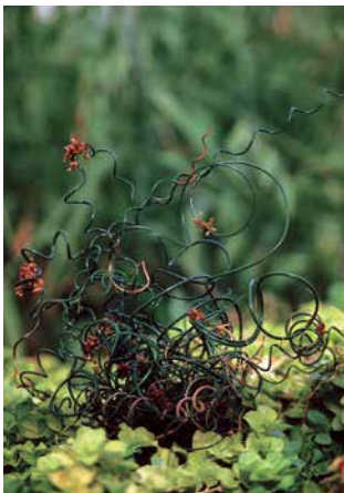
JUNCUS filiformis 'Spiralis'