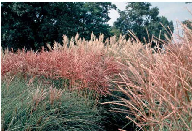
MISCANTHUS sinensis 'New Hybrids'