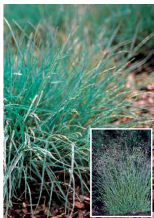
POA glauca 'Blue Hills'