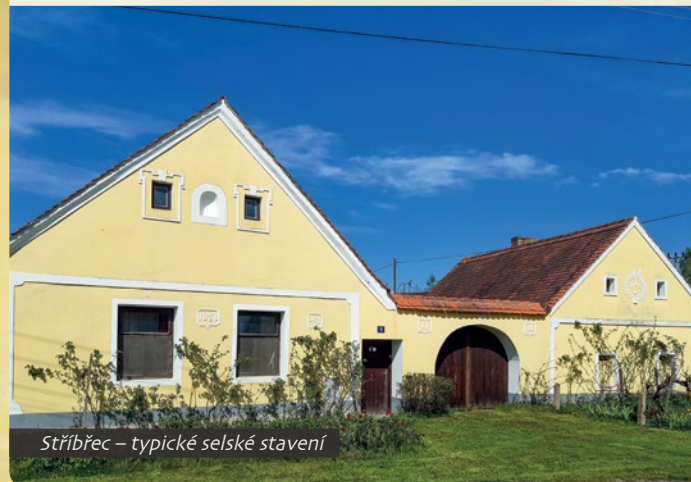
Stříbřec – typické selské stavení

Od zámku Stráž nad Nežárkou pokračují všechny tři trasy společně až do cíle. Pokračujete po cyklostezce Nežárka, u jezu Šimanov se přidá červená turistická značka až k zámku Jemčina (zprvu polní cesta se mění na asfaltovou). Od zámku Jemčina sledujete stále modrou turistickou značku až do cíle. Cyklotrasy se mění: ve Stradince odbočíte z trasy Nežárka na cyklostezku do Novosedel , z návsi pokračuje cyklostezka a cyklotrasa Green Ways Rožmberského dědicství, u Hodějovického rybníka se cyklotrasa mění na č. 1035 do Staré Hlíny k silnici E 34. Odsud je značena cyklotrasa Okolo Třeboně. Po 300 metrech odbočíte z cyklostezky podél silnice vpravo na modrou turistickou značku a po koruně hráze objedete rybník Vítek do Nové Hlíny. Pokračujete po modré značce lesem ke kapličce sv. Víta u rybníka Zadní Kouty (lesní cesty), kde je cíl u restaurace Pergola.