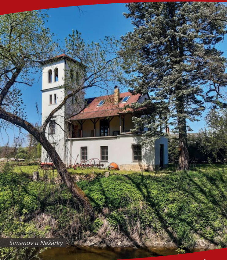
Šimanov u Nežárky

hospůdkou a rybníkem se trasy B a C u křížku oddělují.