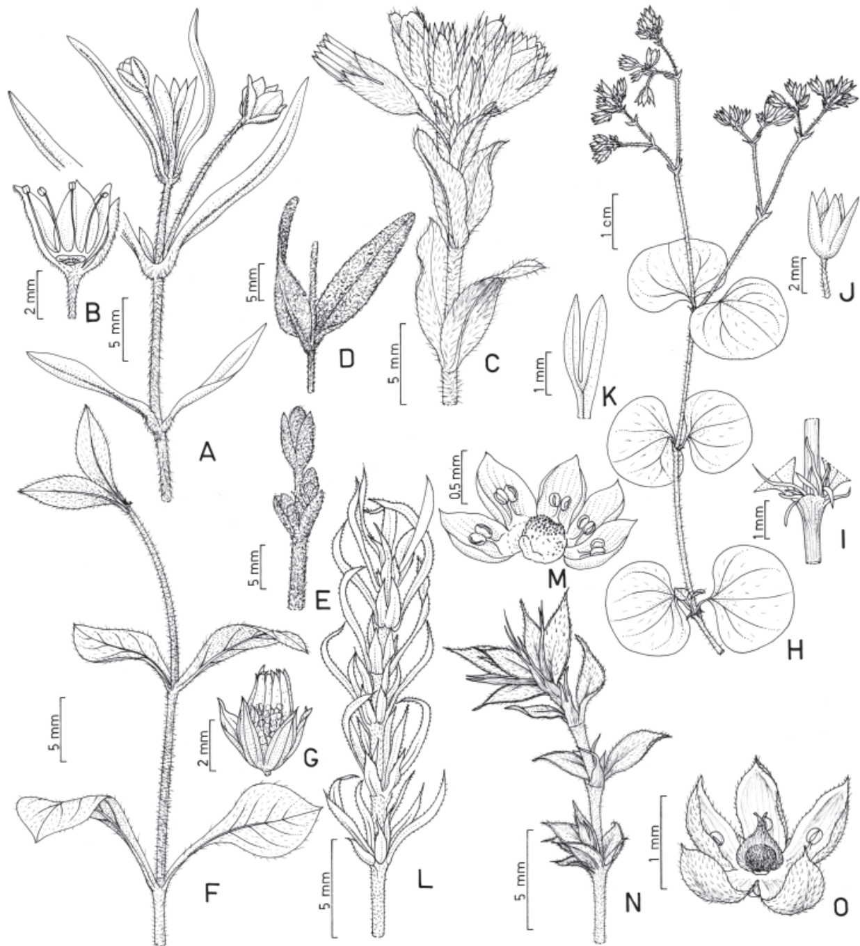
Prancha 1. A-B. Arenaria lanuginosa , A. ramo com flores; B. flor aberta com sépalos, pétalas e estames. C. Cerastium glomeratum , ramo com inflorescência. D-E. Cerastium mollissimum , D. nó com as folhas; E. parte da inflorescência. F-G. Cerastium rivulare , F. ramo com folhas; G. fruto. H-K. Drymaria cordata , H. ramo com folhas e inflorescência; I. detalhe do nó com as estípulas; J. flor; K. pétala. L-M. Paronychia camphorosmoides , L. ramo com folhas; M. flor aberta com sépalos, pétalas, estames e ovário. N-O. Paronychia communis , N. ramo com folhas; O. flor aberta com sépalos, estames e ovário. (A-B, Loefgren CGG 3549; C, Souza 997; D-E, Kuhlmann HRCB 29116; F-G, Loefgren CGG 236; H-K, Bernacci 404; L-M, Freitas 816; N-O, Freitas 822).