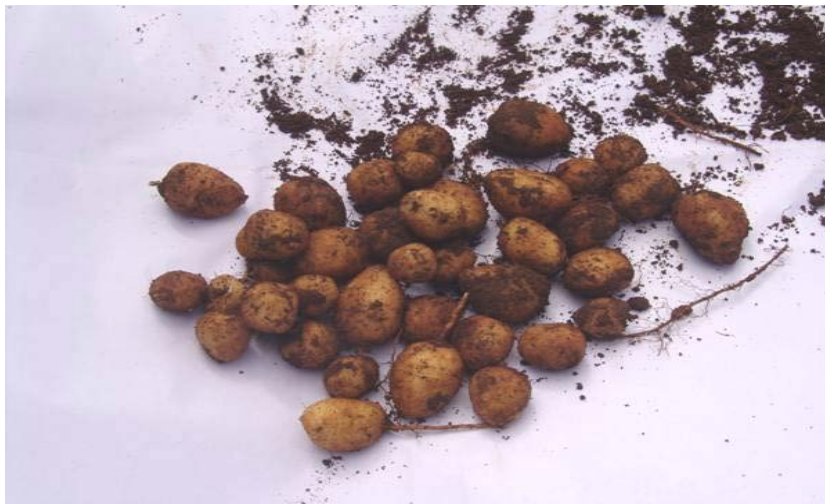
Figura 2. Tubérculos de llerén, cultivo infrautilizado, presente en el Parque Nacional “Alejandro de Humboldt” (Foto. G. Begué-Quiala, 2014).

De modo general en las fincas muestreadas el 73,3 % de los taxones poseen un estado poblacional crítico con poblaciones con menos del 40 % y por debajo de este valor en lo relacionado a su presencia y aparición.