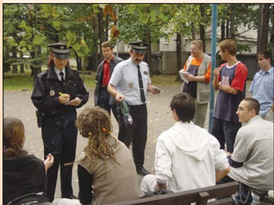
V TERÉNU: Zástupci radnice a městské policie monitorují chování mládeže.

O zapojení statutárního města Frýdek-Místek do Městského programu prevence kriminality rozhodlo Zastupitelstvo města Frýdku-Místku v loňském roce.