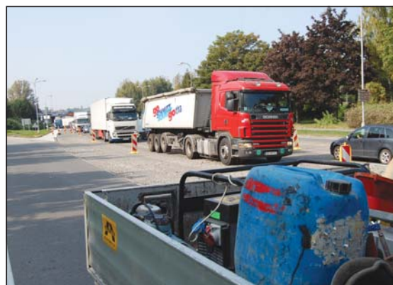
OPRAVA PRŮTAHU: Řidiči musí počítat s kolonami.

vidíme na cyklostezkách nebo i na chodnicích, samozřejmě za předpokladu, že divokou jízdu neohrožují chodce,“ vysvětlila Lenka Biolková. Dětem byla zdůrazněna pravidla bezpečné jízdy a především povinnost nosit na kole na hlavách přilbu. Po dopoledni s městskou policií už by měly vědět, jak se chovat v dopravním provozu. Také už vědí, co by nemělo chybět na kolech, která mají doma. (pp)