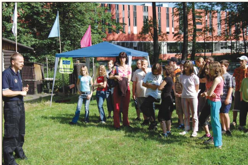
PRÁCE S MLÁDEŽÍ: Prevenci kriminality se věnuje i městská policie.

Vláda schválila v roce 2007 Strategii prevence kriminality