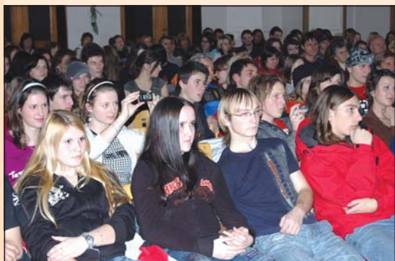
DNEŠNÍ MLÁDEŽ: Z akce „Přelet nad nízkoprah“ v Národním domě. Frýdek-Místek patří v oblasti nízkoprahových klubů k nejagilnějším městům v republice co do jejich počtu i zkušeností s těmito zařízeními.