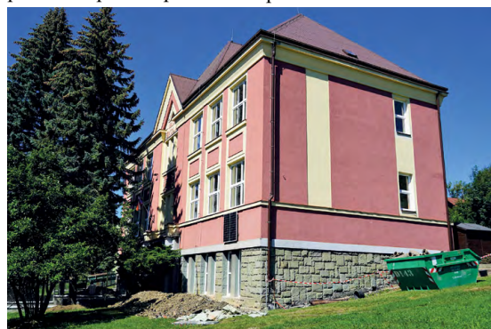
OPRAVY ŠKOLNÍ BUDOVY: Ve Skalici půjdou děti do školy až 7. září.

„Jedná se o pilotní projekt, který budeme sledovat a vyhodnocovat. Je také možné, že v jeho průběhu budeme na základě získaných poznatků a v případě potřeby upravovat dobu zakazu parkování dodávek na tomto sídlišti. Naším záměrem je nasbírat co nejvíce zkušeností a informací spojených s tímto pilotním projektem a v budoucnu zóny se zákazem stání vozidel, jejichž okamžitá hmotnost přesahuje 2,5 tuny, rozšířit i do dalších lokalit ve městě,“ doplnil náměstek Deutscher.