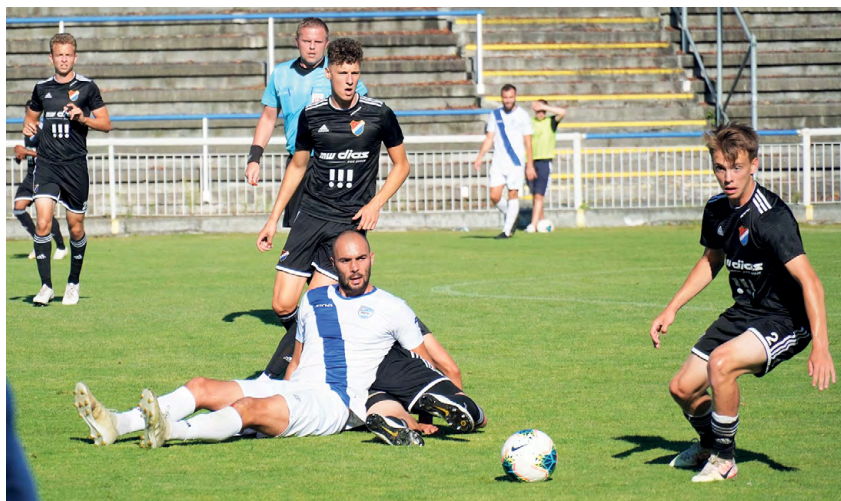
S BĚČKEM BANÍKU: Domácí premiéra nevyšla.

Druhá půle začala asi nejhůře, jak vůbec mohla. Uběhla sotva minuta hry, kdy Mooc našel před naší brankou Lokšu, který s pomocí tyče obrátil průběh zápasu na stranu hostů – 1:2. A v 60. minutě bylo ještě hůř. Zatímco v domácích