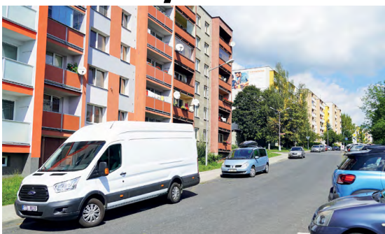
ZABÍRAJÍ ZA DVA: Lidé nevidí rádi, když jim parkovací místa ubírají velké vozy určené k podnikání.

„Dohodli jsme se, že regulaci parkování dodávek na sídlištích otestujeme na frýdeckém Růžovém pahorku. Jednak je to sídliště, kde dodávky parkují více než na jiných místech