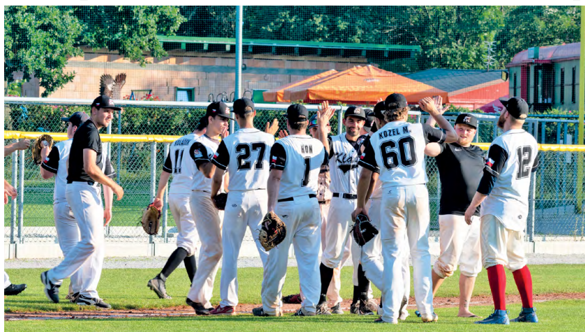
BÁJEČNÝ OBRAT: Radost po výhře.

Frýdek-Místek se tak po dvou výhrách dostal na první místo barážové tabulky a je blízko tomu, aby si vybojoval mistenku v české baseballové Extralize. Dále ale čekal dvojzápas na hřišti Techniky Brno – trojnásobných mistrů republiky. (str. 6)