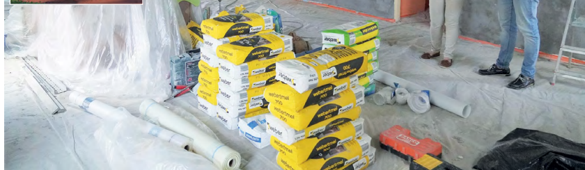
JESLE: Vše pro spokojenost a bezpečí těch nejmenších.