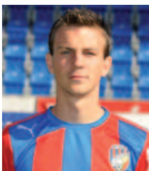
Vladimír Darida 8. 8. 1990 Post záložník Prvoligové starty 54 Prvoligové branky 8