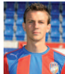
Vladimír Darida 16 8. 8. 1990 Post záložník Prvoligové starty 46 Prvoligové branky 6