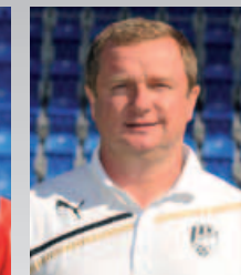
Pavel Vrba 6. 12. 1963 hlavní trenér