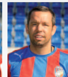
Pavel Horváth 10 22. 4. 1975 Post záložník Prvoligové starty 383 Prvoligové branky 77