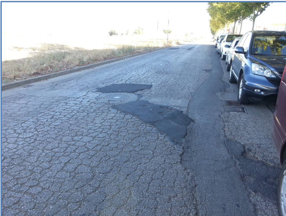
Estado actual del vial