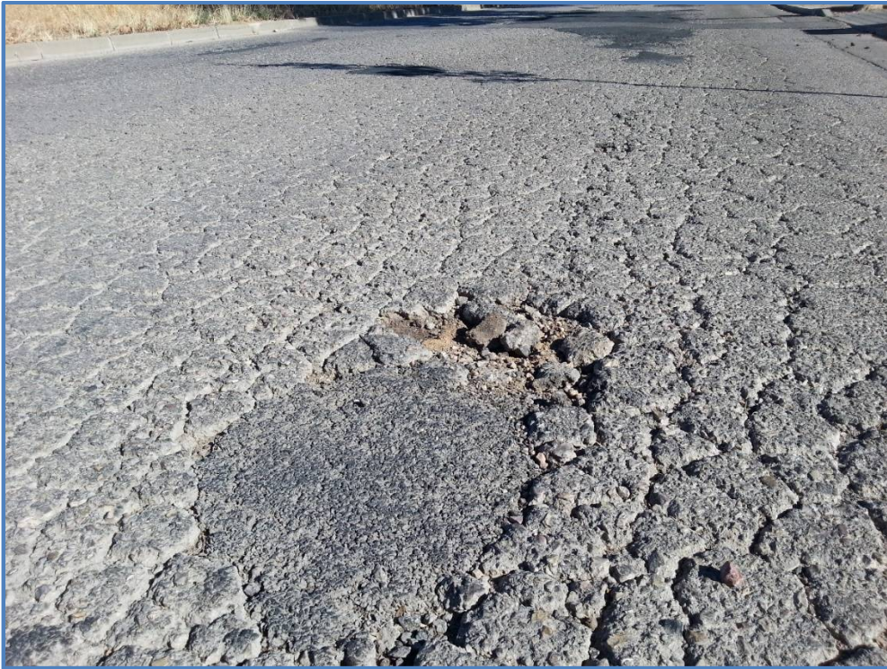
Estado actual de pavimento de la calzada (detalle)