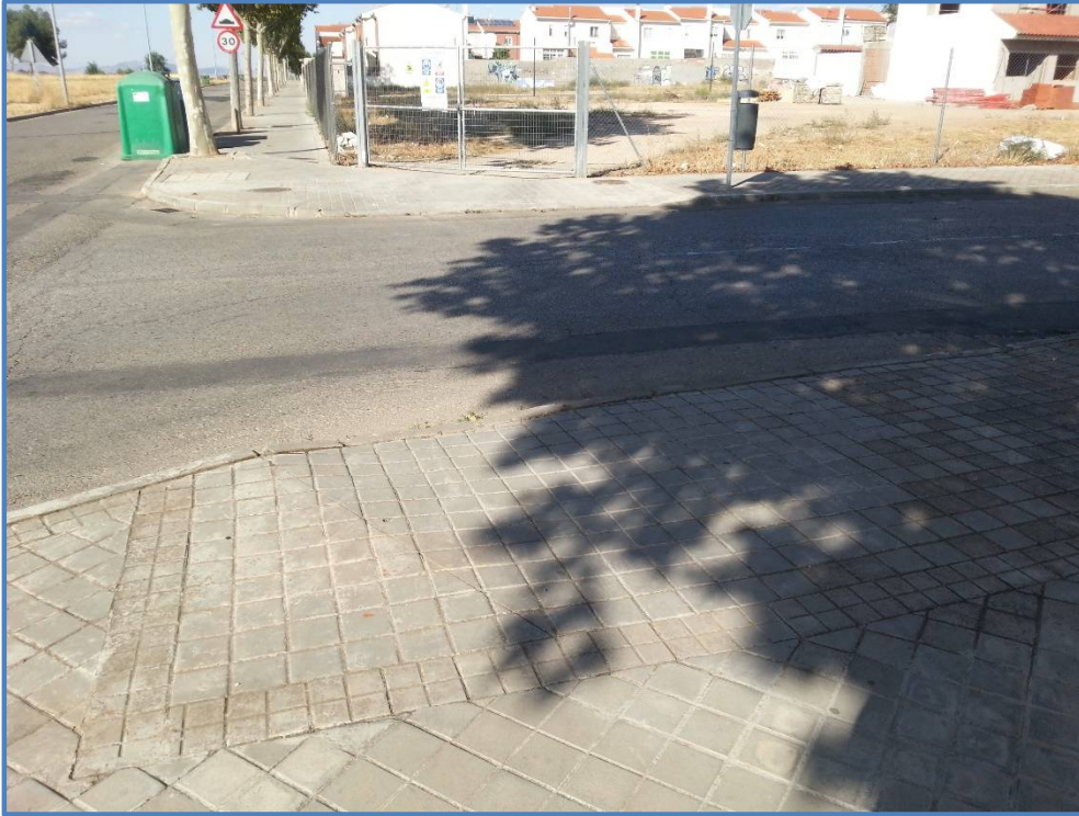
Ubicación de paso de peatones en calle Gregorio Marañón