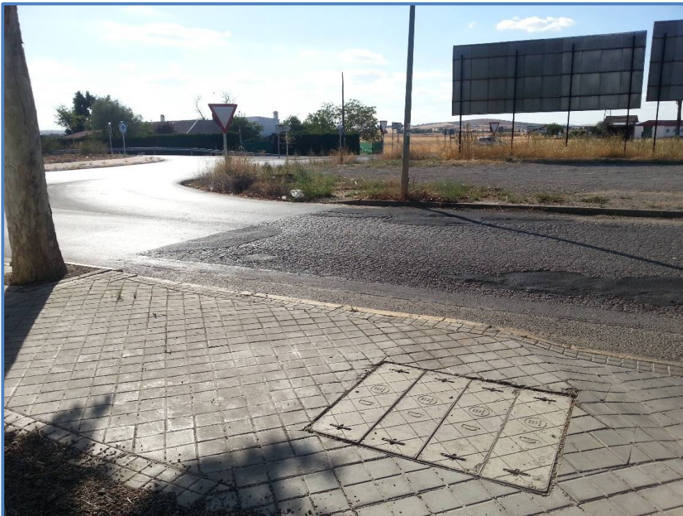
Ubicación paso de peatones