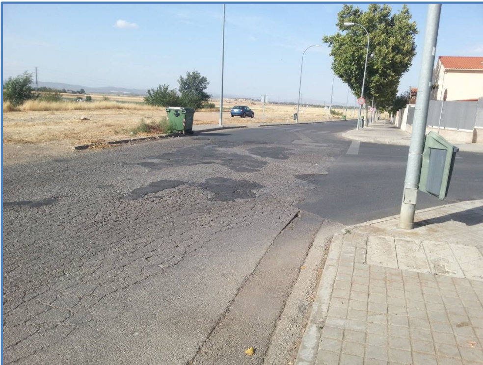
Final de tramo de proyecto