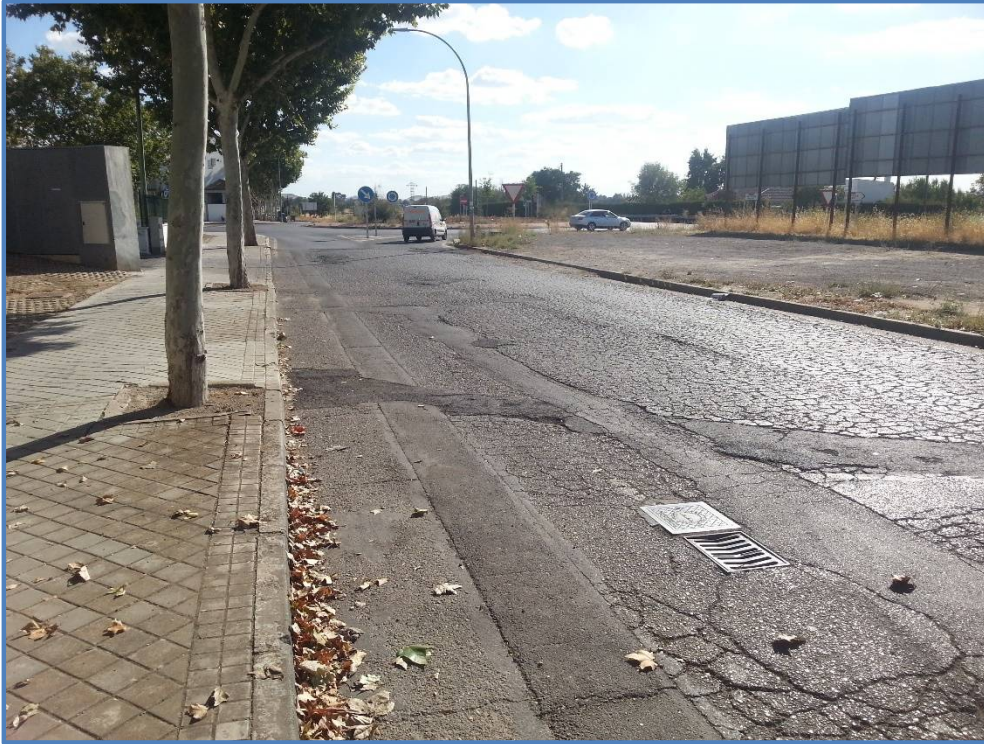
Rotonda de carretera de Porzuna (al fondo). Inicio de tramo de proyecto