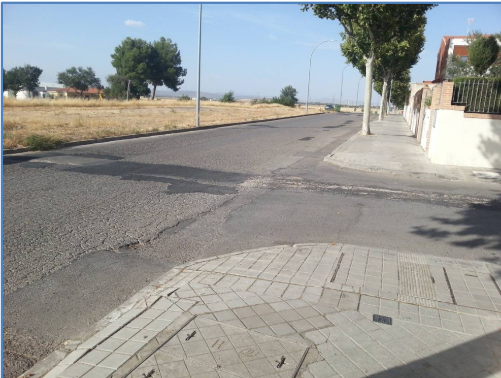
Calle transversal privada