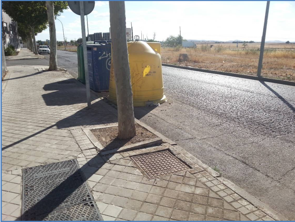
Contenedores a retirar