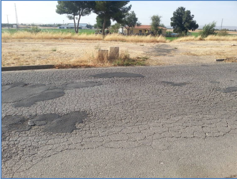
Tramo de bordillo que falta en parte exterior de la calle