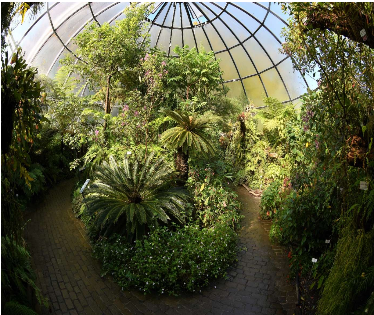
Blick ins Bergregenwald-Schauhaus des Botanischen Gartens der Universität Zürich. View of the mountain rainforest glass house of the Botanical Garden of the University of Zurich.

The Botanical Garden of the University of Zurich is part of the Department of Systematic and Evolutionary Botany and supports research, teaching, public education and recreation. Around 7,500 plant species are grown here. The goal is to show a good, scientifically supervised representation of the global plant world. The new Botanical Garden was built in 1976, and the old Botanical Garden, founded 1837, is still maintained as a public park.