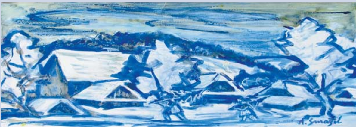
■ Vianočná poézia, 2002, akvarel, 28 x 51