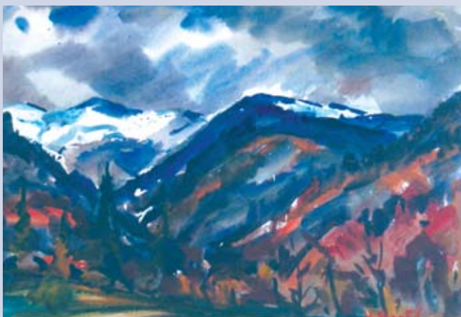
■ Pod Chopkom, 1984, akvarel, 41 x 61