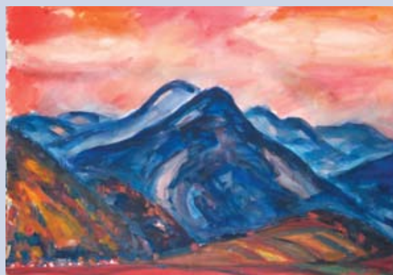
■ Fatranská panoráma II., 1997, akvarel, 73 x 102