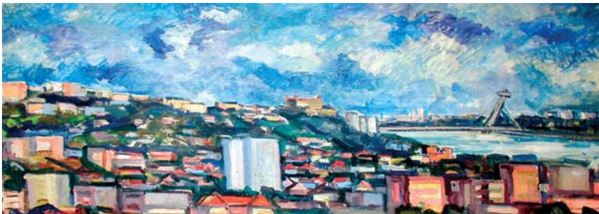
■ Nová Bratislava II, 1977, olej, 60 x 140