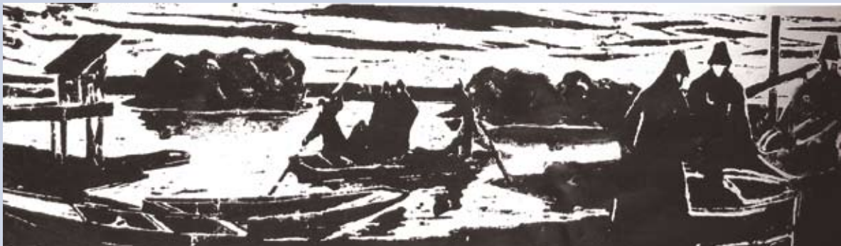
■ Rybářská jeseň, 1973, grafika, 16 x 65