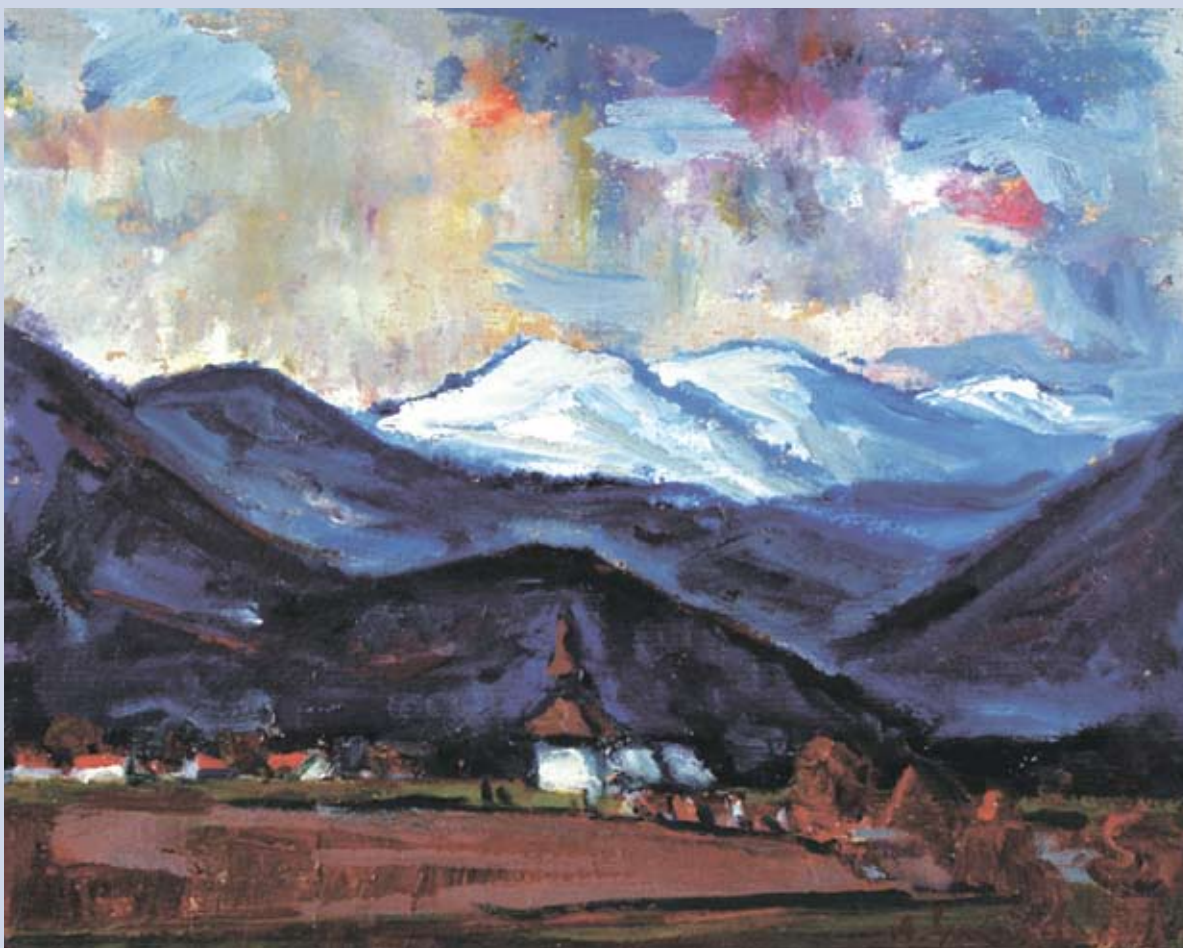
■ Partizánska pevnosť Prašivá, 1984, olej, 46 x 55