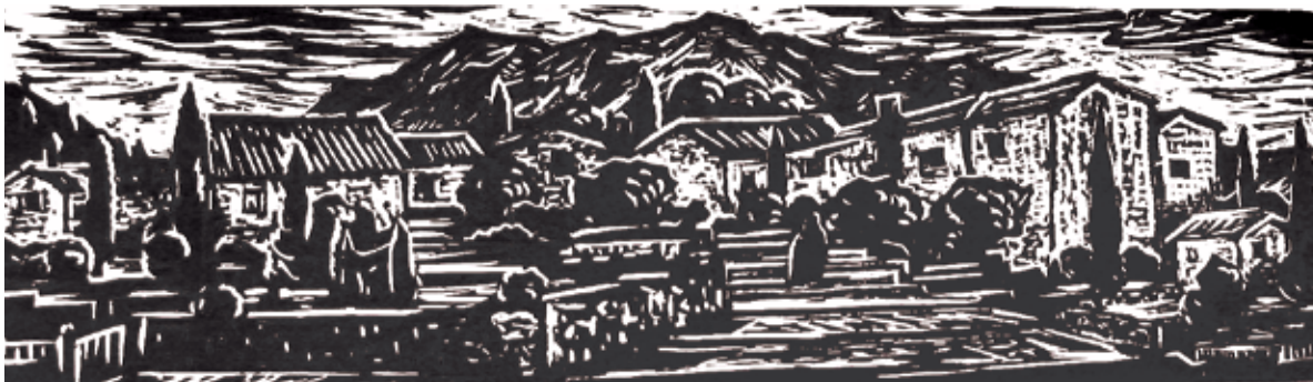
■ Jadranská panoráma (Trsteno), 1965, grafika, 20 x 65