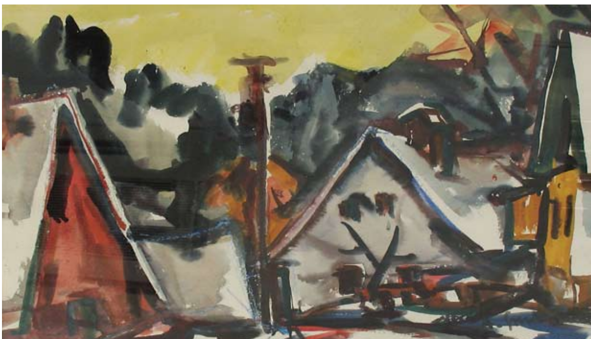
■ Zima na Balinách, 1978, akvarel, 42 x 62