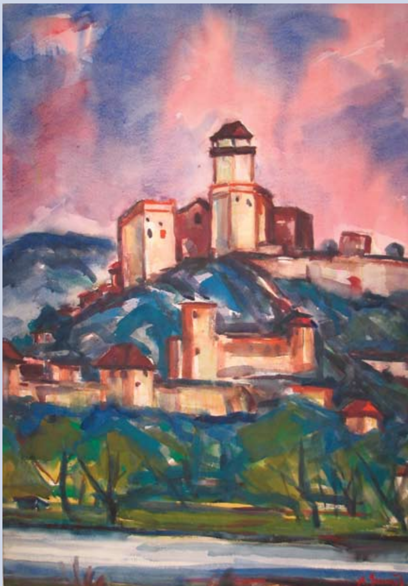
■ Trenčiansky hrad, 1976, akvarel, 100 x 70