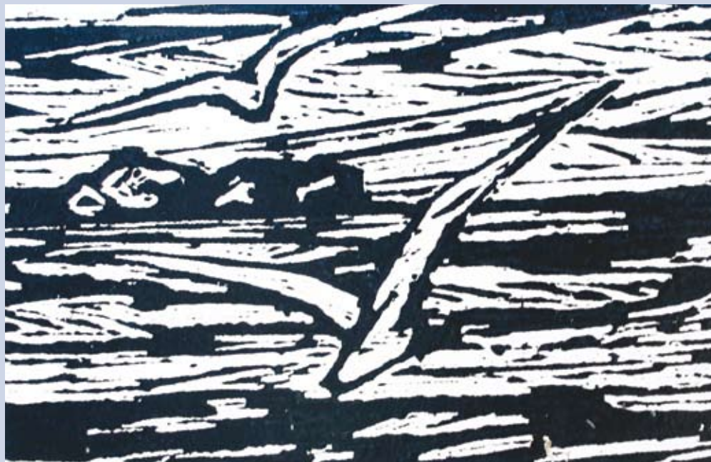
■ Čajky nad vodou, 1972, grafika, 32 x 42