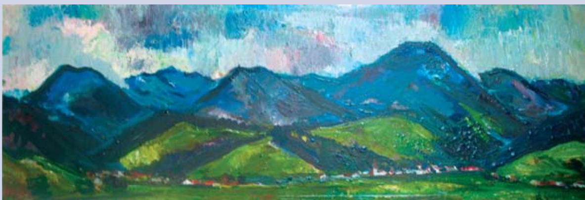
■ Turčianska panoráma, Gaderská a Blatnická kotlina, 1998, olej, 42 x 124