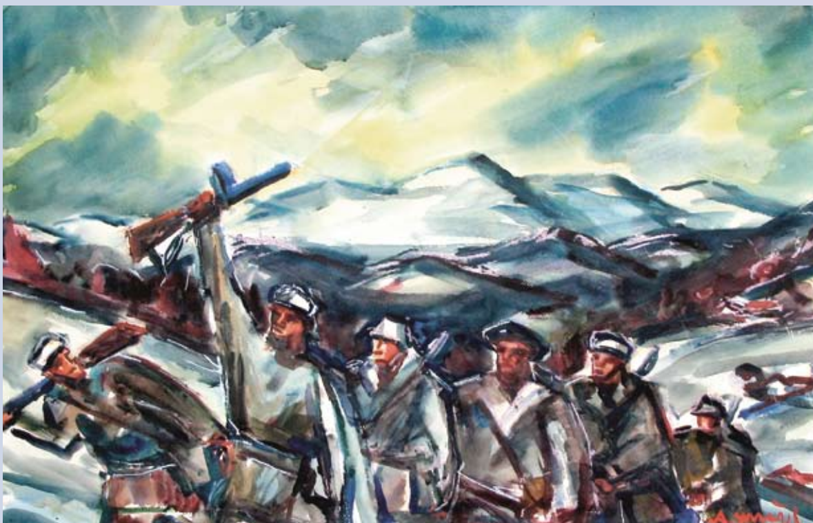
■ Vítazstvo bude naše, 1985, akvarel, 72 x 102