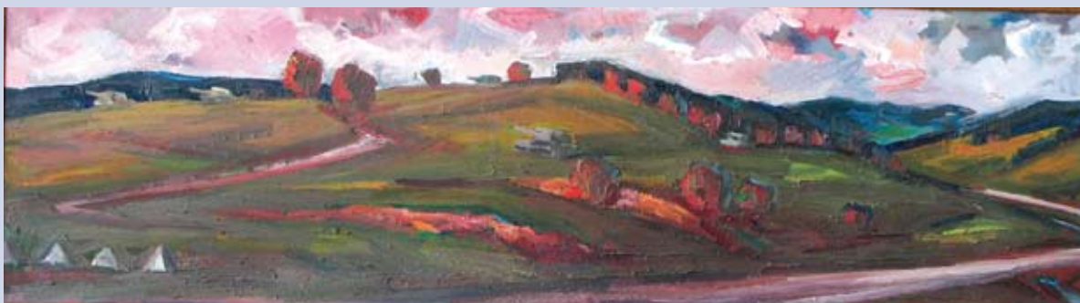
■ Údolie smrti, 1974, olej, 52 x 180