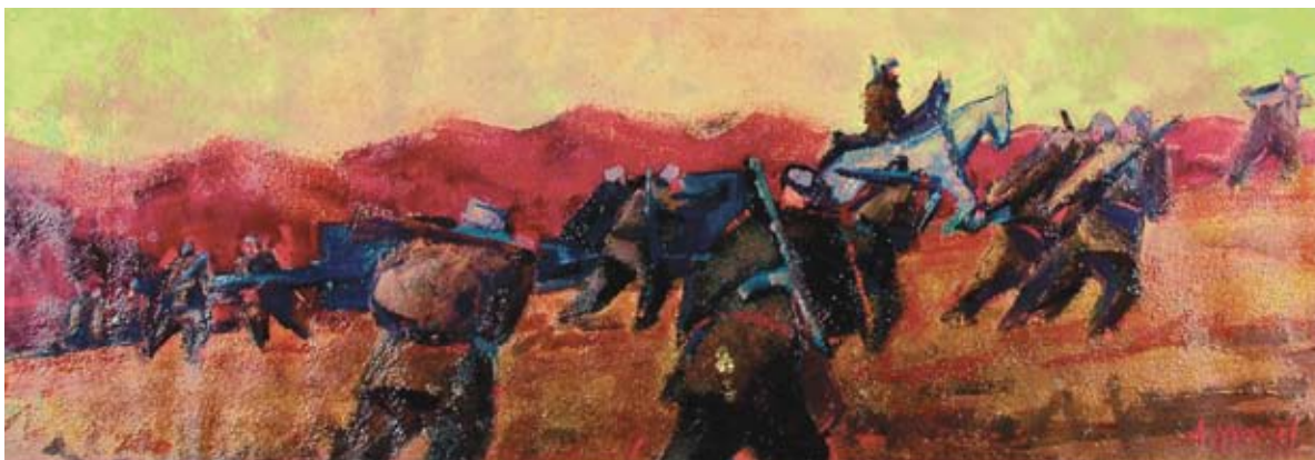
■ Vpred za slobodu I., prechod Malou Fatrou, 1974, olej, 35 x 100