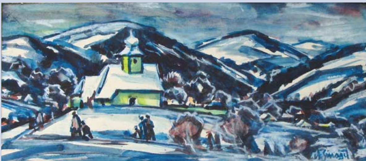
■ Vianočná poézia, 2001, akvarel, 25 x 57