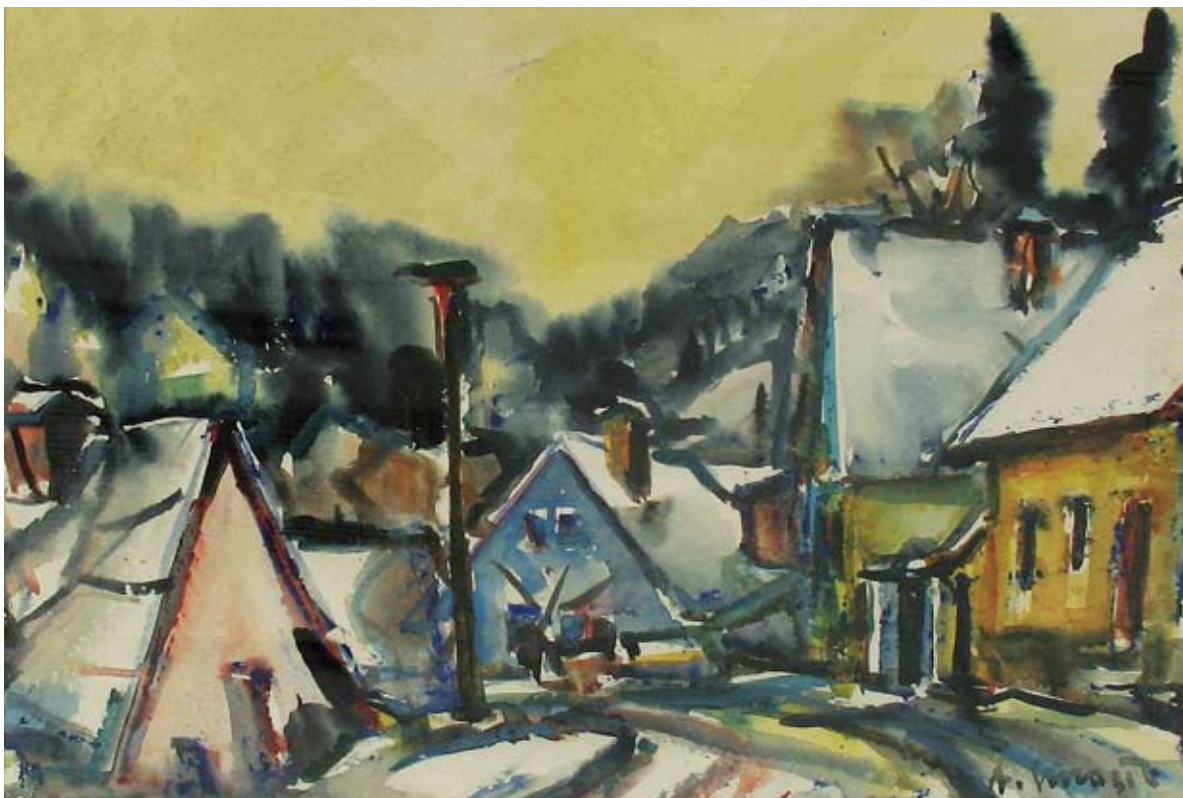
■ Zima na Balinách I., 1997, akvarel, 73 x 102