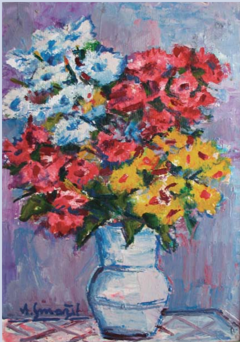
■ Kytica jesene, 2002, olej, 51 x 35