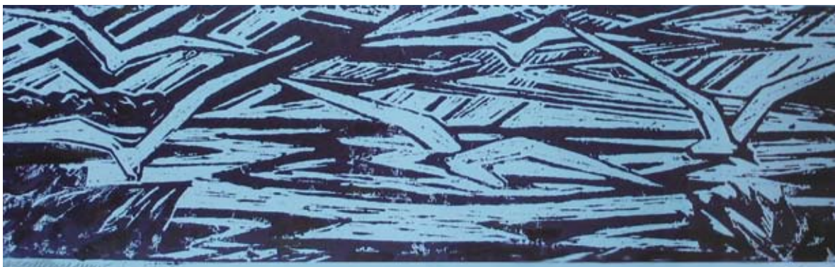
■ Zrkadlenie jesene, 1974, grafika, 20 x 64