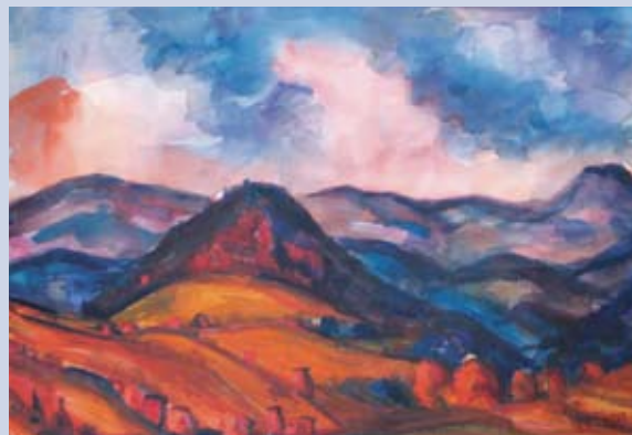
■ Fatranská panoráma I., 1997, akvarel, 72 x 100