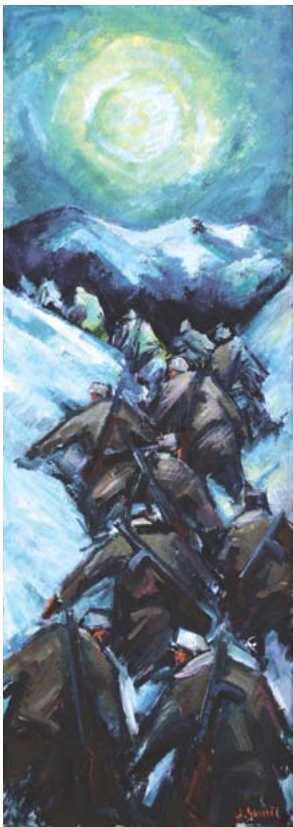
■ Partizánska poéma, prechod Chabencom, 1975, olej, 120 x 45