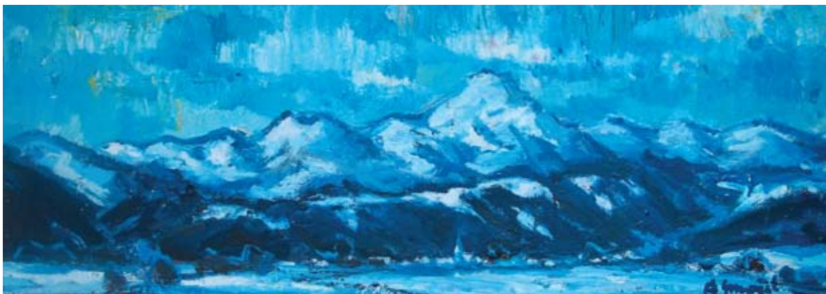
■ Fatranská zimná panoráma (Blatnica), 1992, olej, 30 x 81