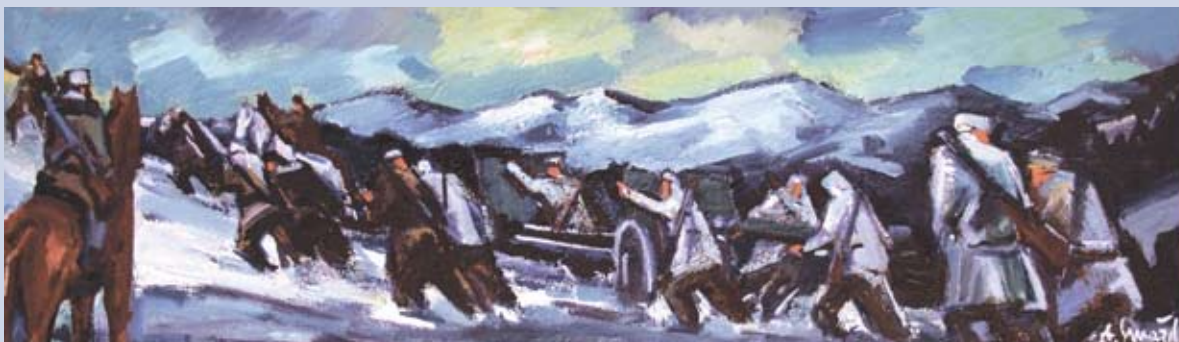
■ Vpred za slobodu II., prehod Malou Fatrou, 1974, olej, 35 x 100