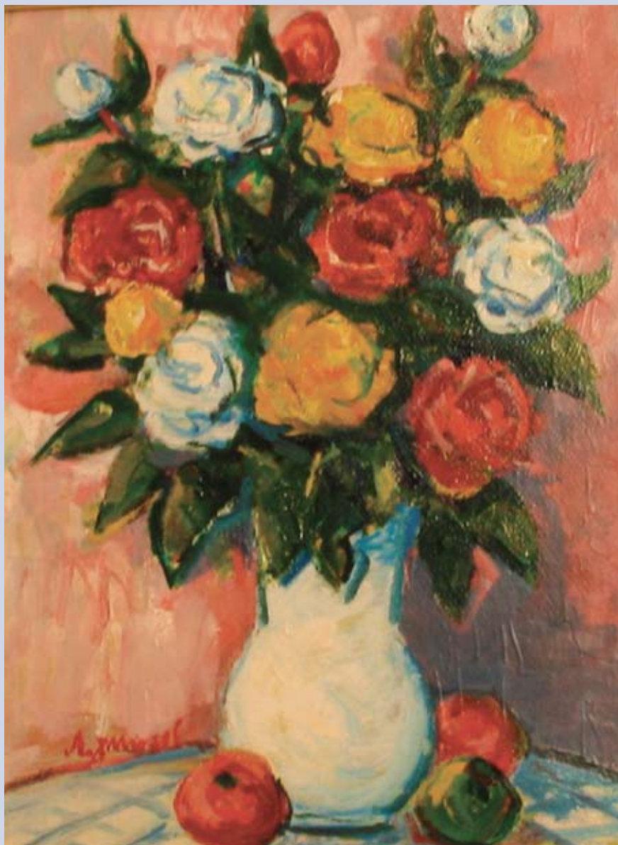
■ Kytica pivoniek, 1998, olej, 56 x 42