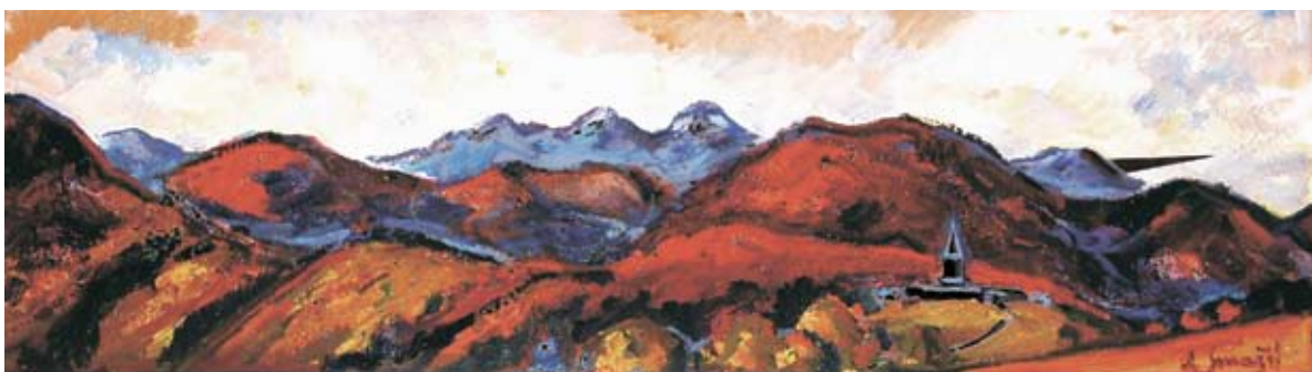
■ Pomník francúzskych partizánov pri Strečne, 1987, olej, 35 x 124