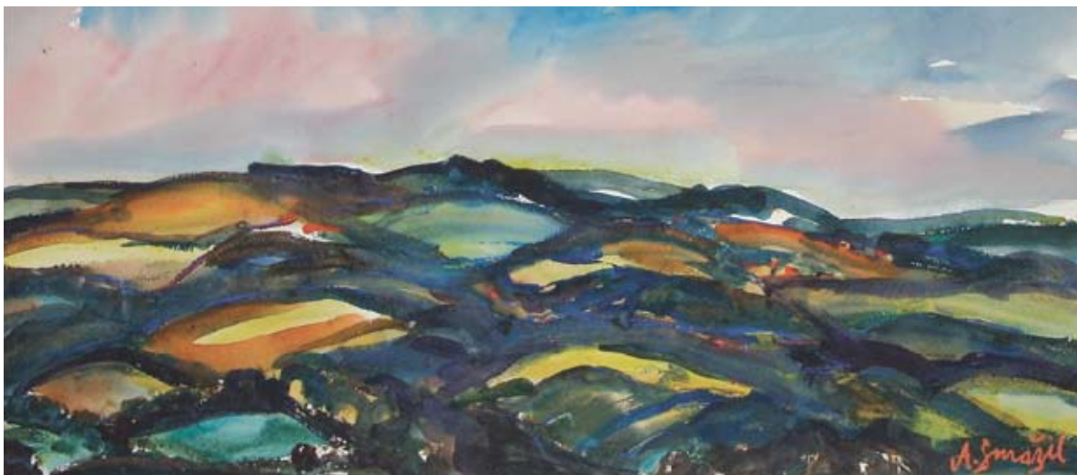
■ Letná panoráma na Javorci, 1985, akvarel, 30 x 70