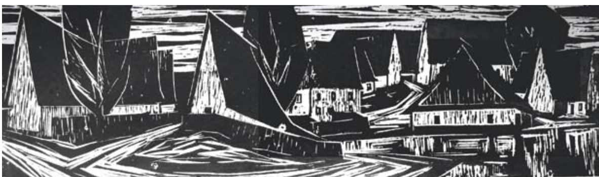
■ Podvečer II., (Z cyklu Návsi), 1967, grafika, 26 x 79