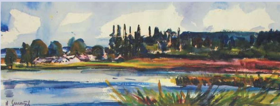
■ Leto na Vysočine, 1995, akvarel, 25 x 72