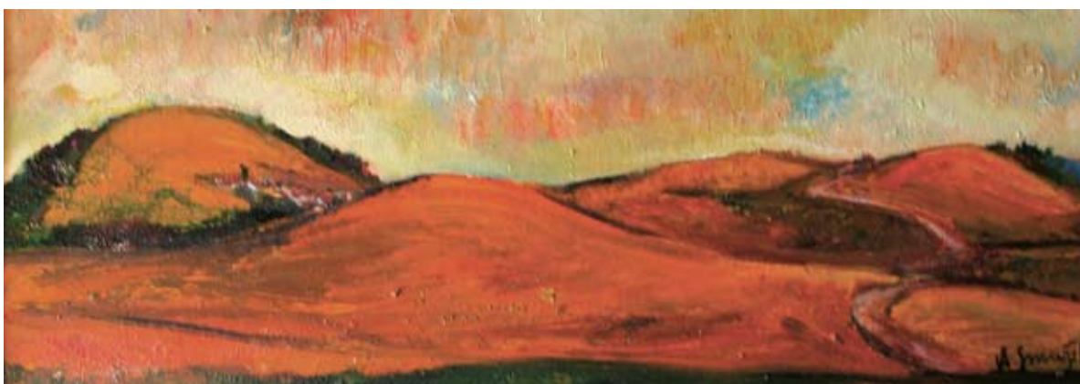
■ Jeseň za Uchánkom (Cesta do neba), 1998, olej, 34 x 91