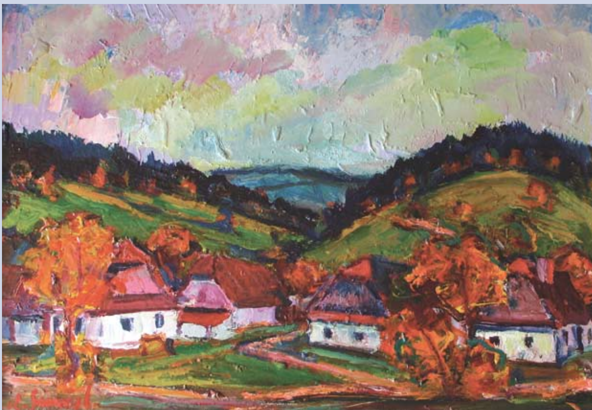
■ Oravské drevenice, 2000, olej, 42 x 60