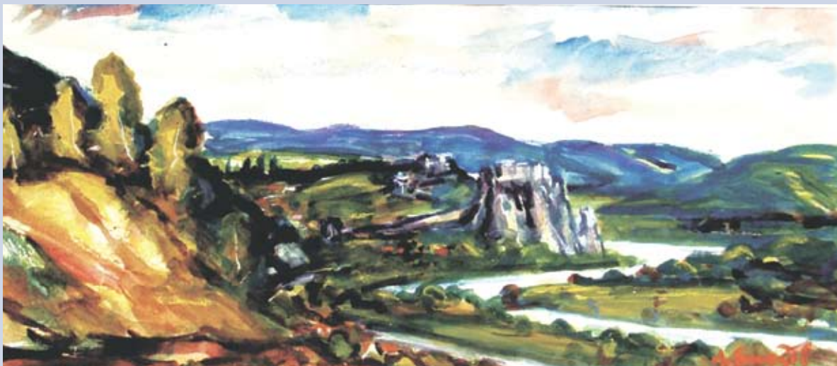
■ Devínska panoráma, 2002, akvarel, 32 x 74