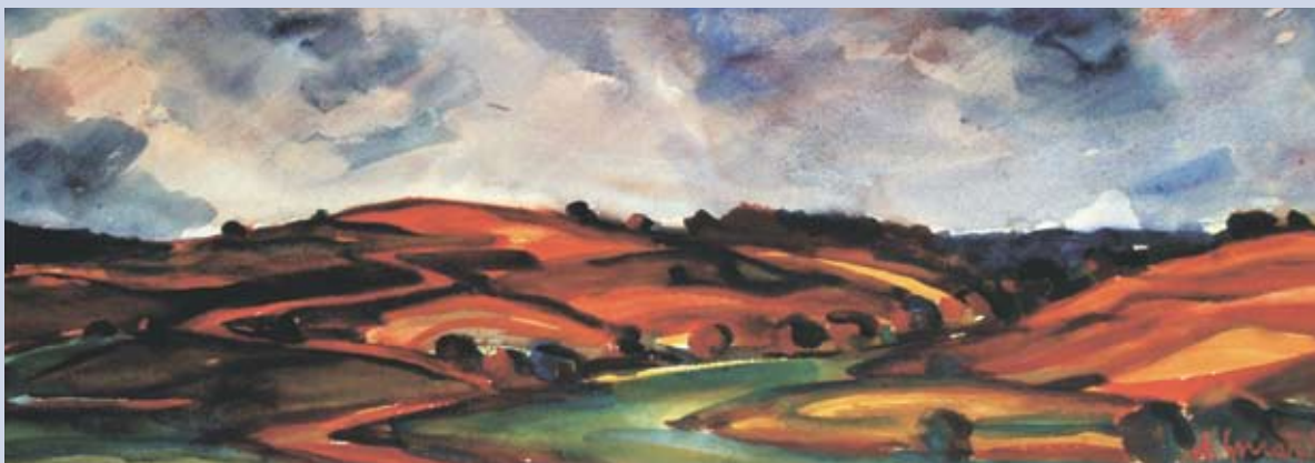
■ Krvavá kóta, Poľsko, 1984, akvarel, 35 x 85