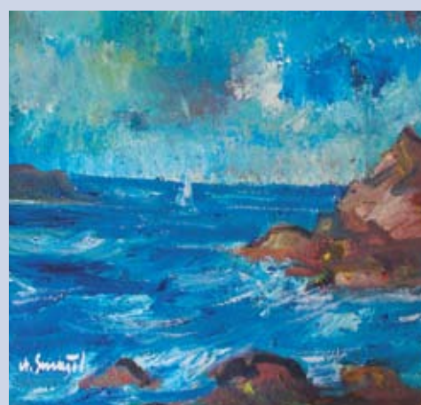
■ Morské vlny na Baltickom mori, 1976, olej, 44 x 51