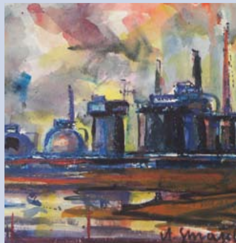
■ Vlčie hrdlo, 1986, akvarel, 28 x 30