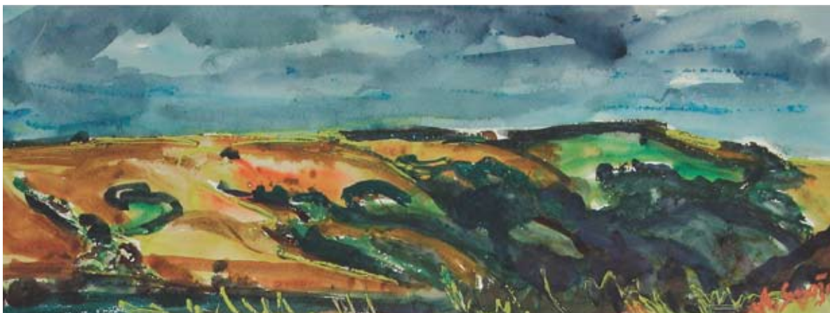
■ Leto na Javorci, 1985, akvarel, 30 x 70