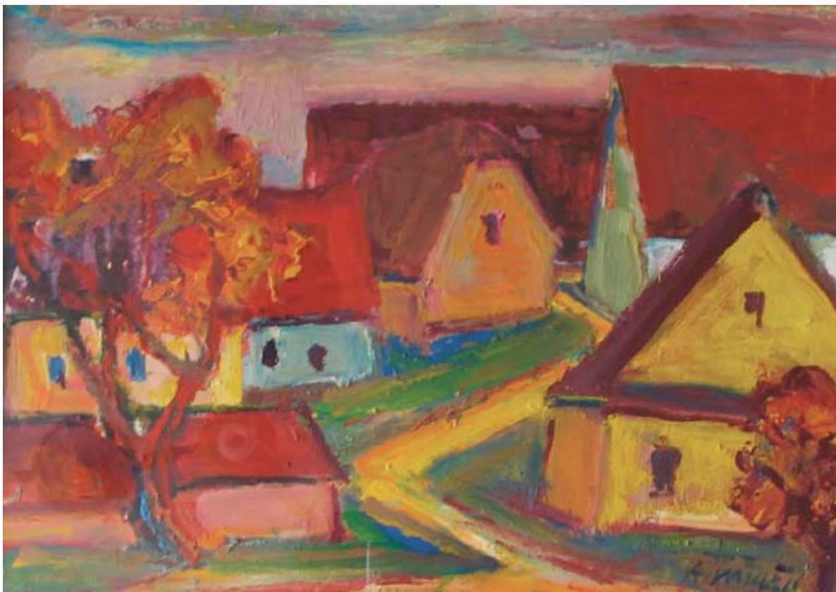
■ Teplá jeseň na Záluží, 2000, olej, 25 x 50