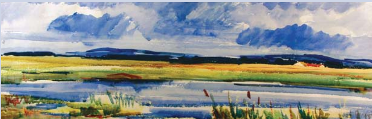
■ Juhočeský motív, 1974, akvarel, 32 x 85