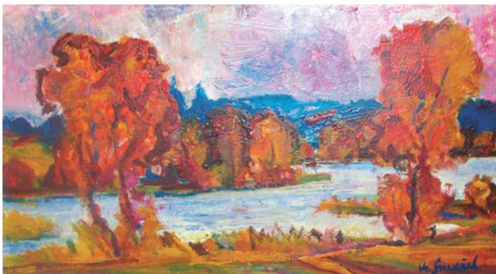
■ Zrkadlenie jesene na Novom Dařku, 2004, olej, 40 x 70