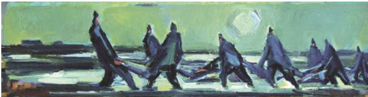
■ Rybáři so sieťou, 1973, olej, 20 x 68