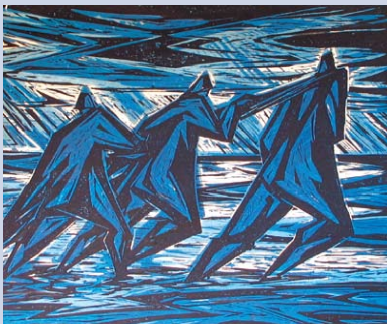
■ Rybárska rapsódia I., 1965, grafika, 23 x 39