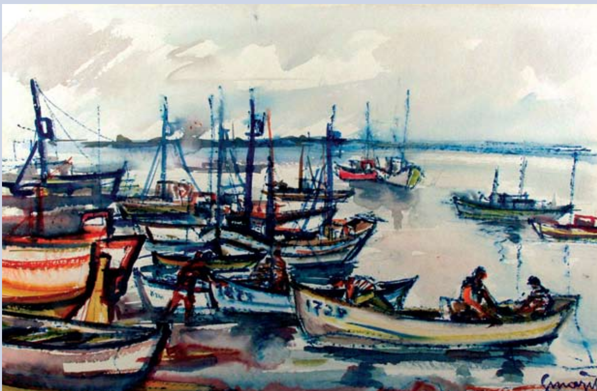
■ V rybárskom prístave, 1981, akvarel, 42 x 62