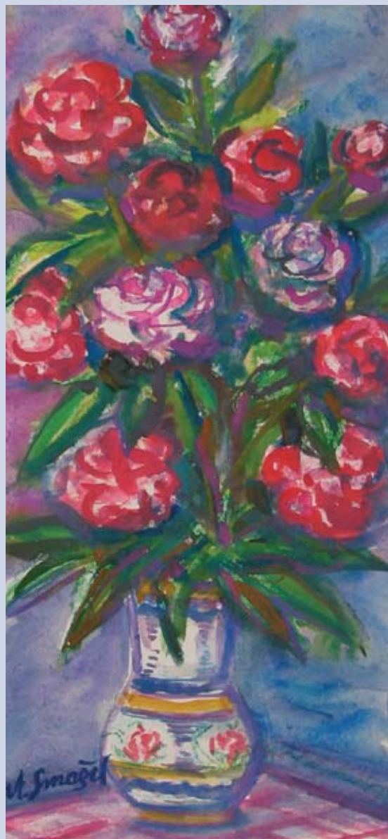
■ Kytica pivoniek, 2003, akvarel, 62 x 28