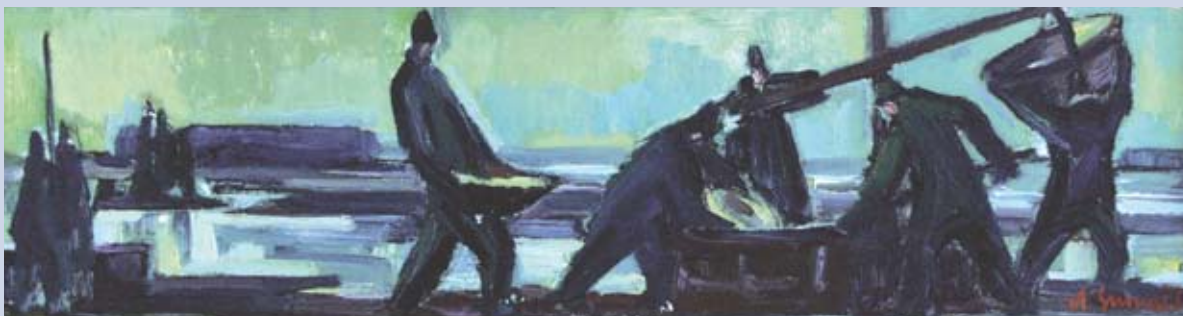
■ Rybolov, 1973, olej, 28 x 68