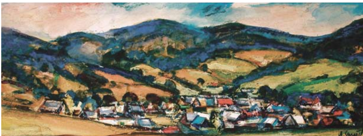
■ Nižný Komárnik, 1974, akvarel, 32 x 85