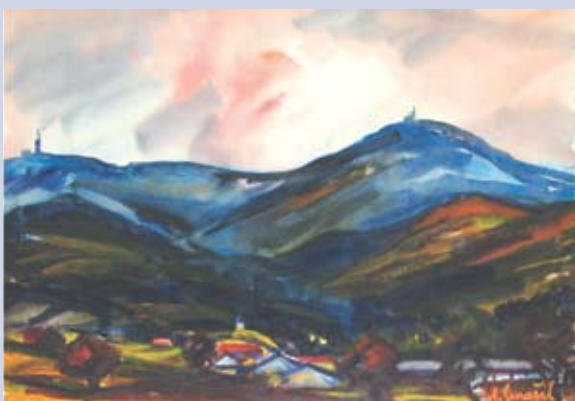
■ Liptovské etudy, 1995, akvarel, 50 x 71