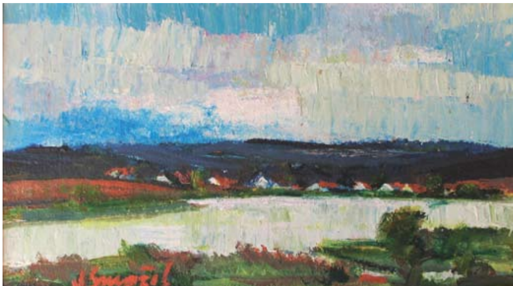
■ Poézia podvečera, 1998, olej, 28 x 48