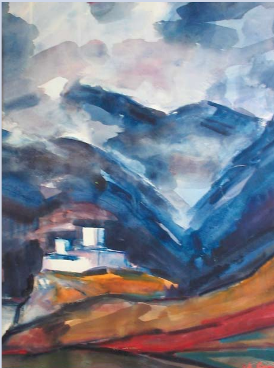
■ Strečno, 1995, akvarel, 88 x 55