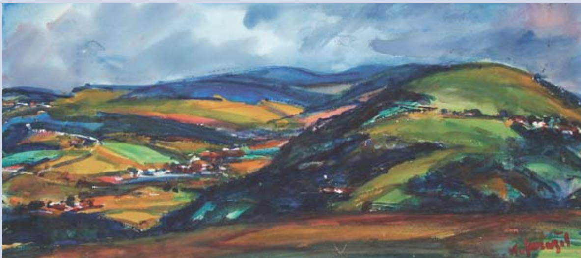
■ Letná panoráma Záhoria, 2003, akvarel, 32 x 71