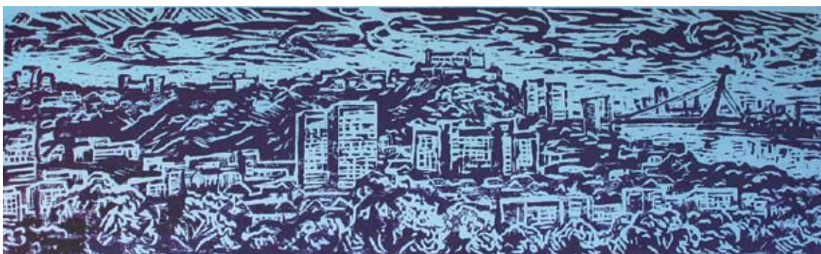
■ Bratislavská panoráma, 1976, grafika, 23 x 79