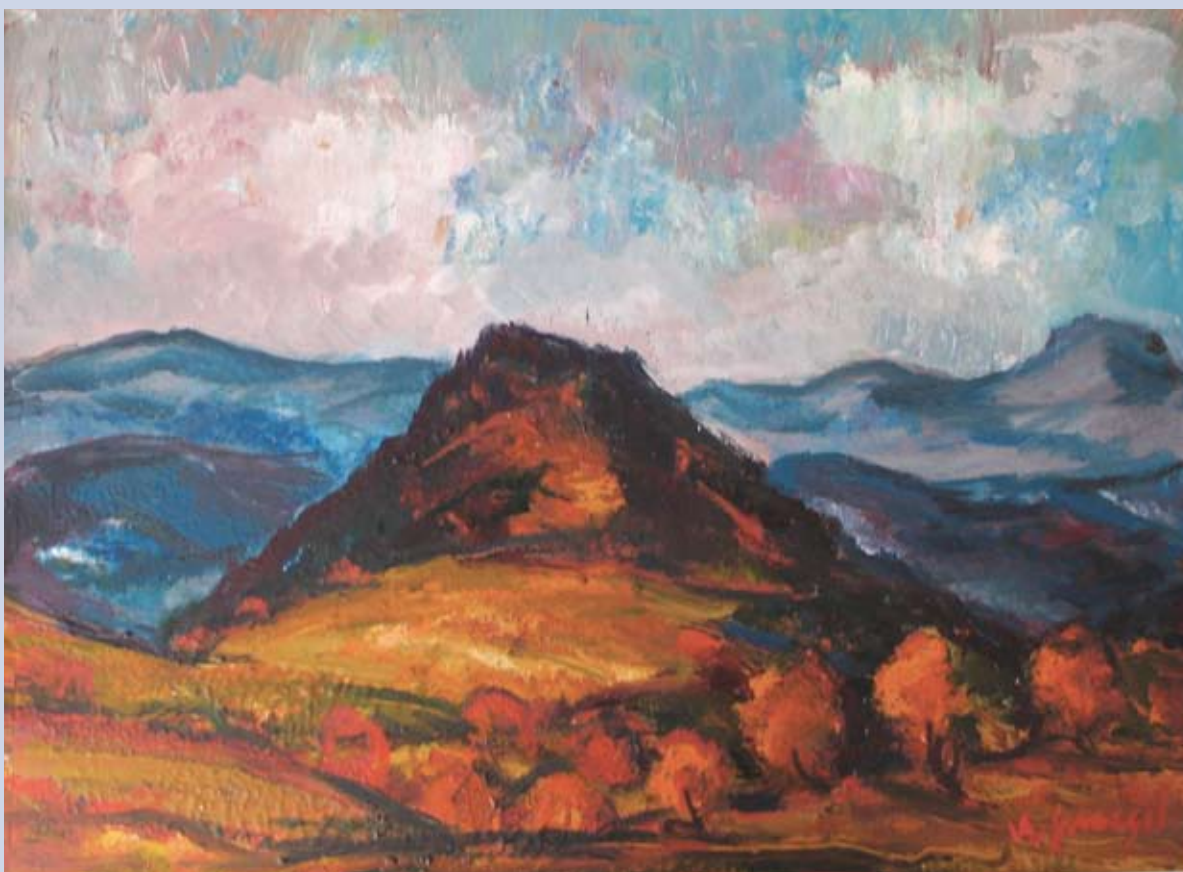
■ Jesenná liptovská panoráma, 1996, olej, 45 x 62