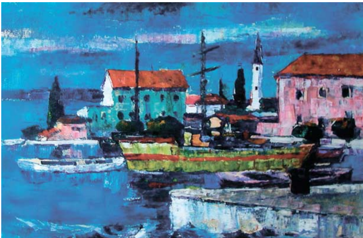
■ Sačuraj, 1977, komb.technika, 45 x 64