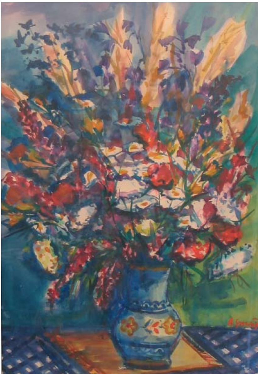
■ Kytica poľných kvetov, 1985, akvarel, 98 x 68