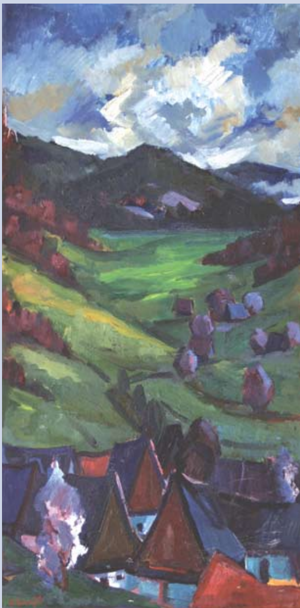
■ Nižná Boca, 1974, olej, 110 x 45