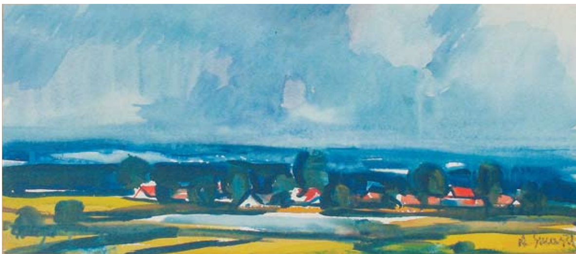
■ Záluží, 1985, akvarel, 28 x 64