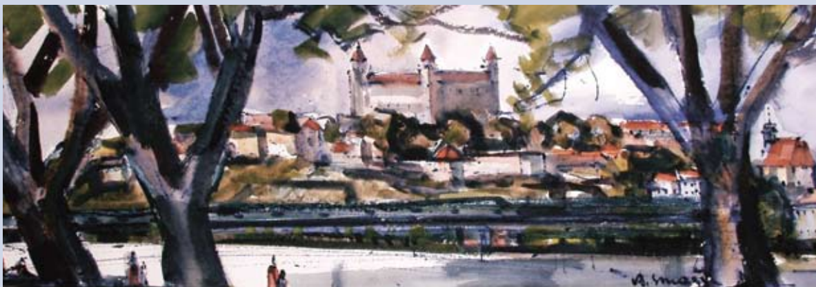
■ Bratislava z Petržalky, 1997, akvarel, 32 x 85