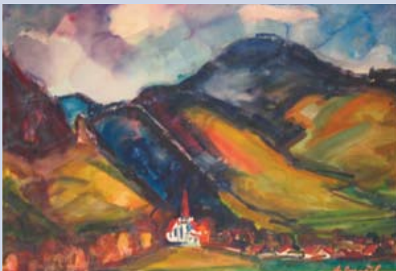
■ Liptovské etudy, 1995, akvarel, 56 x 87