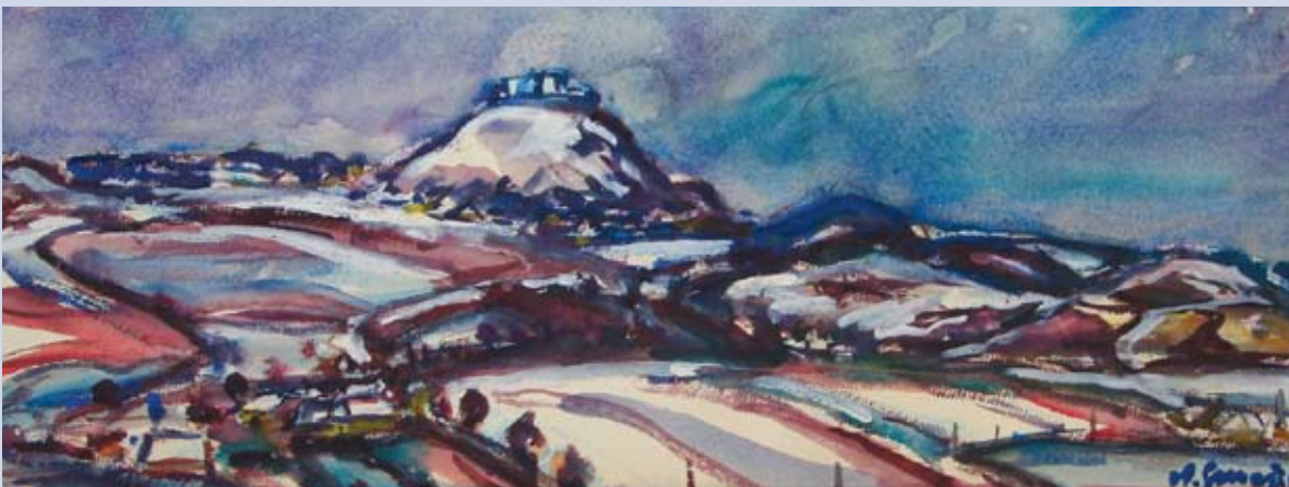
■ Záhorská panoráma - Branč, 1995, akvarel, 28 x 65