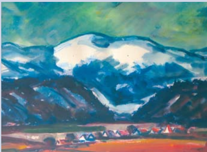
■ Pod Královou hořou 1, 1993, akvarel, 31 x 85