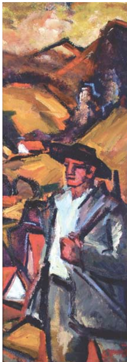
■ Strážca kotliny, 1974, olej, 100 x 35