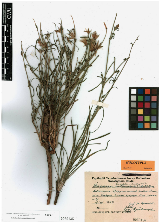
Рис. 1. Гербарний зразок Tragopogon borysthenticus Artemcz. (holotypus)

Fig. 1. Herbarium specimen of Tragopogon borysthenticus Artemcz. (holotypus)