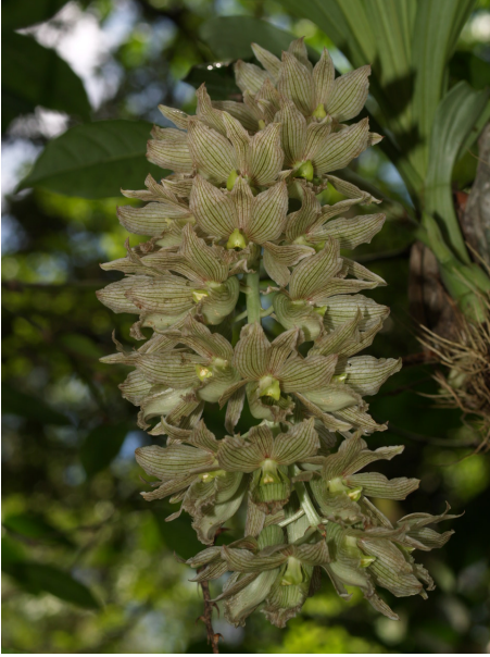
Clowesia thylacochila (Lem.) Dodson