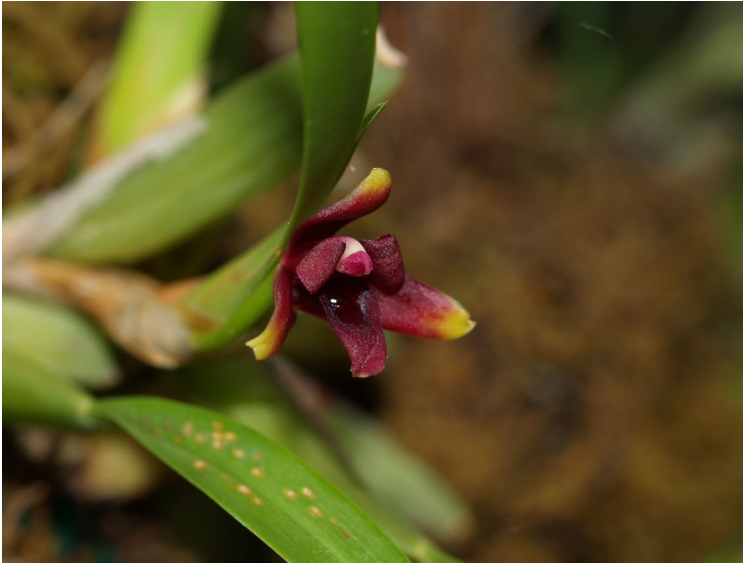
Maxillaria variabilis Batem. ex Lindl.

Anexo fotográfico de algunas Orquídeas de la subcuenca Los Horcones, Cabo Corrientes, Jalisco, México. (part 3).