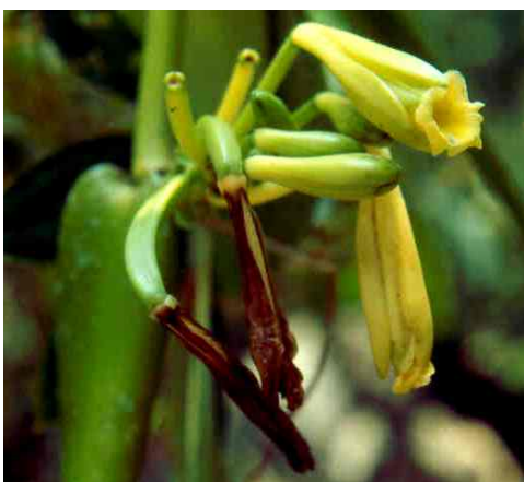
Vanilla pompona Schiede. Especie creciendo como terrestre aunque después cuelga de las ramas altas de los árboles y es aquí donde se presenta la floración de esta magnífica orquídea. Se encuentra creciendo en barrancas húmedas y protegidas del bosque tropical subcaducifolio.