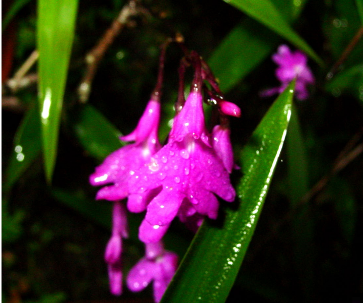
Epidendron longicaule (L. O. Wms.) L. O. Wms. Localidad tipo.