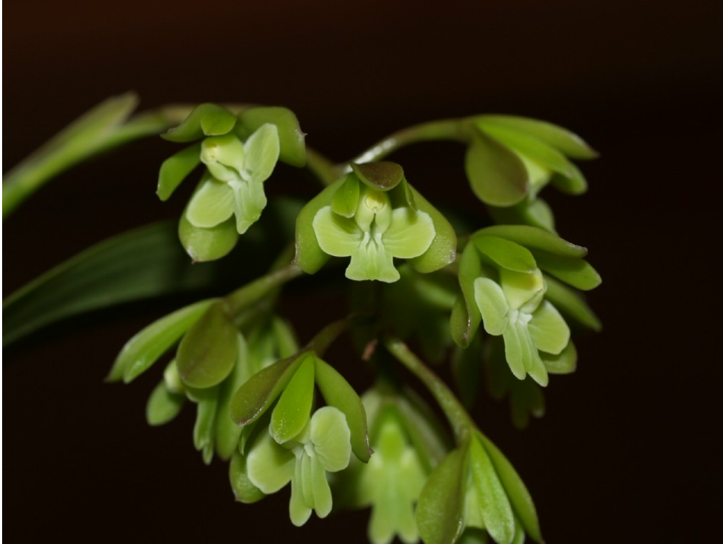
Epidendrum sp. 1

Anexo fotográfico de algunas Orquídeas de la subcuenca Los Horcones, Cabo Corrientes, Jalisco, México. (part 5).