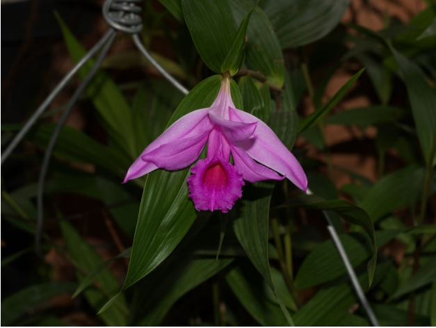
Sobralia decora Batem.

Anexo fotográfico de algunas Orquídeas de la subcuenca Los Horcones, Cabo Corrientes, Jalisco, México. (part 2).