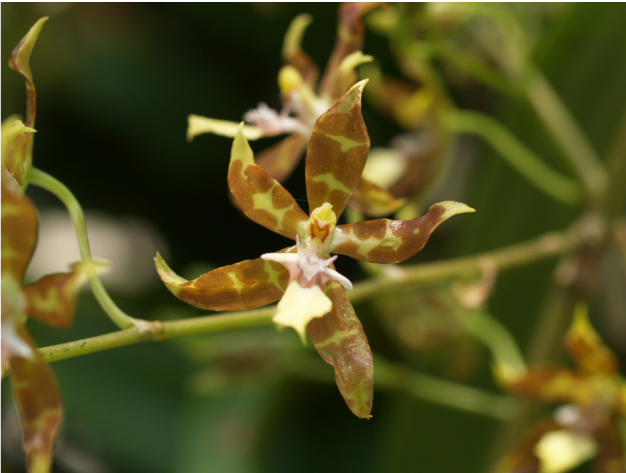
Oncidium aff. Reichenheimii