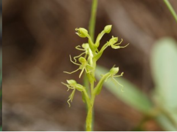
Habenaria aff. novemfida