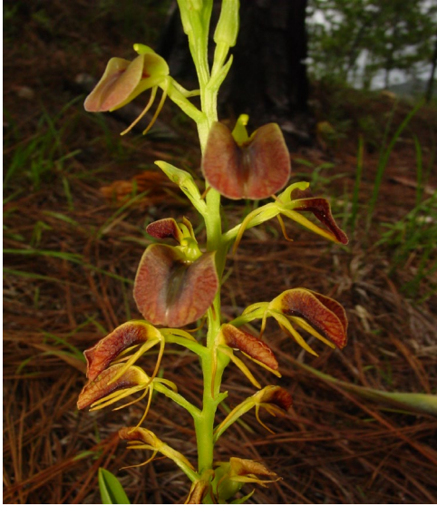
Liparis vexillifera (Lex.) Cogn. Especie geófito frecuente en el bosque mixto de pino-encino.