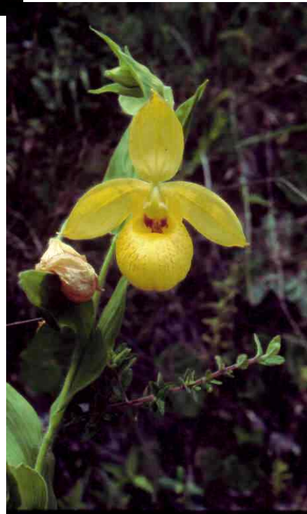
Cypripedium irapeanum Lex. Especie muy escasa y que se encuentra creciendo en barrancas protegidas y húmedas de la subcuenca, como parte del bosque mesófilo de montaña y del bosque mixto de pino-encino.