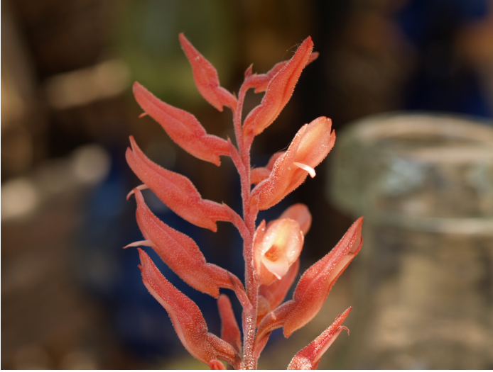
Stenorrhynchos lanceolatum (Aubl.) Rich.