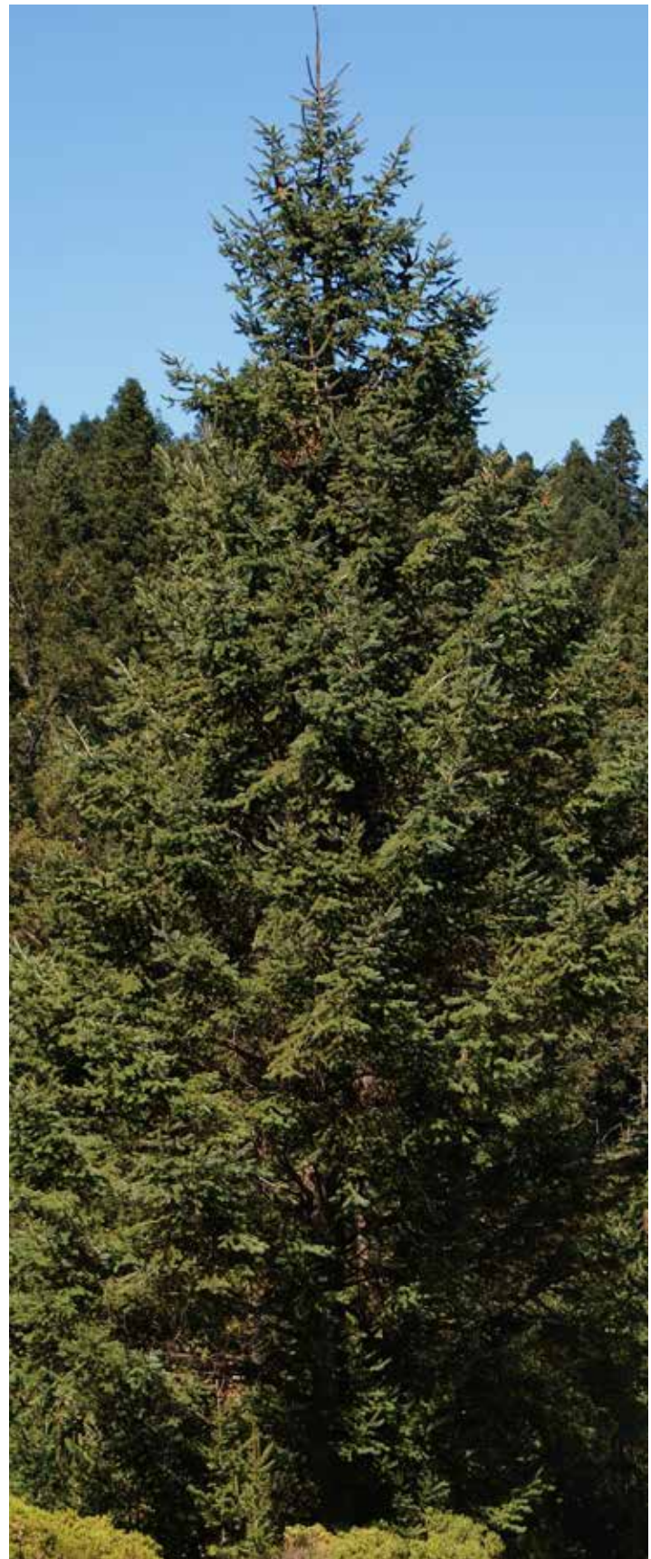
Oyamel de Juárez