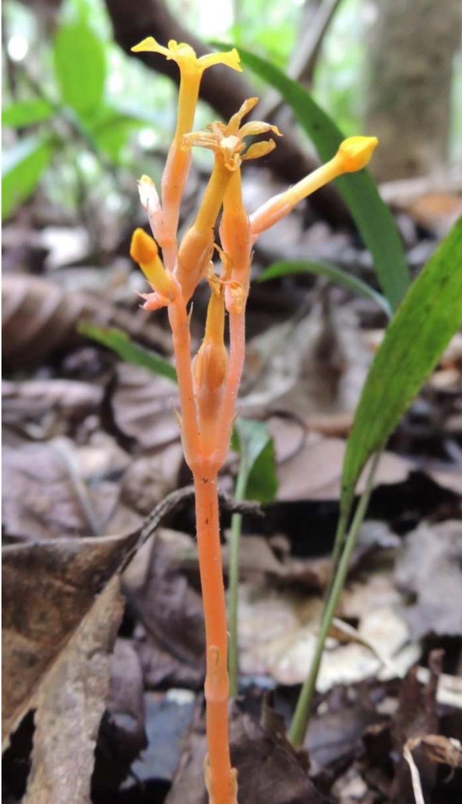
Figura 1. Voyria crucitasensis Y. Guillén & G. Vargas, hábito.