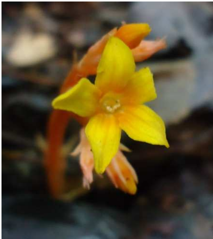
Figura 2. Voyria crucitasensis Y. Guillén & G. Vargas. (sup.) Inflorescencia. (inf.) Detalle de los lóbulos de la corola.