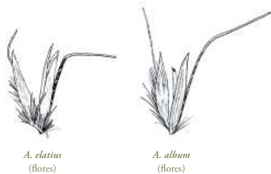
A. elatius (flores)

1. Pedicelo de la flor superior (0,8)1–2 mm; arista de la flor inferior inserta por debajo del nivel de la base de la flor superior; lema generalmente peloso, al menos el de la flor inferior ..... 2. A. album