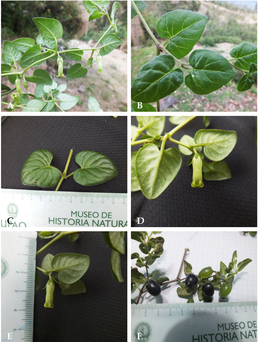
Fig. 2. Salpichroa weingendii S. Leiva, Jara & Barboza. A. Rama florífera; B.-C. Hojas; D.-E. Flores en antésis; F Frutas. (Fotografías: S. Leiva, T. Mione & L. Yacher 6064, HAO).