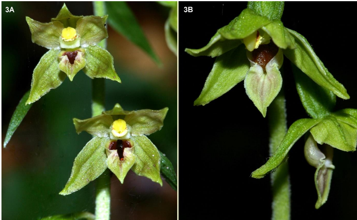
Abb. 3: Epipactis albensis subsp. lusatia und E. leptochila, Blütenstudien. 3A – E. albensis : Lieberose, Behlow, Stockhof, 03.08.2007; 3B – E. leptochila : Reifenstein, Dün, 10.07.08.