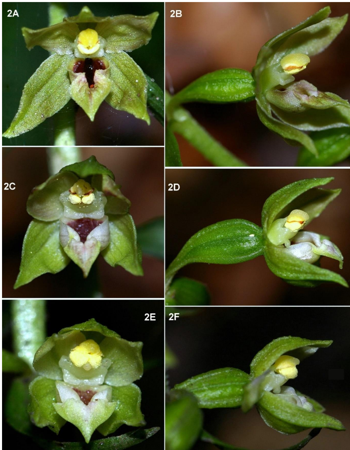
Abb. 2: Epipactis albensis, Blütenstudien. 2A, B – Lieberose, Behlow, Stockhof, 03. 08. 2007 (subsp. lusatia); 2C, D – Parlow-Glambeck, Ochsenwerder, 04. 08. 2007 (subsp. albensis); 2E, F – Joachimsthal, Grumsiner Forst – Jag. 54, 04. 08. 2007 (subsp. albensis).