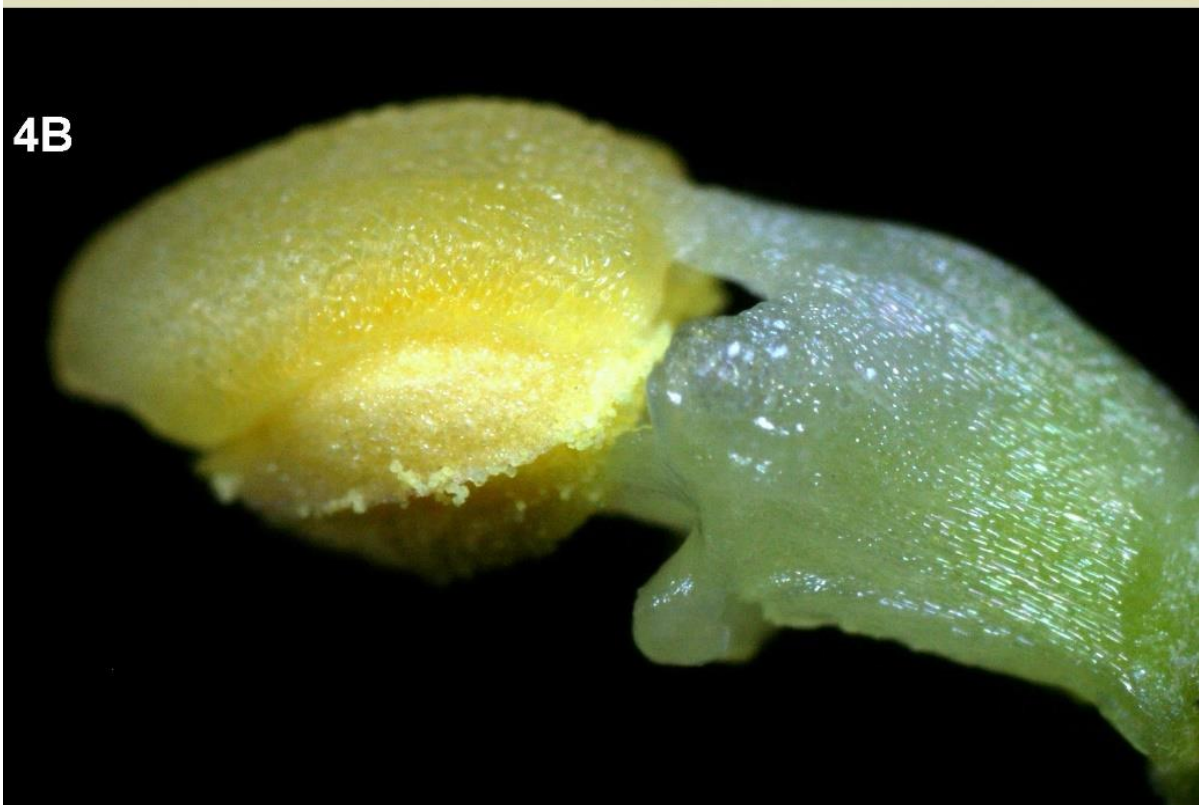
Abb. 4: Epipactis albensis subsp. lusatia. 4A – Knospenstadium, bereits in der Knospe ist das Filament der Anthere deutlich entwickelt, so dass die Anthere mit den Pollinien über das reduzierte Klinandrium gestoßen werden kann, die Staminodien sind nicht ausdifferenziert, die Stigmafläche verläuft fast parallel zur Gynostemiumachse; 4B – Die Lücke zwischen dem Filament der Anthere und dem reduzierten Klinandrium ist ebenso ein diakritisches Merkmal für E. leptochila s. l. (vgl. 5C). Lieberose, Behlow, Stockhof, 4A: 23.07.2008, 4B: 07.08.2007.