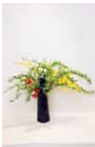
古流松藤会 仲地 理絵