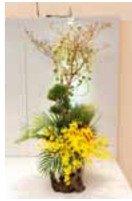
専心池坊 照屋 雅幸