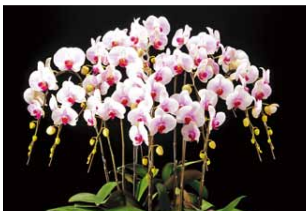
大型A Large A

春へのめざめ Awakening for Spring ビオスの丘(有)らんの里沖縄 Bios on the hill & Okinawa Orchid Village Ltd. 沖縄県うるま市 Okinawa, Japan