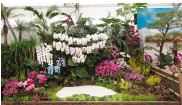
妖精の滝 Angel Falls

金秀グリーン株式会社 Kanehide Green Co., Ltd. 沖縄県 Okinawa, Japan