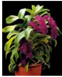
Rhy. gigantea 'Red Sky' 三宅 正幸 Masayuki Miyake