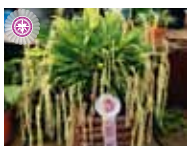
Dench. cobbianum 'Hanabi' ピオスの丘(有)らんの里沖繩