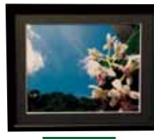
写真 Photograph ナゴランの目上げる空 ~ Sedirea japonica and okinawa Blue sky ~ 野間 大志