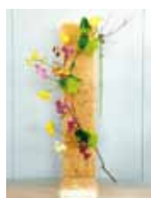
春風をあなたのもとへ 洲鎌 広明