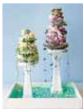
sweets 喜納 歩美