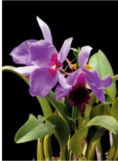
C. Lilly Millard 'Winter Queen'