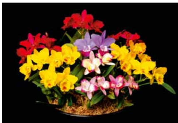
小型A Small A

陽春の輝 Dazzle of Spring Light 沖縄熱帯植物管理株式会社 Okinawa Tropical Plant Management Corporation 沖縄県本部町 Okinawa, Japan