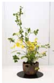
蝶織御流 宮城 芳甫