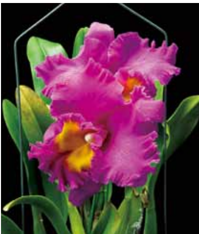
Rlc. Pink Empress 'Toshio' 大城 俊雄 Toshio Oshiro 沖縄県 那覇市 Okinawa, Japan