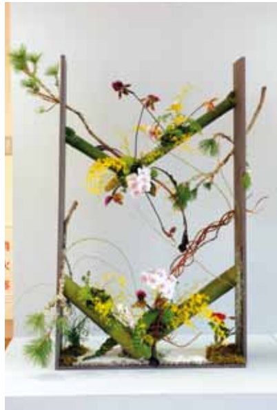
総合デザイン Total Design

破線 ~ a broken line ~ 島袋 清香 Sayaka Shimabukuro 沖縄県西原町 Okinawa, Japan