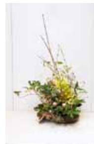
一葉式 金城 葉抄