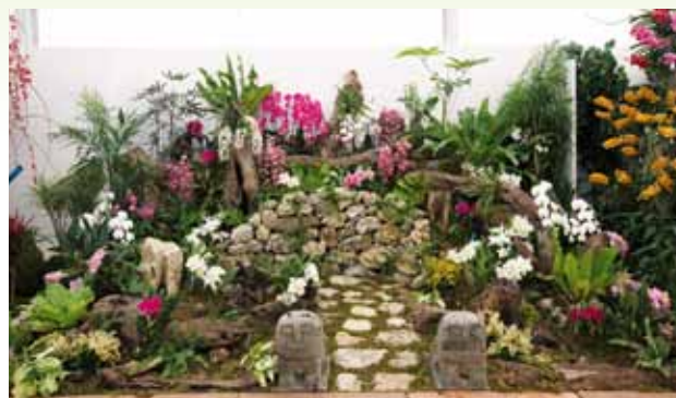
御獄 Utaki - Okinawan Community's Sacret Site

株式会社 グリーンウインド Greenwind Co., Ltd. 沖縄県 Okinawa, Japan