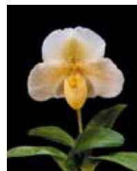
Paph. Pumpkin Icecream 'White Pumpkin' 安長 博文 Hirofumi Yasunaga