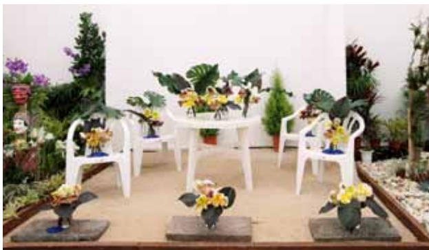
パフ バイ デイ オーシャン Paph by the Ocean 北軽ガーデン Kita Cal Garden 群馬県 Gunma, Japan