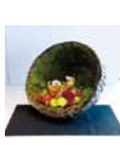
フレッシュラン 仲原 さやか