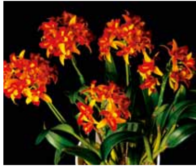
Rth. Tzeng-Wen Queen 'Kiss of Fire' 侑座間洋らんセンター Zama Orchids Center Co, Ltd.