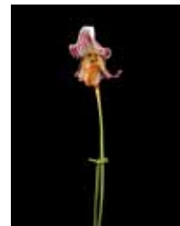
Paph. fairreamun 'Noriko' 名徳 倫明 Michiaki Myotoku