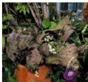
Aer. japonica 'Hokubu'

沖縄県立北部農林高等学校 園芸工学科 Bioengineering Course, Okinawa Prefectural HOKUBU Agricultural High School