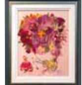
シンデレラの恋 大矢 豊子