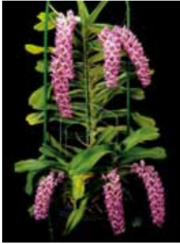
Rhy. gigantea 'Arakaki 104' 侑新垣洋らん園 Arakaki Orchid Nursery Co.

Chairman of Okinawa Churashima Foundation Award