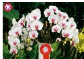
Phal. Mount Lip 町田 文子 Fumiko Machida