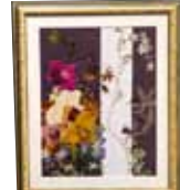
粋 山内 ヨシ子