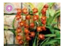
Cym. (Ruby Eyes x Orange Blossum) 'Gold Finger' やまはる園芸