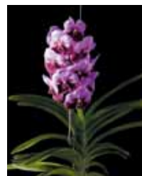
V. (Keeree x Tarcesuka) 'P.P.' Porthep Pornpakde