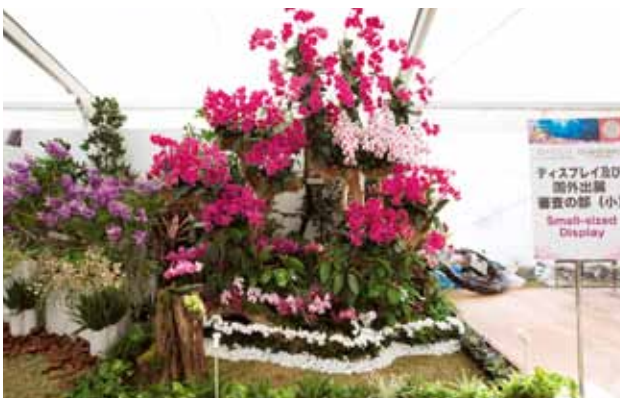
蘭の森 Forest of Orchids

美達蘭業 / 台湾蘭花産銷発展協会 Meidarland Orchids / TOGA 台湾 Taiwan