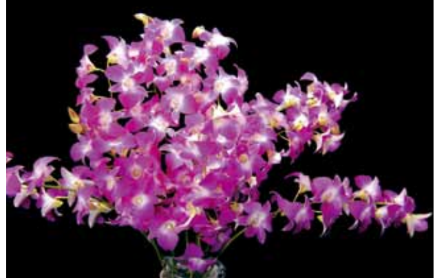
Den. Princess Amy

Nagoya International Orchid Show Organizing Committee 愛知県 Aichi, Japan