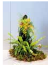
ささやく森の妖精 上間 睦子