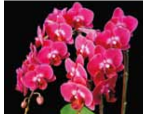
Phal. Mei Dar Ruby 'MD' 美達蘭業 Meiderland Orchids