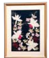
華れいに 金城 順子