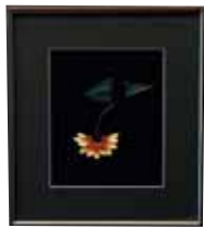
写真 Photograph 影のいたずら 和田 洋