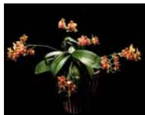
Phal. I-Hsin Black Jack 'Kikuko' 内原 英吉 Hideyoshi Uchihara