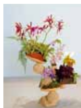
つみき遊び 與古田 幸輔