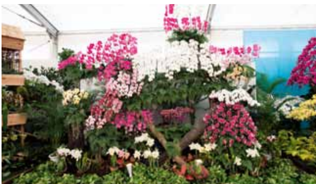
理想の庭園 Ideal garden

(有) 新垣洋らん園 Arakaki Orchid Nursery Co. 沖縄県 Okinawa, Japan