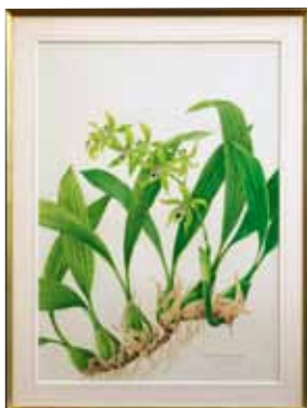
ポタニカルアート Botanical Art