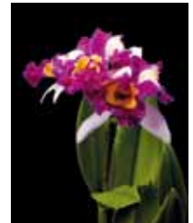
Rlc. Chinese Beauty 'M2' 町田 繁 Shigeru Machida