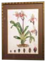
ボタニカルアート Botanical Art Paphiopedilum 藤本 紫泉