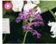
Cal. Rollisonii 'Tyo5' Taoyuan District Agricultural Research and Extension Station