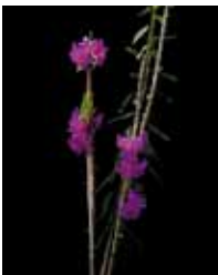
Den. glomeratum 'Sea Girt' 重田 悦子 Etsuko Shigeta