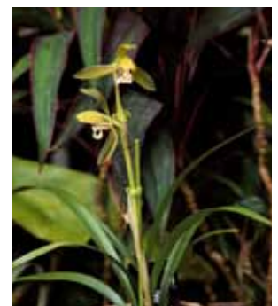
Cym. Hou-shun 'Okina'