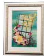
響 平良 幸子

Pressed Flower, Dried Flower 押し花・ ドライフラワー