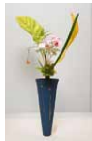
華道家元 池坊 平良 禮子