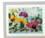
不均征なる均衡 宇田川 ツネ