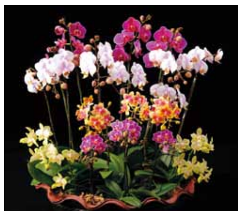
小型A Small A

明日への扉 Door to the Future 沖縄熱帯植物管理株式会社 Okinawa Tropical Plant Management Corporation 沖縄県本部町 Okinawa, Japan