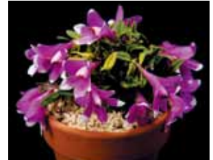
Den. cuthbertsonii 'Kanna' 対馬洋蘭園 Tsushima Youranen