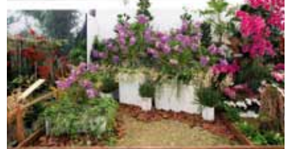
蘭! 生命の美しさがあきらかになってゆく Orchids! A Revelation of Life's Aesthetics Needs

プトラ大学 University Putra Malaysia マレーシア Malaysia