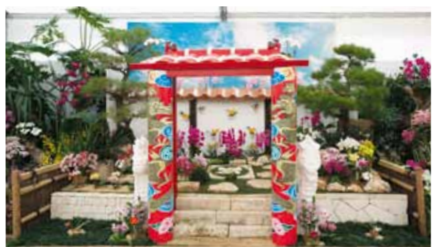
オーキッドリュウキュウガーデン ～リュウキュウアイデンティティ3～ Orchid Ryukyu Garden - Ryukyu Identity 3 -

株式会社 桃原農園 Toubarunouen Co., Ltd. 沖縄県 Okinawa, Japan