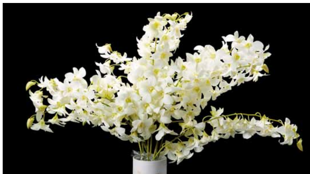
Den. Casa Blanca