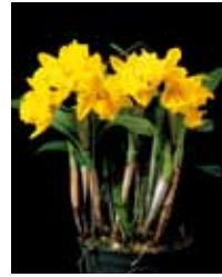
Rlc. Ta-Shinang Yellow Dragon 'Puti Gold' 許永傳/上元蘭花園 Hsu Yung Chuan