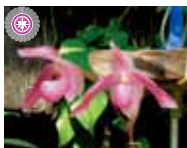
Paph. Doctor Toot 'Overgrown' 丸山野 尚子