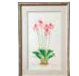
Masd. 'Gertrude Puttock' 水島 一女