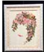
ほほえみのブーケ 伊是名 教子