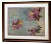
花いかだ 木下 八千代