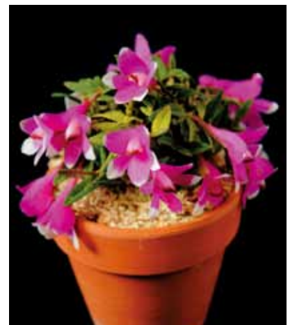
Den. cuthbertsonii 'Kanna' 対馬洋蘭園 Tsushima Youranen 北海道 Hokkaido, Japan