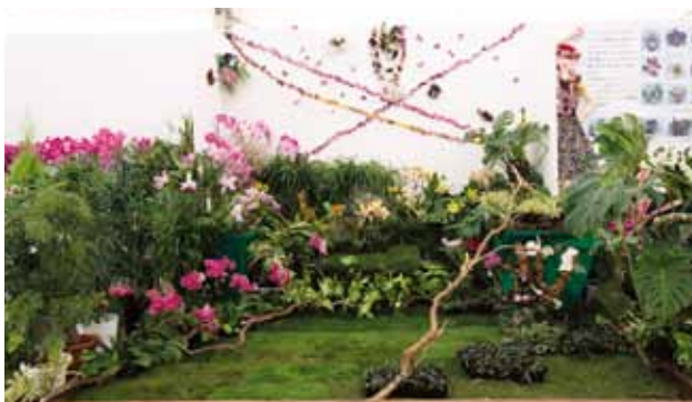
晴れた日 Sunny Day ひねもす Hinemos 東京都 Tokyo, Japan