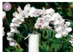
Phal. (I-Hsin Black Jack x Join Diamond) 'OX-1332' 台北市蘭芸協会 Taipei Orchid Society