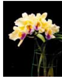
Rlc. Country Road 'Nagahama' 長浜 真俊 Masatoshi Nagahama