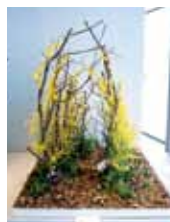
幸せの入口 県立中部農林高等学校 園芸科学科