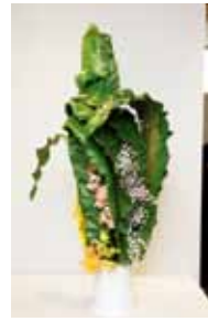
龍生派 喜納 明華