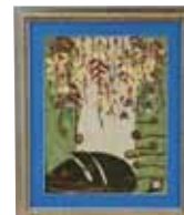
かりゆし ロング 清美