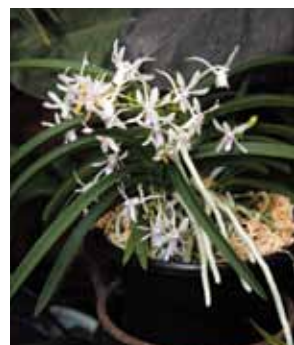
Neost. Pinky 'Sea Girt E'

沖縄県立北部農林高等学校 園芸工学科 Bioengineering Course, Okinawa Prefectural HOKUBU Agricultural High School