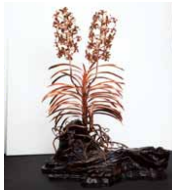
各種工芸 Other Craft Works