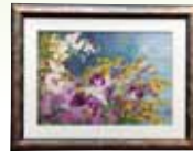
華への誘い 新城 恵子