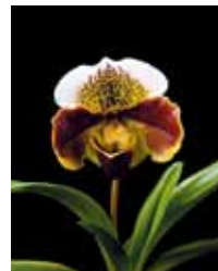
Paph. Miya Plot Lantern 'Kinu River' 大津 豊隆 Horyu Otsu