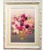
感謝をこめて 新城 百合子