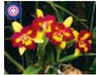
Rlc. Shin Shiang Diamond 宜野座 敏