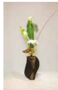
華道家元 池坊 比嘉 ハルヨ