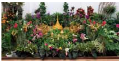
ミャンマー:美しいランがあふれる金色の地 Myanmar: The Golden Land Rich with Beautiful Orchids

ミャンマー花卉生産組合 Myanmar Floriculturist Association, Myanmar ミャンマー Myanmar