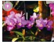
Cl. Secret Love 'Hshinying' 川 博久