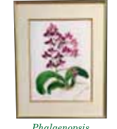
Phalaenopsis 'Dtps.Black Diamond' 小林 洋子