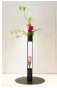
蝶織御流 具志堅 節甫