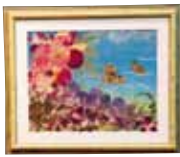
海辺 比屋根 美智