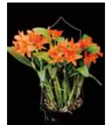
Rlc. Minigyong Orange 'Kin Mani' 喜納 昌久 Shokyu Kina