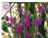
Den. glomeratum 'Ikuko' 川 育子