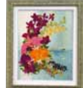
春の窓辺 宇田川 ツネ