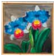
夢のカトリア原寸大 長浜 真俊