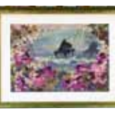
愛の詩を奏でる 新城 恵子