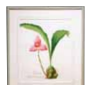
Lyc.Abou First spring 602 東堤 由美子