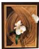
大きな まるの中に 花いろ工房