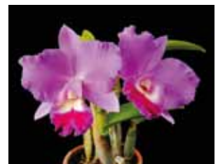
Blc. (Mini Purple x Tokyo Bay) 'Okinawa Queen' 綿貫 芳文 Yoshifumi Watanuki