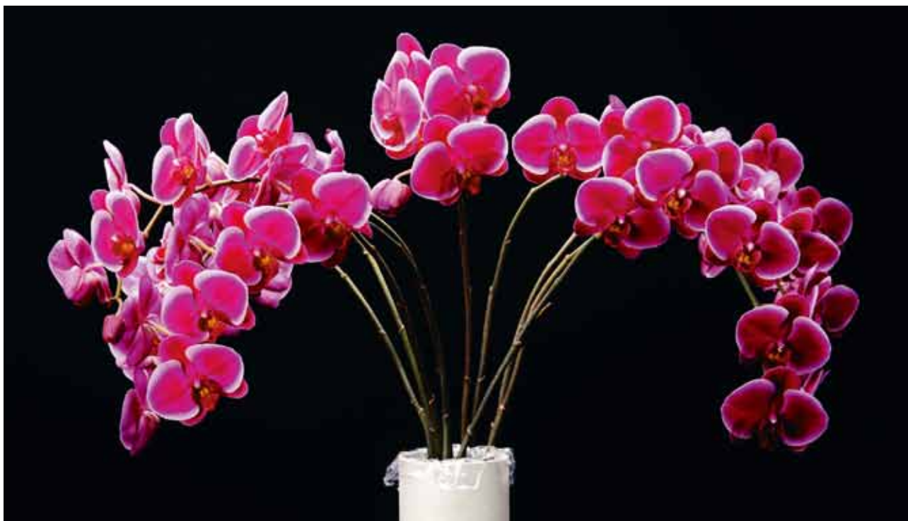
Phal. Shiun-Dong Red Rose 'SD'

Minister of Agriculture, Forestry and Fisheries Award