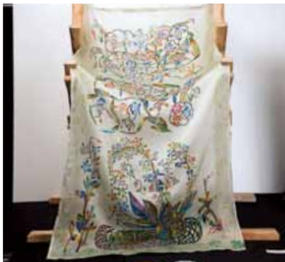
各種工芸 Other Craft Works

ラン・らん・蘭 みんなそろって花遊びです La La La! Flower Play with Orchids!