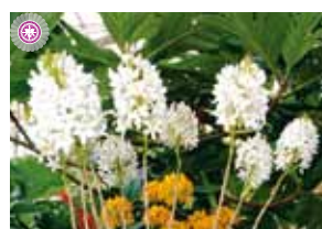
Epi. Princess Valley 'White Castle' 稲嶺 盛昭 Moriaki Inamine