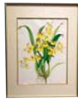
ボタニカルアート Botanical Art Oncidium 'Aloha Iwanaka' 小林 洋子