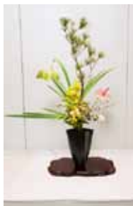
専心池坊 兼次 鼓峰