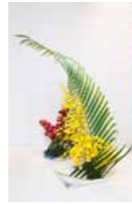
専心池坊 当真 芳水