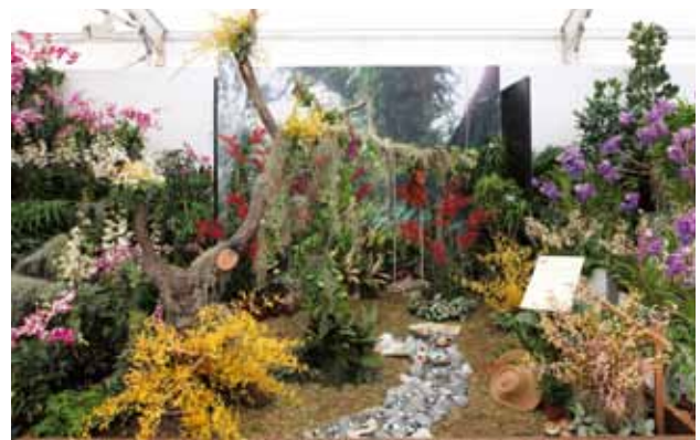
レナンテラ・ファンタジー Renanthera Fantasy

東南アジア蘭協会 Orchid Society of South East Asia, Singapore シンガポール Singapore