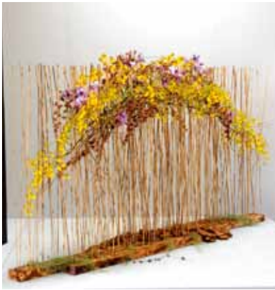
総合デザイン Total Design

破線 ~ a broken line ~ 島袋 清香 Sayaka Shimabukuro 沖縄県西原町 Okinawa, Japan