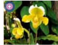
Paph. Outer Limits 'K' 西崎 菊男