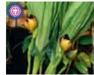
Ang. ruckerii 'Gigi' Ecuagenera