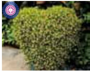
Din. polyulbon 'Mori' 若林 光男