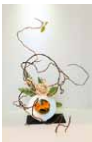
一葉式 知名 葉和