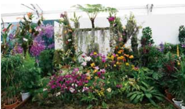
琉球エレジー Ryukyu Elegy

(株) 沖縄庭芸 Okinawa Garden Art Corporation 沖縄県 Okinawa, Japan