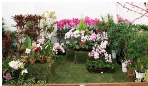
時代 Era プランニングU Plannning U 神奈川県 Kanagawa, Japan