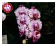
Dips. Tiannong Glory 'Fireworks' 仲里園芸