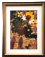
傷 心 上江洲 利江子