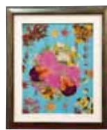
華織り 高嶺 邦子