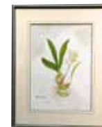
Eria flava( エリアフラバ) 金子 恵子