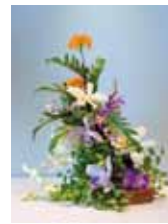
庭園 澤岬 隼人