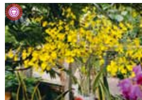
Onc. Gower Ramsey 'Honey Drop' 長嶺 由守 Yoshimori Nagamine