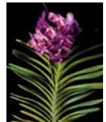
V. Somsri Thai Spot 'Rangsit' Thai Hanajima Orchid