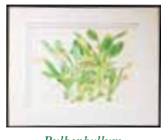
Bulbophyllum boninense(Schltr.)J.J.Sm オガサワラシコウラン 村上 裕子