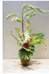
華道家元 池坊 知念 則子