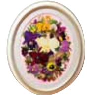
パーティー 有島 清子