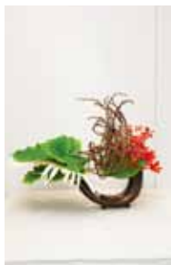
草月流 照屋 柳恵