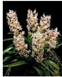
V. lamellata 'Kuniko' 宮良 祐次 Yuji Miyara