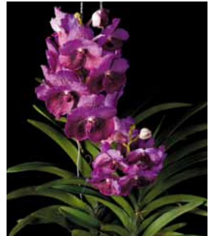
V. (Bitz's Heartthrob x Sirilak) 'P.P.' Pornthep Pornpakdee タイ Thailand