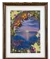
夕日に輝く 屋宜 富士子