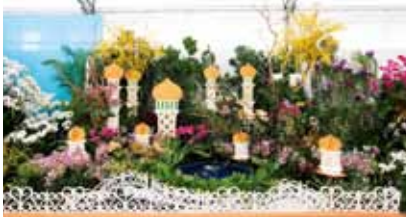
蘭の持つ王威 The Royalty of Orchid

ジャスミナ フローリスト & ランドスケーピング カンパニー Jasmina Florist & Landscaping Company ブルネイ・ダルサラーム Brunei Darussalam