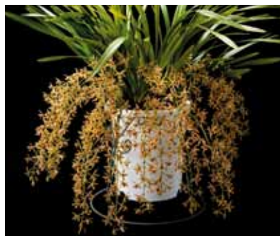
Cym. Pakkret Pudding 'Sunburst' 粟野原 潤 Makoto Awanohara