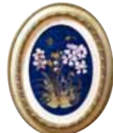
アンティークオーキッド ロング 清美