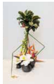
古流松藤会 伊舎堂 理辰