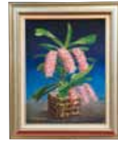
絵画 Painting リンコステイリス ギガンティア 名嘉真 勉