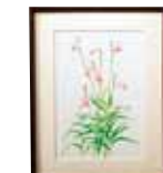
ナリアラン (Arundina graminifolia) 森田 美智子