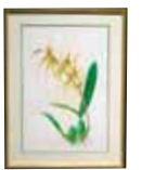
スパイダーゴールド 'Brs.Eternal Wind Summer Dream' 金津 八重