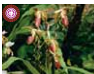
Paph. Chiu Hua Dancer 'Kashiwa' 小川 晴久