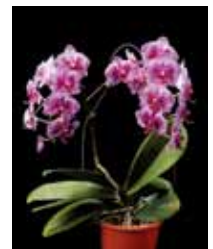
Phal. Chian Xen Piano 'CX339' 新垣 雄文 Yubun Shingaki