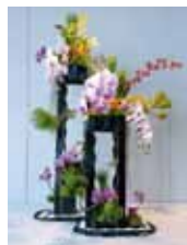
春の宴 宮城 美雪