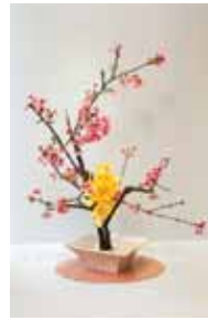
嵯峨御流 比嘉 康甫