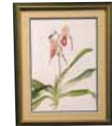
Paphiopedelum 森 雅子