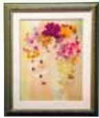
ラン・ラン気分 中島 トモ子