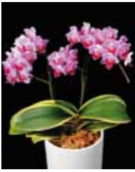
Phal. Sogo Vivien 'White Leaf' 侑座間洋らんセンター Zama Orchid Center Co., Ltd.