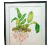
Trichopilia suavis 水島 一女