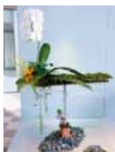
凜として 飯室 宏治