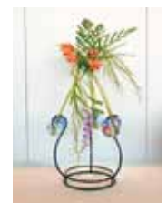
支え合って結マール 名幸 奨司