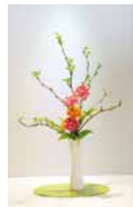
嵯峨御流 平良 江美甫