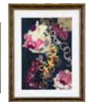
華の宴 上江洲 みさき