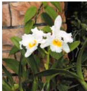
C. Roman Silver 'Pearly Gates'

名古屋国際蘭展組織委員会 Nagoya International Orchid Show Organizing Committee