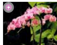
Phal. Tiannong Golden Vivien 'Swan Lake' (有)座間洋らんセンター