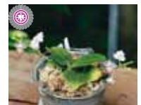
Phal. Liu's Appenlob 'MD' 平地 正三