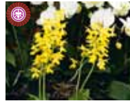
Cal. sieboldii 'Tyo1' Taoyuan District Agricultural Research and Extension Station