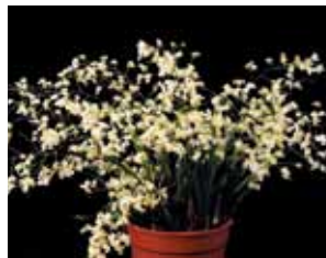
Onc. Misaki Twinkle Obry 'Only You' 許 永傳 Hsu Yung Chuan