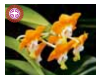
V. denisoniana 'Blumen Insel II' Thai Hanajima's Orchid