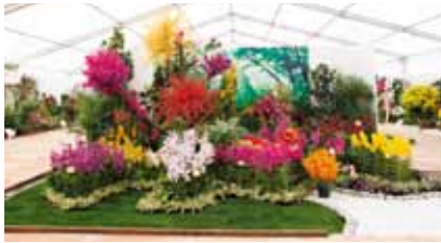
可愛らしいモカラ Charming of Mokara