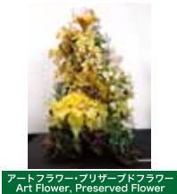
アートフラワー・プリザーブドフラワー Art Flower, Preserved Flower ラッキー らん 蘭 嘉手納 登美子