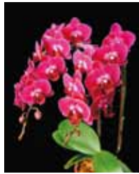
Phal. Mei Dar Ruby 'MD' 蘇南回,美達蘭業 Su nan Hui / Meidarland Orchids