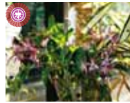
Den. Maroon Star 'Cavalier' 大芝 敬子