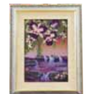
さわやかな朝 屋宜 富士子