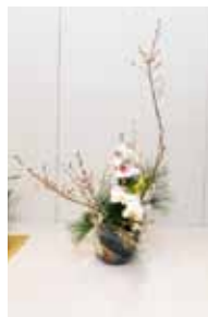
草月流 我那覇 喜美子