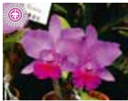
Rlc. [(C. walkeriiana x Rlc. Creation) x C. walkeriiana] 喜納 悟