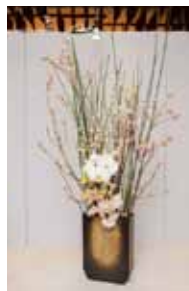
草月流 喜屋武 芳玉