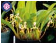
Max. triloris 'Yurika' やまほろ園芸