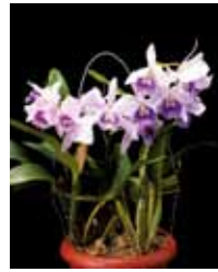
Lnt. Blue Angel 'Glove' 新垣 雄文 Yubun Shingaki