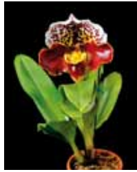
Paph. Thunder Shot 'Sachiko' 住吉 秀文 Hidefumi Sumiyoshi