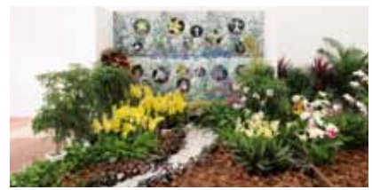
台湾原産のエビネ The Indigenous Calanthe of Taiwan

桃園区農業改良場 Taoyuan District Agricultural Research and Extension Station 台湾 Taiwan