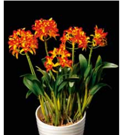
Rth. Tzeng-Wen Queen 'Kiss of Fire' (有)座間洋らんセンター Zama Orchid Center Co., Ltd. 神奈川県 Kanagawa, Japan