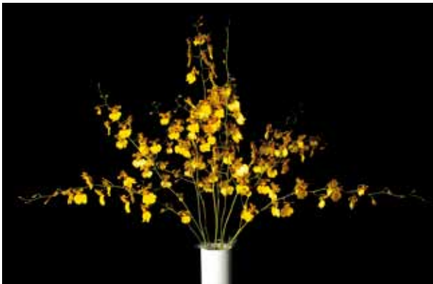
Gom. Millennium Gold