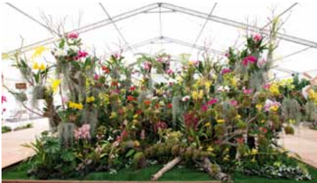
沖縄の微風に抱かれて Orchids, Embraced by Breeze of Okinawa

名古屋国際蘭展組織委員会 Nagoya International Orchid Show Organizing Committee 愛知県 Aichi, Japan