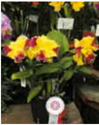
Rlc. Hwa Yuan Grace 'Nekooh' 伊佐 英仁 Eijun Isa