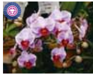
Dips. (Little Gem Stripe x Wedding Bell) 'Sunrise' 仲里園芸