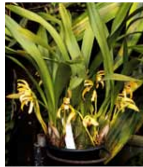
Max. picta 'Fragrance Bard'

名古屋国際蘭展組織委員会 Nagoya International Orchid Show Organizing Committee