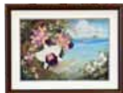
タッチューを眺む美ら蘭 屋宜 富士子