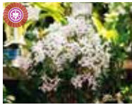
Den. Cassiope 'Shikizan' 片柳 和子