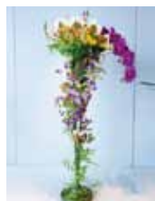
Fabulous Queen 宇良 俊二