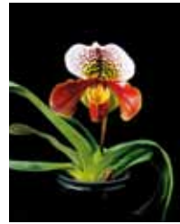
Paph. World Records 'Elegance' やまはる園芸 Yamaharu Engei