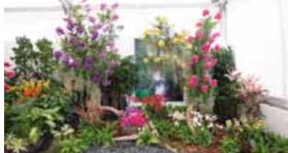
オーキッド・ファンタジー Orchid Fantasy

タイ ハナジマオーキッド アンド ブルメンインセル オーキッド Thai Hanajima's Orchids Co. Ltd & Blumen Insel's Orchids タイ Thailand