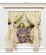
花のように美しく 松田 ゆりか