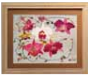
お茶の時間 蘭の花と共に 川尻 君子