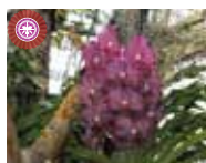
V. Somsri Thai Spot 'Rangsit' Thai Hanajima's Orchid