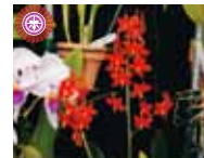
Psh. vitellina 'Maki' 牧 久雄