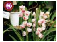
Cym. Sweet Waffle 'Tarte' やまはる園芸