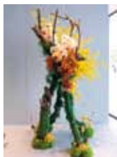
東風のかぜ 井手 八江子