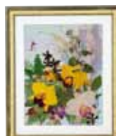
Only one 登野原 りつ子