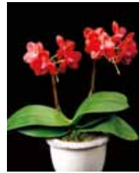
Phal. (Tying Shin Miracle x Tying Shin Forever Love) 'Chura Tida' (有)座間洋らんセンター Zama Orchids Center Co, Ltd.