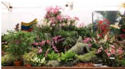
魅惑の春 Enchanted Spring

チャーワーサン オーキッドファーム Cheah Wah Sang Orchid Farm マレーシア Malaysia