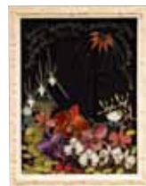
押し花・ドライフラワー Pressed Flower, Dried Flower 百花繚蘭 平良 幸子