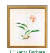
LC.santa Barbara 'Sunset Showtime' HCC/AOS 河守 保子