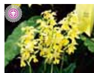
Cal. sieboldii 'TYO4' Taoyuan District Agricultural Research and Extension Station