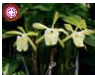
Rl. glauca 'Yuu' 鈴木 優子