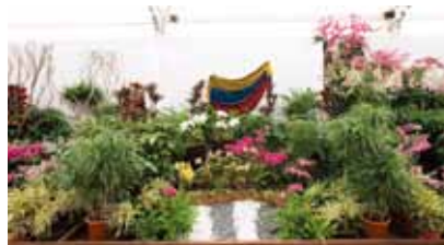
命を愛する国、エクアドル Ecuador Loves the Life

ムンディフローラ MUNDIFLORA CIA. LTDA. エクアドル Ecuador