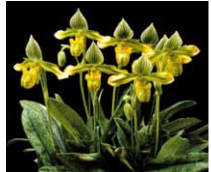
Paph. venustum, album 'Josai' 桜井 幸広 Yukihiro Sakurai