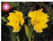
Rlc. Ta-Shing Yellow 'Shang Yuan' 町田 繁