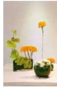
専心池坊 花城 春静