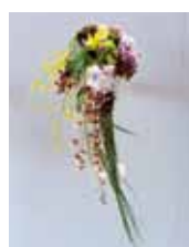
happy flower 一花