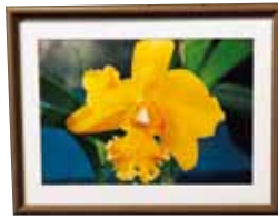
写真 Photograph かがやき 櫻井 千代子