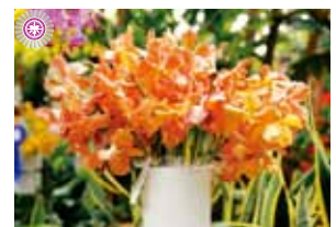
V. Variety 祝嶺 秀治 Hideharu Shukumine