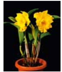
Rlc. Ta-Shing Yellow 'Shang Yuan' 町田 繁 Shigeru Machida