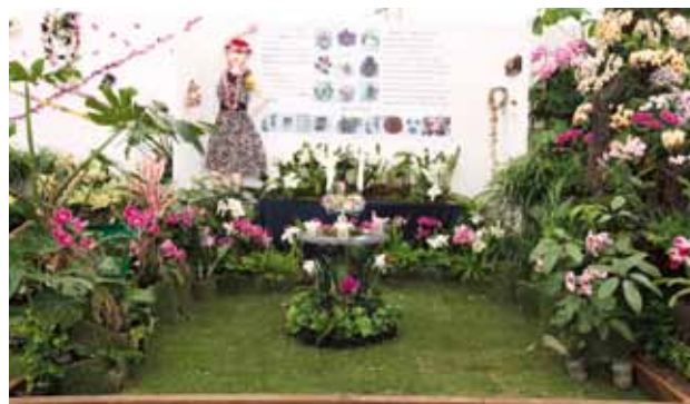
新しい時代 New Time 株式会社光成 KOSEI 大阪府 Osaka, Japan