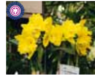
Rlc. Ta-Shaiang Yellow Dragon 'Puti Gold' 許永傳/上元蘭花園