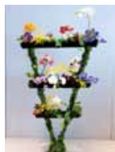
蘭符 池ノ上 翼