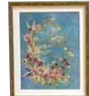
導 き ロング 清美