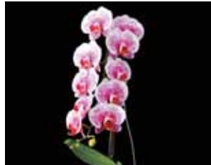
Phal. Acker Sweetie 'Dragon Tree Maple' 新垣 雄文 Yubun Shingaki