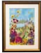
夢に向かって 新城 禮子