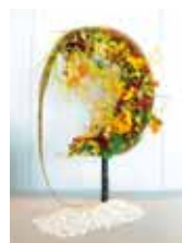
月あかり happy flower 一花