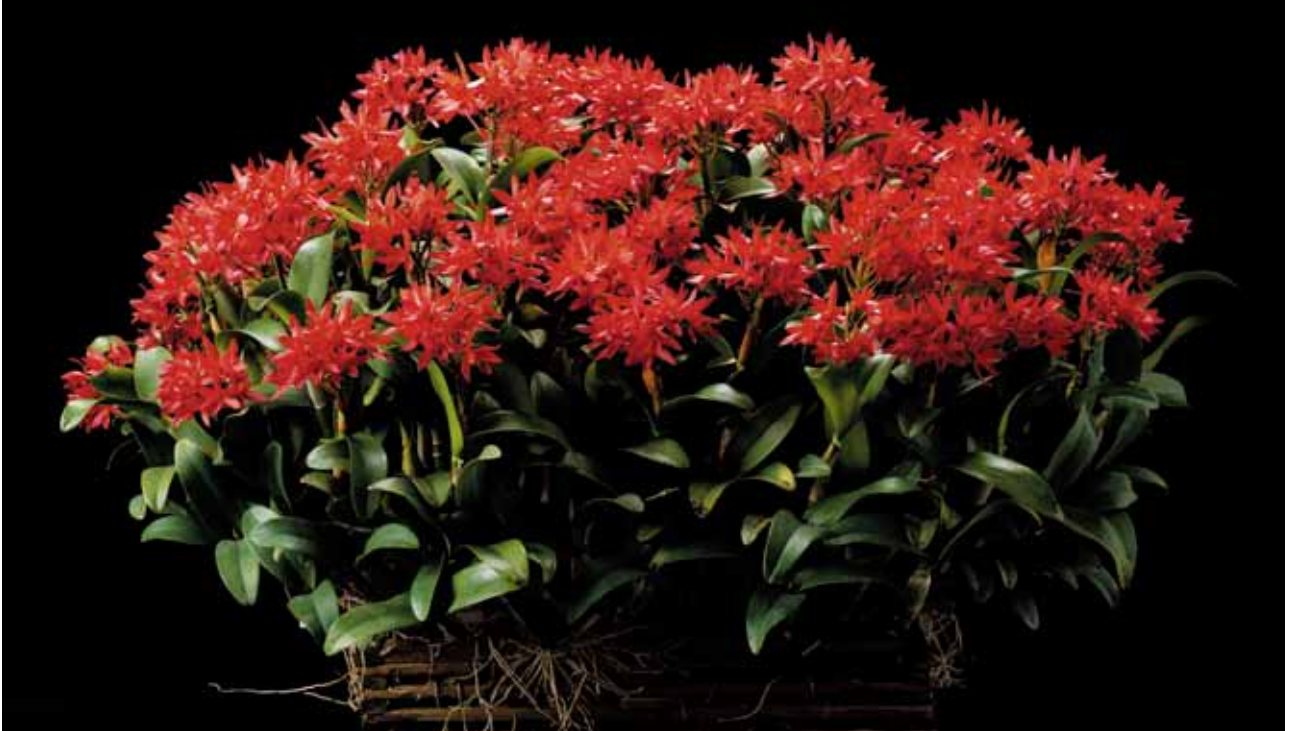
Gur. aurantiaca 'Yoko's Candy'

Minister of State for Okinawa and Northern Territories Affairs Award