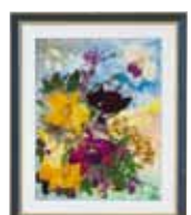
春の夢 山内 ヨシ子