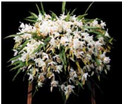
Coel. cristata 'Suwada' 朝倉 繁實 Shigemi Asakura