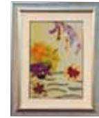
緑 岸本 米子