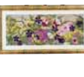
春爛漫 伊是名 教子