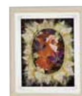
花 CORONA 大城 里美