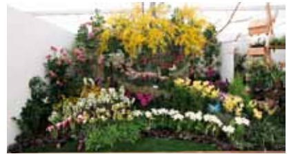
ランの花の世界 蘭花世界 Orchid World