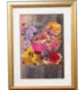
南国 gift 上江洲 みさき