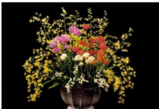
大型A Large A

Chairman of Asia Pacific Orchid Conference in Okinawa Executive Committee Award