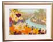
南の島の楽園 市成 和江