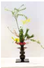
龍生派 仲程 房華