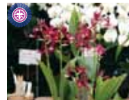
Phcal. Kryptonite 'Tokyo Red' 唐澤 ヒサ