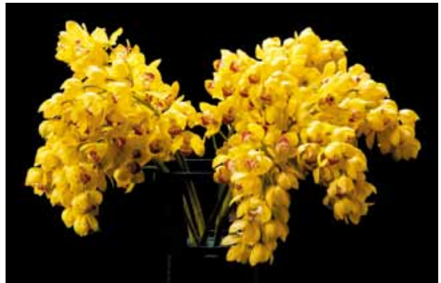
Cym. Lovely Movie 'Gold Rush'