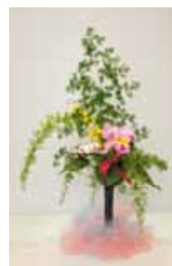
櫻花遠州流 平良 利賀