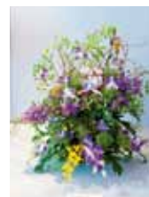
River 安慶名 祐樹