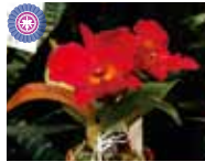
Rlc. Heart Warmer 'Miyachan' 運見 俊光