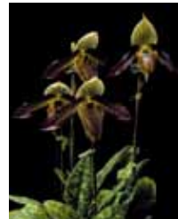
Paph. wardii 'Garyu II' 綿貫 芳文 Yoshifumi Watanuki