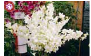
Den. Casa Blanca 当山 初枝 Hatsue Toyama