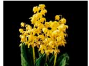
Cal. sieboldii 'TY02' Taoyuan Distinct Agricultural Reserch Extension Station