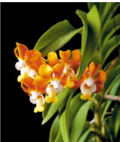
V. densoniana 'Blumen Insel II' Thai Hanajima's Orchid タイ Thailand