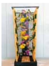
自由気まま 仲間 一史