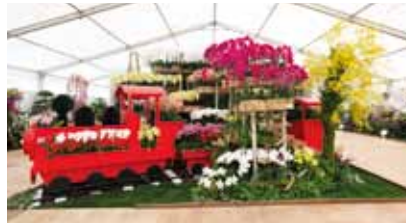
阿里山の春 Spring at Alishan

台湾蘭花産銷發展協會 / 台湾国際蘭展 Taiwan Orchid Growers Association / Taiwan International Orchid Show 台湾 Taiwan