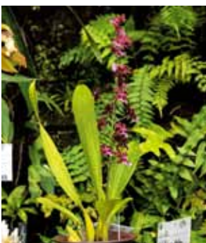
Onc. Sharry Baby 'Wine Face'