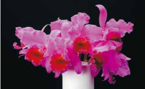
Rlc. Merrily Murison 'Parfum'

Chairman of Okinawa Churashima Foundation Award