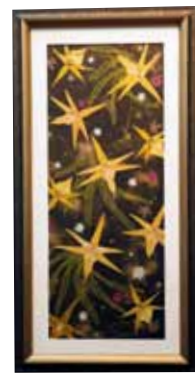
押し花・ドライフラワー Pressd Flower, Dried Flower