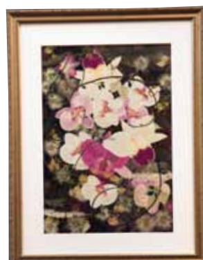
押し花・ドライフラワー Pressd Flower, Dried Flower