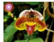
Paph. (Pacific Ocean x Spotglen) 'Spoted Daki' 稲谷 稔