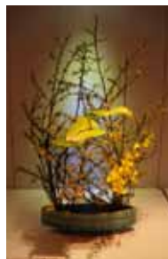
専心池坊 比嘉 秋聲