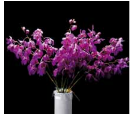
Mok. Chulee Purple 'Wong' Commercial Orchid Growers Association of Malaysia