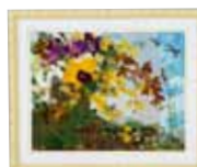
郷 愁 山内 ヨシ子