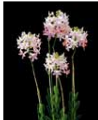
Epi. Sweet Valley 'Fantasy' 稲嶺 盛昭 Moriaki Inamine