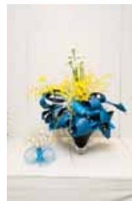
専心池坊 棚原 綾月