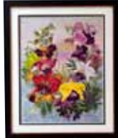
海辺の集い 有島 清子