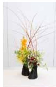
一葉式 知花 恵抄