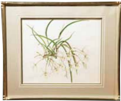
ポタニカルアート Botanical Art

Chairman of Asia Pacific Orchid Conference in Okinawa Executive Committee Award