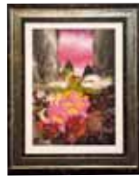
押し花・ドライフラワー Pressed Flower, Dried Flower 蘭の香りに誘われて 東江 榮子