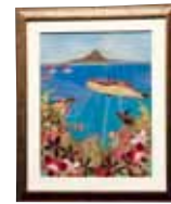
母の故郷 宮城 ひとみ