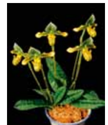
Paph. venustum 'Suigen' 岡田 俊治 Toshiharu Okada