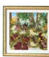
癒しの森 市成 和江