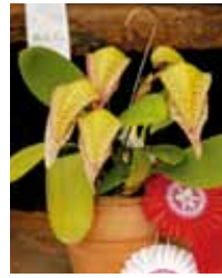
Bulb. arfakianum 'Condor' 足立 剛 Tsuayoshi Adachi