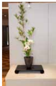
専心池坊 我那覇 玲玉