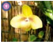
Paph. Shun-Fa Golden 'Kashiwa Haru' 小川 晴久