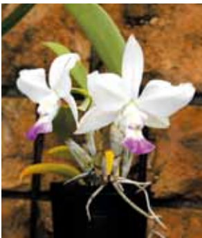
C. walkeriana 'Yasuda'