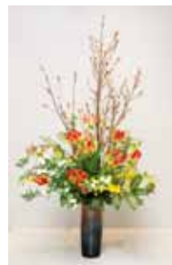
専心池坊 比嘉 柳晴