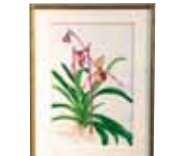
Paphiopedelum Julius 'Jupiter' 湯浅 美智代