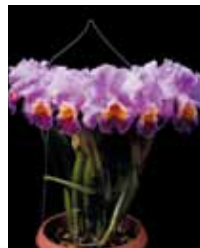
C. Glorious Mind 'Sekiryu' 山城 石龍 Sekiryu Yamashiro