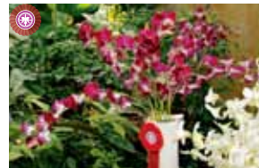
Den. Red Ball Commercial Orchid Growers Association of Malaysia