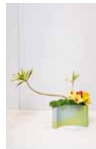
専心池坊 東風平 恵郎