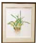
Maxillaria luteo var.alba 'Maxim' 秋原 泰子