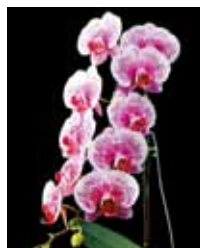
Phal. Acker Sweetie 'Dragon Tree Maple' 新垣 雄文 Yubun Shingaki