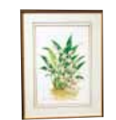
セロジネ (インターメディア) COELOGYNE 'INTERMEDIA' 田村 稔