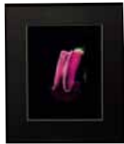
写真 Photograph 私は何でしょう？ 和田 キミ子