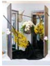
透き通る空間 沖縄県立中部農林高等学校 園芸科学科