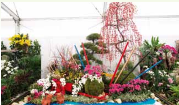
琉球の吉祥花車 Auspicious Float of Ryukyu

株式会社 グリーンウインド Greenwind Co., Ltd. 沖縄県 Okinawa, Japan