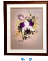
魅 惑 平良 幸子