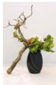
草月流 宮城 涼光