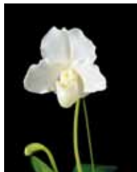
Paph. White Knight 'Ones Heart' 當山 繁則 Shigenori Toyama