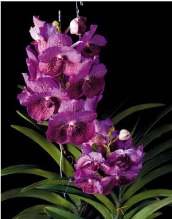
V. ( Bitz's Heartthrob × Sirilak ) 'P.P.'