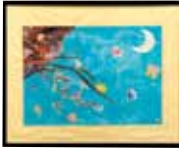
蘭と戯れる 平野 撫子