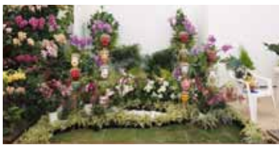
伝統舞踊マランガン 踊り手の仮面 Mask of Malangan Traditional Dancer

インドネシア蘭協会 Indonesian Orchids Society of Malang, East Java インドネシア Indonesia