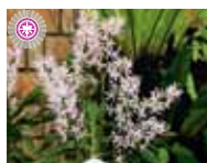
Rust. Manoa Queen 'White Dragonfly' Orchis Floriculturing Inc.