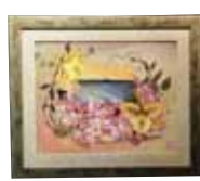
夕映えの伊江島 伊是名 教子