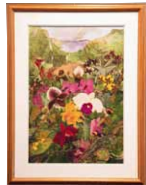
押し花・ドライフラワー Pressd Flower, Dried Flower