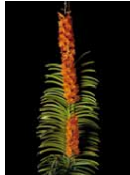
Ascda. Suksamran Sunlight 'Wuttiphphan' Wuttiphphan Keesanga