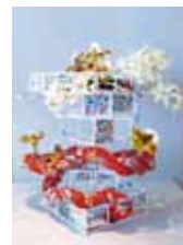
宴 安谷屋 則光