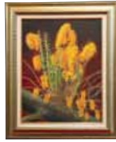
絵画 Painting 樹上に咲く蘭 名嘉真 勉