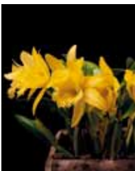
Rlc. (Husky Boy x digbyana) 'Moon' ピオスの丘(有)らんの里沖繩 Bios on the hill & Okinawa Orchid Village Ltd.