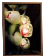
ひらく 上間 昭一