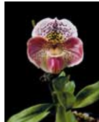
Paph. Friend Jaguar Sato 'Ladybird' 小野 章 Akira Ono