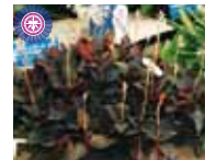
Ludisia. discolor var. dousoniana 'FN-Beat' 中島 文子