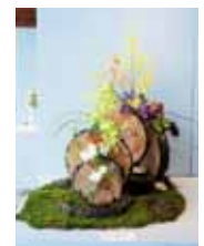
過ぎゆく季節の中で 比嘉 秀夫