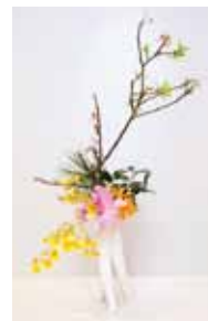
草真流 喜屋武 覺畔