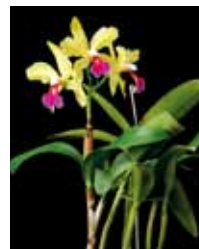
C. Kencolor 'Green Meadows' 山川 宗賢 Soken Yamakawa