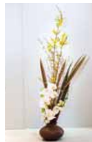
草真流 平良 覺泡