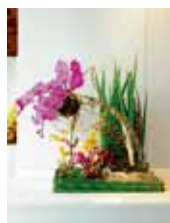
the Oasis of heart~心のオアシス~ 仲本 政宗