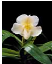
Paph. Ice Age 'Pritty' 石松 久芳 Hisayoshi Ishimatsu