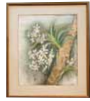
絵画 Painting エレガントに 名嘉真 静江