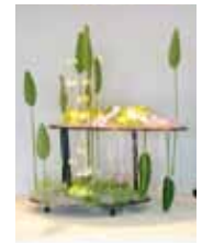
天空 飯室 宏治