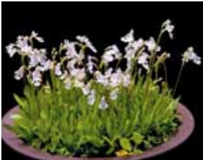
Ami. lepidum 'Shimabukuro' 島袋 哲行 Tetsuyuki Shimabukuro