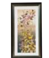
オンシジウムの夢 伊是名 教子