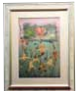
パフィオの森の赤い家 伊是名 教子