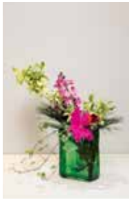
草真流 平良 覺泉