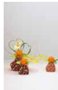
華道家元 池坊 北山 綾子