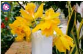
Rlc. Haw Yuan Gold 'Ying Koug No.2' 名古屋国際蘭展組織委員会 Nagoya International Orchid Show Organizing Committee