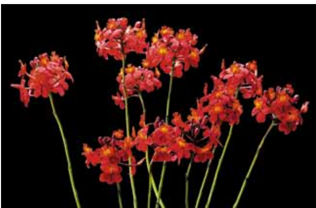
Epi. Ayane Okinawa