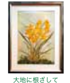
大地に根ざして -Rooted in the earth- ロング 清美