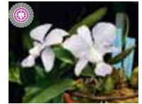
C. walkeriiana fma. corruela 'Edward' 村川 功雄