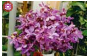
Aranda Nora Blue 新垣 勝信 Katsunobu Arakaki