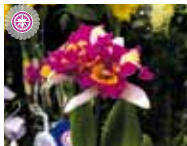
Rlc. Chinese Beauty 'M2' 町田 繁