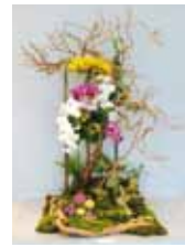
木もれ日の春 古本 よりみ