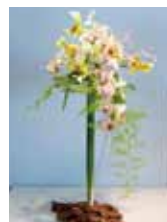
春風にさそわれて 鳥袋 美智子