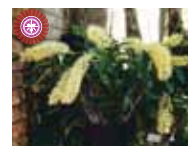
Den. spesiosum 'Breeze of New Zealand' 名古屋国際蘭展組織委員会