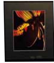
写真 Photograph 黄金に染まる 和田 洋