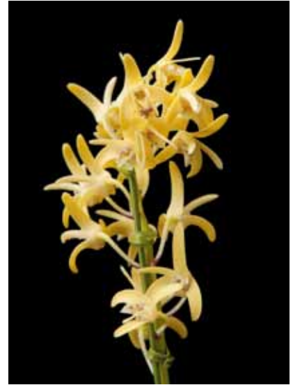
Den. speciosum 'Natsue S'