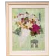
ウェディングバリ 豊里 久美子