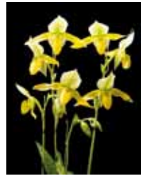
Paph. Green Horizon 'Green Field' 齋藤 雅徳 Masanori Saito