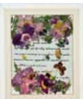
タイムマシーン 大矢 豊子