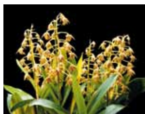
Den. macrophyllum 'Kawa' 川 博久 Hirohisa Kawa