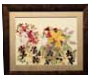
甘い香りに誘われて 宮城 ひとみ