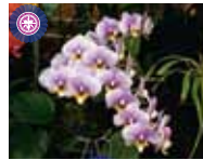
Phal. (Little Maki x (Gold Amar x Crystal Lady)) 'Sakura' (有)座間洋らんセンター