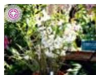
Den. NE Okinawa 'Pretty Girl' 仲里園芸