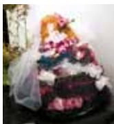
幸せ 吉水 和