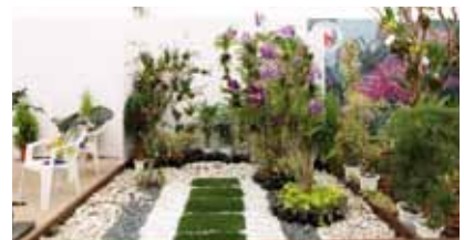
タイ産のラン Orchids Species from Thailand

プ Rao オークキッドナーセリー Phrao Orchids Nursery タイ Thailand