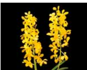
Mkra. Gloden Tommy 'Wong' Commercial Orchid Growers Association of Malaysia