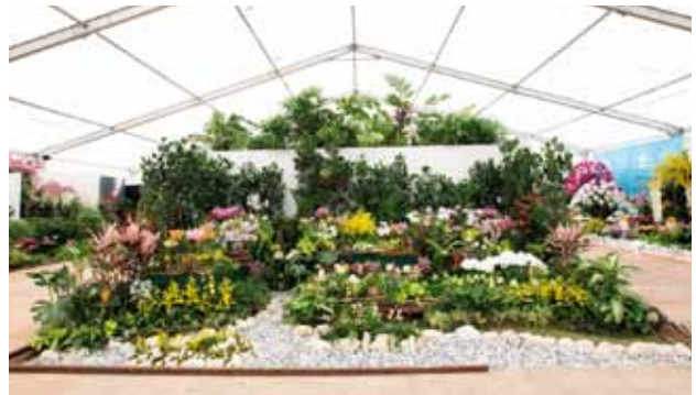
蘭と人…自然がつむぐ未来 Orchid and People.. Future Weaved by Nature

名古屋国際蘭展組織委員会 Nagoya International Orchid Show Organizing Committee 愛知県 Aichi, Japan