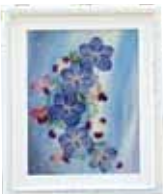
やすらぎ 屋宜 富士子