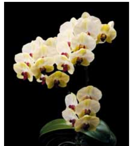
Phal. Mei Dar Green 'MD' 平地 正三 Seizo Hirachi 沖縄県 石垣市 Okinawa, Japan