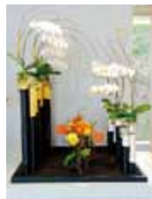
親和の心 洲鎌 広明