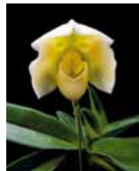
Paph. Mishima Silk 'Freedom' 渡辺 和俊 Kazutoshi Watanabe