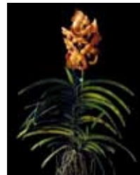
Ascda. (Thonglorsand x Suksomran Gold) 'Keesanga' Wuttiphan Keesanga