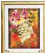
メルヘン 伊野波 常子