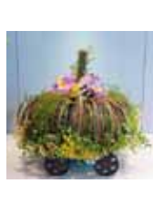
シンデレラ物語 外間 有香