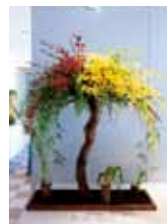
あふれる希望 仲嶺 朝陽