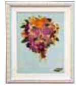
思い出 岸本 米子