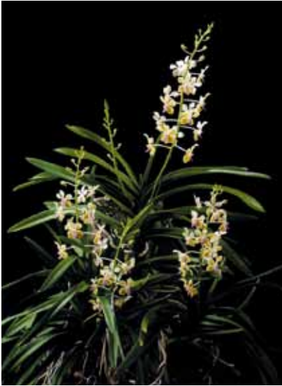
V. lamellata 'Miyara NO.1'

Chairman of Asia Pacific Orchid Conference in Okinawa Executive Committee Award