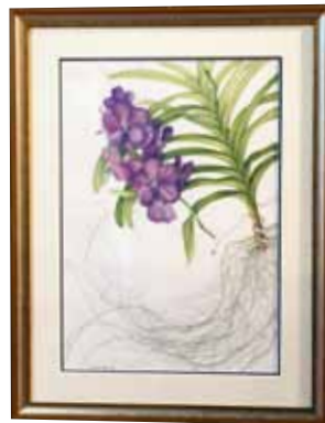
ポタニカルアート Botanical Art