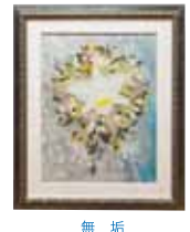
無 垢 平良 幸子