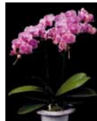
Phal. Tiannong Golden Vivien 'San San' (有)座間洋らんセンター Zama Orchid Center Co., Ltd.