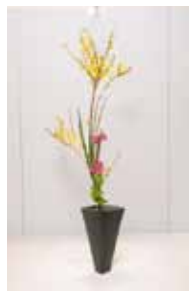
華道家元 池坊 金城 八重子