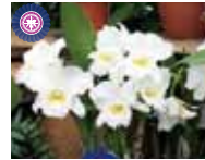
Rlc. Pastoral 'Innocence' 名波山 兼文