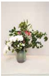
古流松藤会 長嶺 理絹