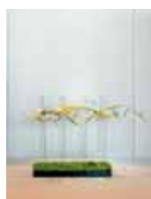
舞 主藤 正義