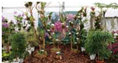
エクアドルのラン Ecuadorian Orchids