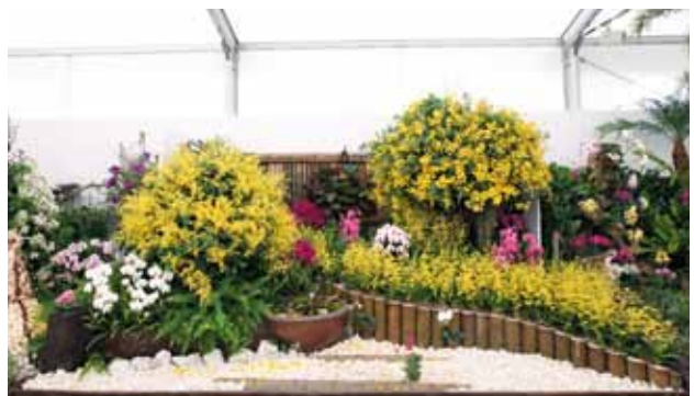
蘭 吹雪 Blizzard of Orchids

(有) 新垣洋らん園 Arakaki Orchid Nursery Co. 沖縄県 Okinawa, Japan