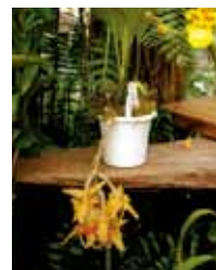
Stan. embreei 'GiGi' Ecuagenera