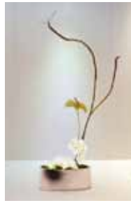
専心池坊 古賀 春風