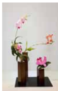
嵯峨御流 大城 文甫