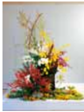
change the moment Teo Keng Seng