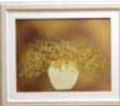
白の花瓶 ロング 清美