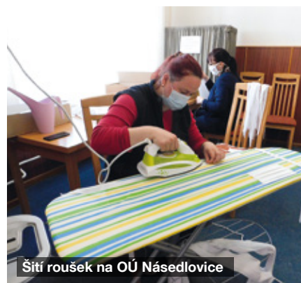
Šití roušek na OÚ Násedlovice

Nouzový stav trval do 17. května. Potom přišlo pomalé rozvolňování.