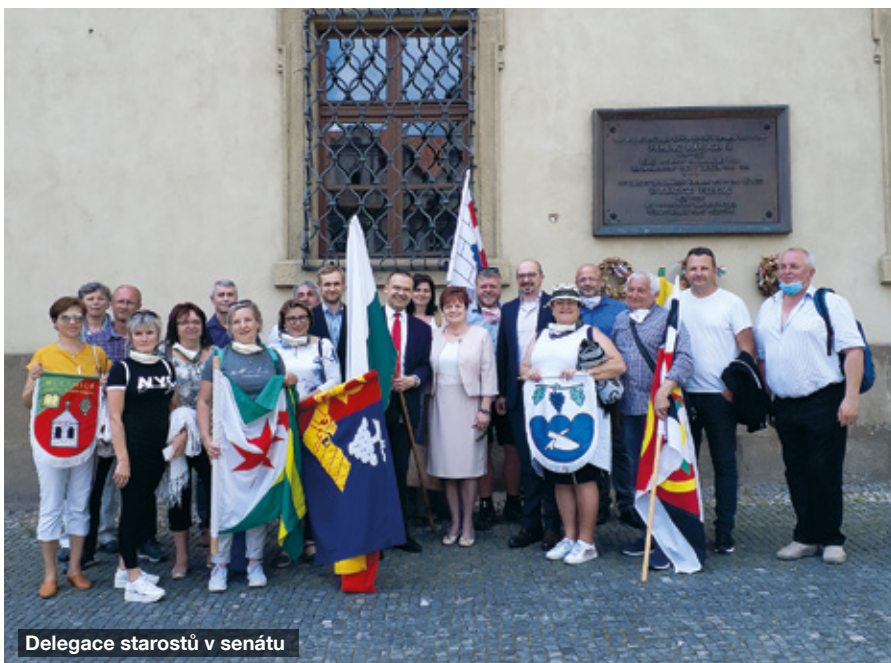
Delegace starostů v senátu