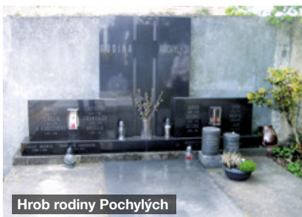
Hrob rodiny Pochylých