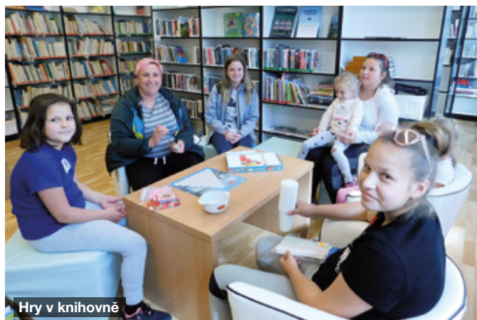
Hry v knihovně