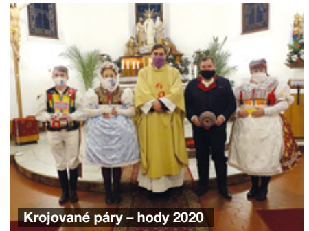
Krojované páry – hody 2020

Chasa z Násedlovic prezentovala naši obec i 8. února na plesu Mikroregionu Žďánicko v Archlebově. Zde byla opět předtančena Česká beseda.