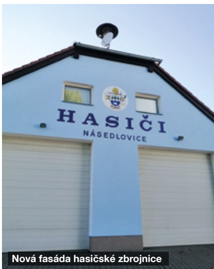
Nová fasáda hasičské zbrojnice