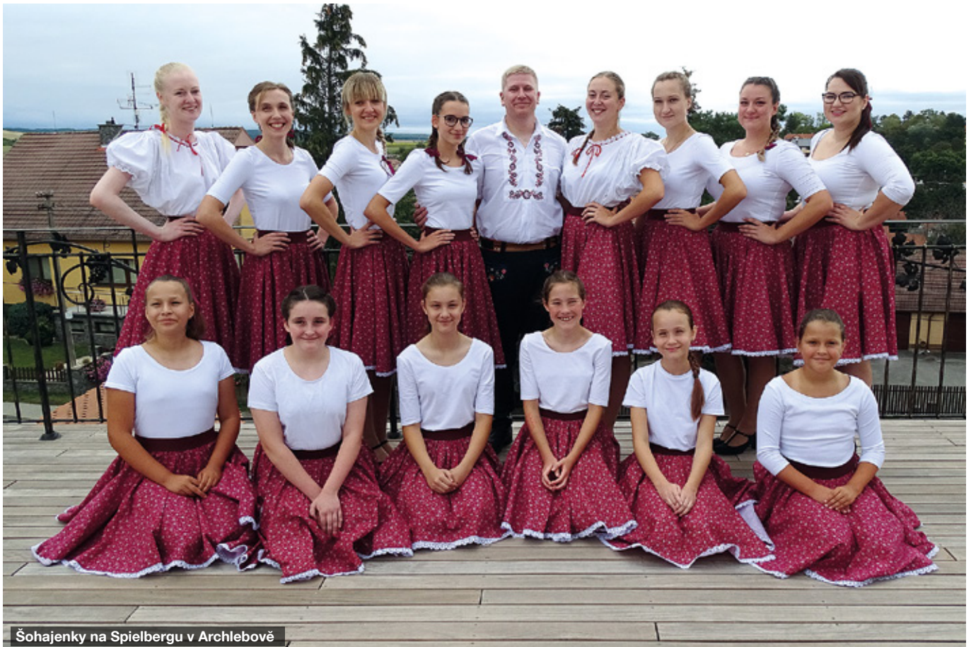
Šohajenky na Spielbergu v Archlebově