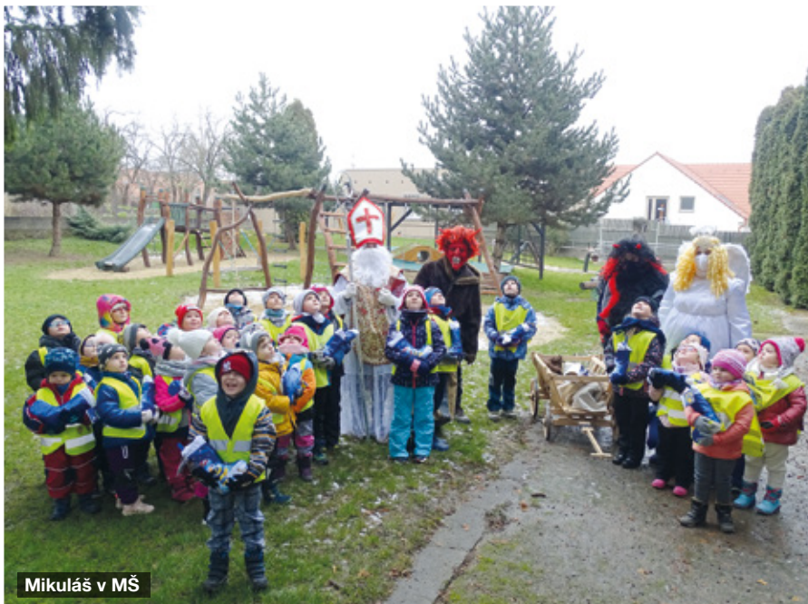
Mikuláš v MŠ

pro děti od 8 do 12 let. Otázky byly z různých oblastí. Největší zastoupení měly pohádky, ale nechyběl ani kousek zeměpisu, přírodopisu a matematiky. Přes počáteční obavy se kvízu zúčastnily nakonec čtyři soutěžící týmy. U některých, zejména pohádkových otázek, se zapotili nejvíce přihlízející dospěláci. Všichni soutěžící dostali sladkou odměnu a na závěr pohádkového odpoledne si opekli špekáčky u táboráku a spolu s rodiči si zahráli připravené stolní hry. A již nyní se všichni těší na další kolo dětského kvízu.