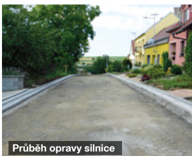
Průběh opravy silnice