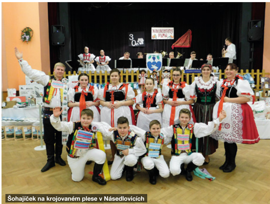
Šohajíček na krojovaném plese v Násedlovicích

V letošním roce jsme se ale činili i jinak. Stihli jsme pár vystoupení, a to Krojovaný ples v Násedlovicích a Dětský ples v Žaro-