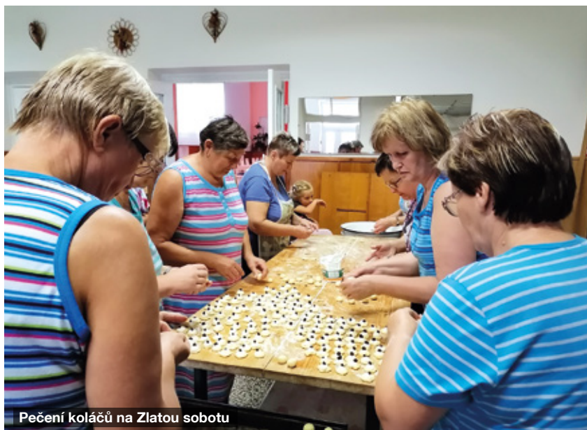
Pečení koláčů na Zlatou sobotu