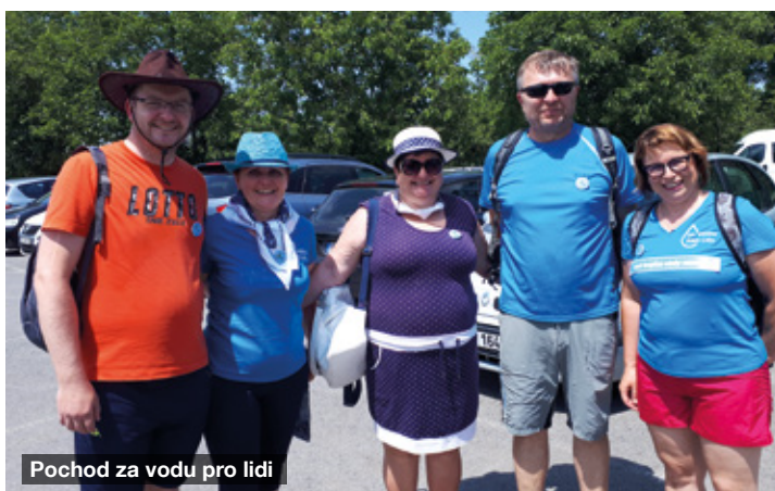
Pochod za vodu pro lidi

Ve stínu pandemie ovšem kauzy i projekty pokračují dál. Pro náš region nejdůležitější kauza, ochrana zdroje pitné vody a těžba šterkopísků u Uherského Ostrohu, zaznamenala několik změn. Byly podány čtyři žaloby, na základě kterých soud zatím rozhodl o zrušení dobývacího prostoru a báňský úřad musí celou věc znovu pro-