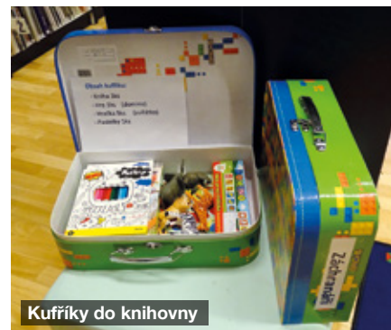
Kuffíky do knihovny

Samozřejmě jsme neprodali všechny staré knížky. Některé jsou umístěny v policích v přízemí budovy Obecního úřadu. Pokud vás nějaká kniha zaujme, můžete si ji půjčit a přečíst. V archivu pak máme na tři tisícovky titulů, které se snažíme prodávat na internetu a ze získaných peněz naku-