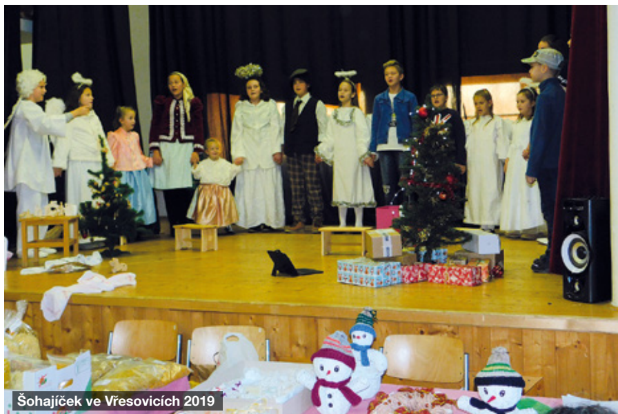
Šohajíček ve Vřesovicích 2019