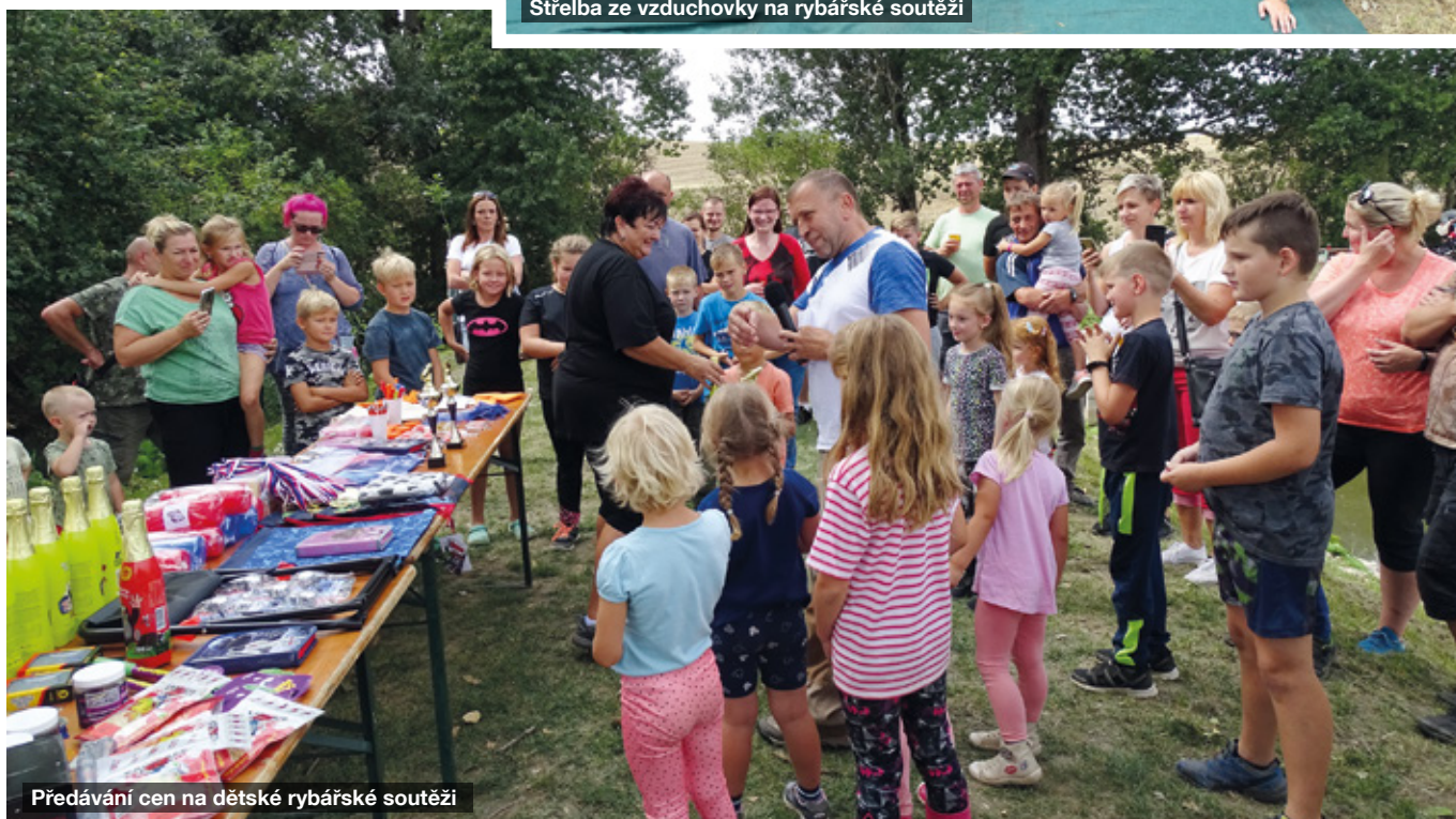
Předávání cen na dětské rybářské soutěži