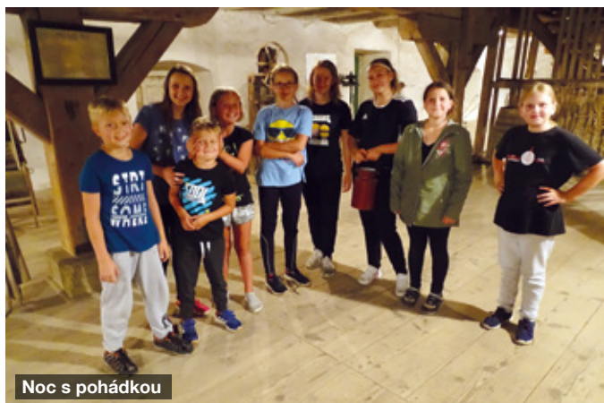
Noc s pohádkou