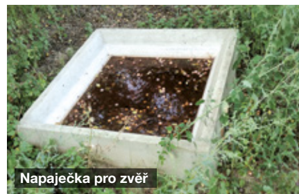
Napaječka pro zvěř

Letošní pandemie zasáhla do činnosti i využití budovy, a tak jsme měli čas na plánované změny a rekonstrukce. Opravy začaly v devadesátých letech minulého století