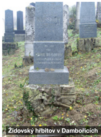
Židovský hřbitov v Damborčicích