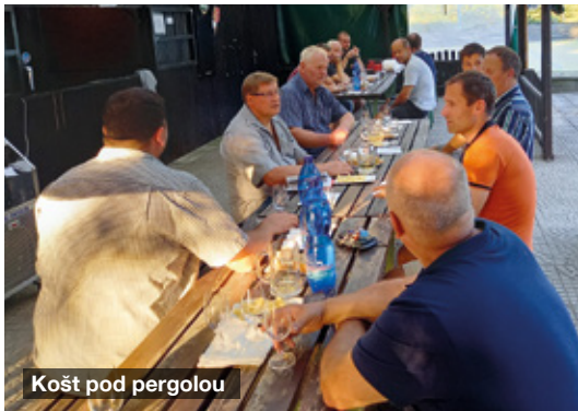
Košť pod pergolou

stace je návštěvníkům k dispozici sommelier, který podává na požádání informace o víně a jednotlivých vinařstvích. Na závěr exkurze do Valtic byla připravena skvělá společná večeře. V měsíci březnu byly naplánovány místní výstavy vín a jejich degustace. Z důvodu vyhlášení nouzového stavu covid-19 jsme stihli dodat vzorky vín pouze na místní výstavu do Čejče. Všechny další výstavy vín byly zrušeny. Po uvolnění nouzového stavu