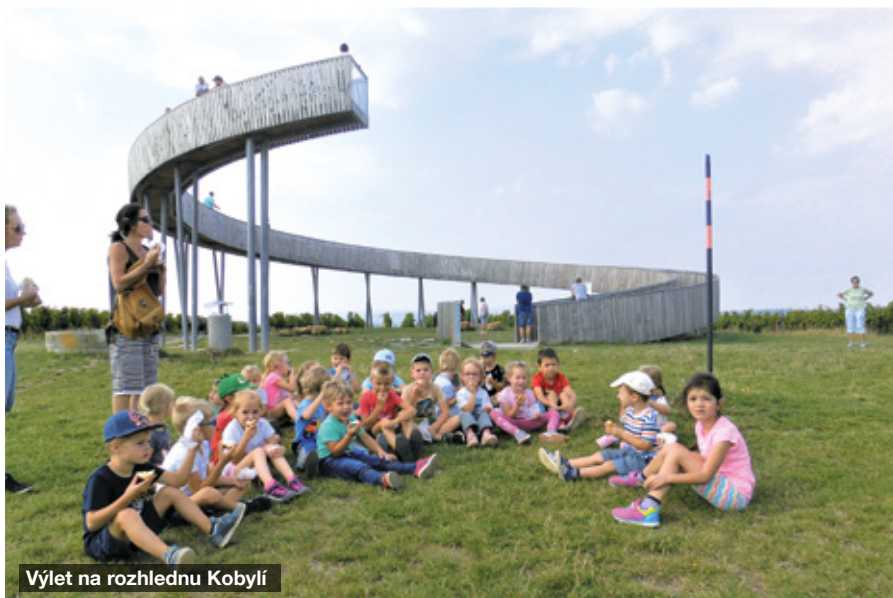
Výlet na rozhlednu Kobylí