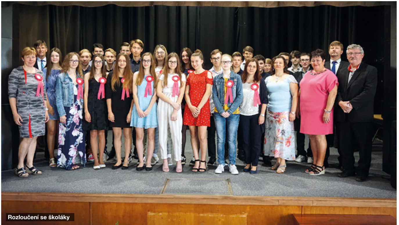
Rozloučení se školáky