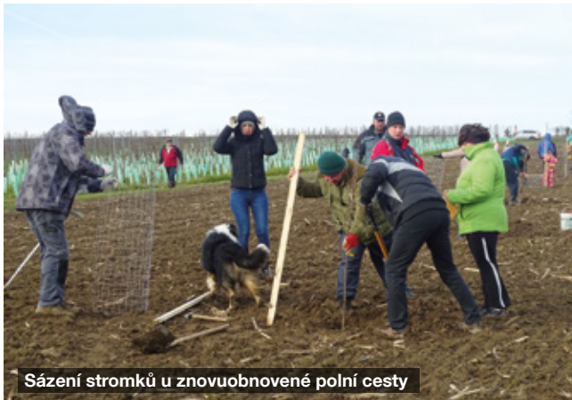
Sázení stromků u znovuoobnovené polní cesty