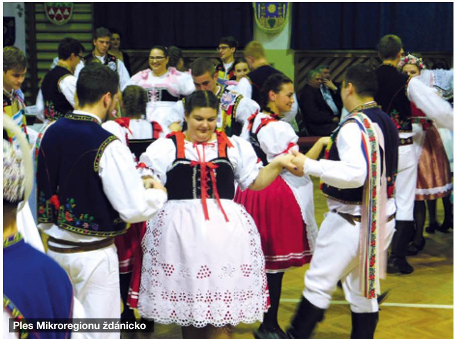
Ples Mikroregionu žďánicko

Jubilejní 30. krojovaný ples se konal 18. ledna. Českou besedu zatančilo šest kolonek – chasa ze Želetic, chasa ze Žarošic, chasa z Dražůvek, chasa z Archlebova, chasa z Násedlovic a starší děti z dětského folklorního souboru Šohajíček. K tanci a poslechu hrála dechová hudba Svatobořáci.