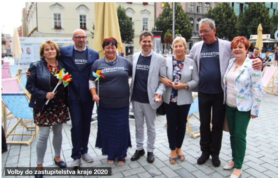
Volby do zastupitelstva kraje 2020

obdrželi. Bylo opraveno venkovní podium za kulturním domem, nechali jsme vymalovat kabiny TJ Moravia. Hasičská zbrojnice byla rovněž vymalována, natřela se okna a byla obnovena fasáda včetně znaku a nového nápisu. Byly pořízeny nové vývěsní tabule k zastávkám pro informace našich spolků. V obci je nově k dispozici asi 20 laviček u dětských hřišť, obchodu, kostela, modlitebny, hřbitovů. Byla opravena střecha kapličky sv. Jana Nepomuckého, také se podařila opravit plocha před evangelickým hřbitovem. Do naší obce byl pořízen nový bezdrátový rozhlas a meteostanice. Do zasedací místnosti jsme pořídili nový vyšíváný znak obce a státní prapor. Pracovnice obce pere prádlo nejen pro obec, ale i pro naši mateřskou školu a bylo potřeba zakoupit novou pračku i sušičku. V kuchyni na kulturním domě vypověděl bojler, museli jsme urgentně pořídit nový. Společně se Základní organizací Českého svazu včelařů jsme obdrželi dotaci na výsadbu ovocných stromků. V sobotu 5. 12. bylo vysazeno 30 stromků, tentokrát podél znovuobnovené polní cesty za rybníkem směrem k vinohradům. Sazení se konalo ve spolupráci s ro-