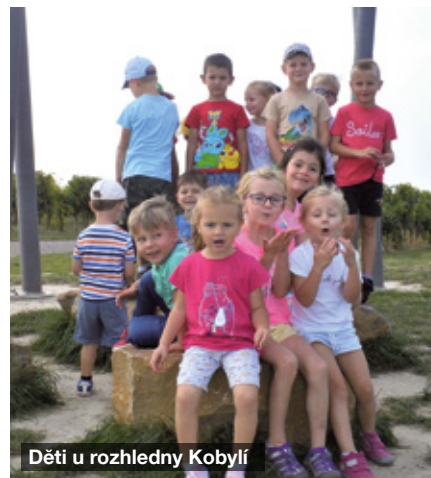
Děti u rozhledny Kobylí