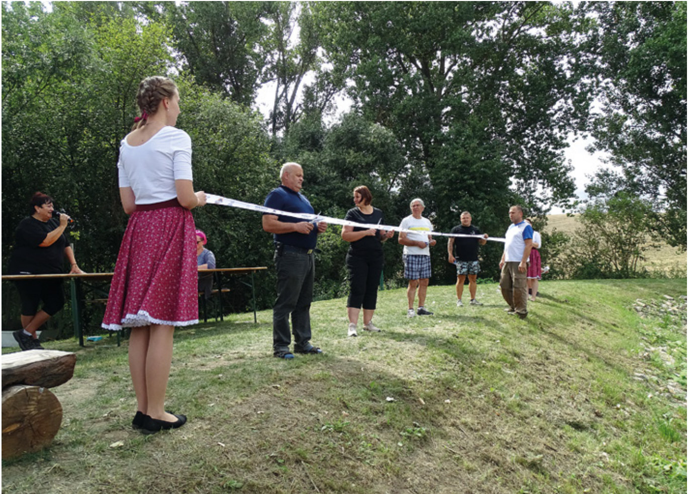
Slavnostní přestřižení pásky na rybníku