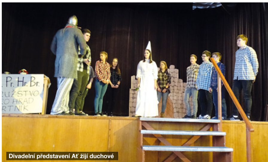
Divadelní představení Ať žijí duchové

V historických prostorách panské sýpky 4. července 2020 proběhlo nulté kolo dětského kvízu. Jednalo se o zkušební kolo. Chtěli jsme zjistit, jestli děti o tuto formu soutěžení budou mít zájem. Kvíz byl určen