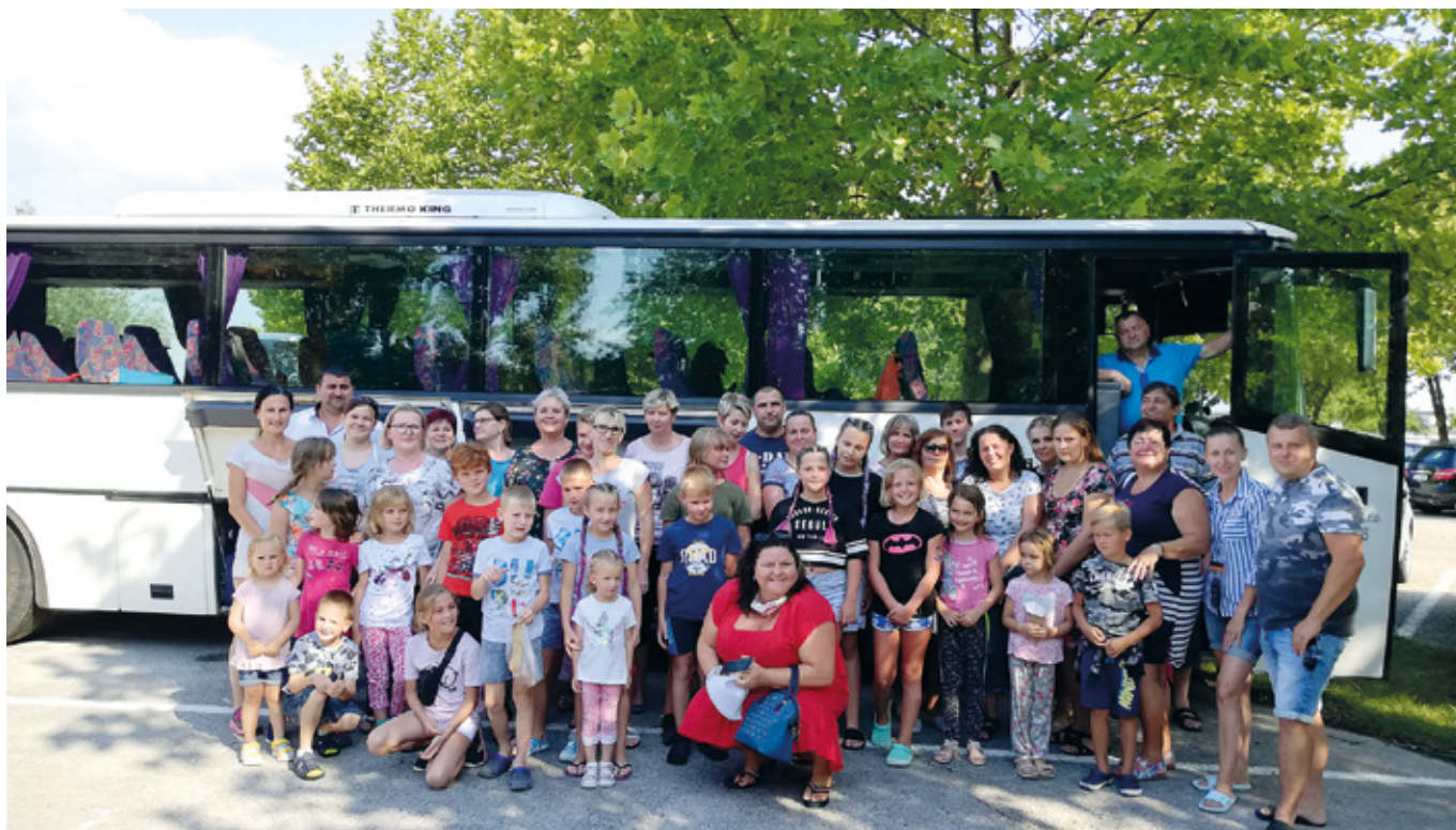
Zájezd rodičů s dětmi Velký Meder

Přípravu tradičních krojovaných hodů nám překazila nastupující druhá vlna pandemie COVID-19 a s tím opětovně vyhlášení nouzového stavu od 5. října 2020.