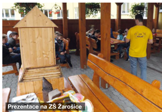
Prezentace na ZŠ Žarošice

sedlovice, kde výuka ve Včelařském domě probíhá. Výsadba medonosných stromků proběhla také v obcích Žarošice a Uhřice, na jejichž katastrech působí ZO ČSV Žarošice. Zbytek podzimu a zimu jsme s dětmi strávili ve Včelařském domě opakováním a prohlubováním teoretických znalostí,