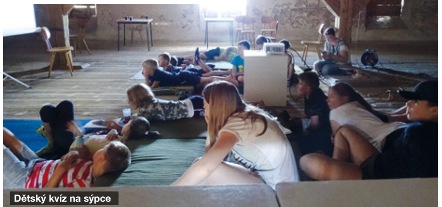
Dětský kvíz na sýpce

pro děti od 8 do 12 let. Otázky byly z různých oblastí. Největší zastoupení měly pohádky, ale nechyběl ani kousek zeměpisu, přírodopisu a matematiky. Přes počáteční obavy se kvízu zúčastnily nakonec čtyři soutěžící týmy. U některých, zejména pohádkových otázek, se zapotili nejvíce přihlízející dospěláci. Všichni soutěžící dostali sladkou odměnu a na závěr pohádkového odpoledne si opekli špekáčky u táboráku a spolu s rodiči si zahráli připravené stolní hry. A již nyní se všichni těší na další kolo dětského kvízu.