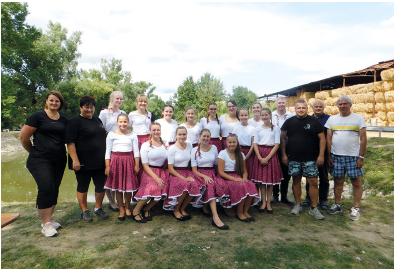
Zastupitelé obce s pěveckým sborem Šohajenky