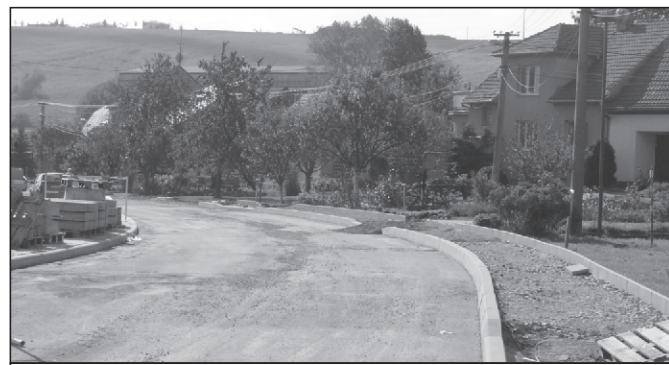
V druhé polovině roku 2010 byla zahájena stavba „Rekonstrukce komunikace pod hájenkou“ za 3 846 327,- Kč. Dále se zahajuje stavba Plocha pro recyklaci stavební suti v Janovém Dvoře s ukončením do konce listopadu. Na tuto akci byla schválena dotace z Operačního fondu životního prostředí a Evropské unie. Ta bude tvořit podstatnou část nákladů, které jsou po výběrovém řízení ve výši 9,5 mil. Kč. V letních měsících byla provedena výměna oken ve škole s nákladem 171 762,- Kč a rekonstrukce dětského hřiště za školou ve výši 200 837,- Kč.