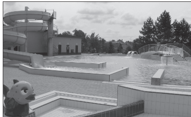
V roce 2008 až 2009 byla největší investiční akcí výstavba koupaliště za 41 242 475,- Kč. V dalších akcích byly vybudovány inženýrské sítě pro stavbu rodinných domů ve Veselé za 3 512 421,- Kč a inženýrské sítě pro stavbu rodinných domů na Žabáku v celk. výši 3 993 687,- Kč.

Také podpora společenské a kulturní činnosti organizací v obci je důležitá pro zapojení hlavně mládeže do společenského života. Je snaha udržet tradice a zvyklosti, pokračovat a ctít to, co naši předchůdci buďovali. Proto se také