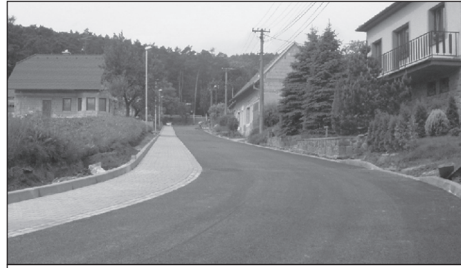
V roce 2006 až 2007 proběhla rekonstrukce komunikace od zrcadla po fotbalové hřiště. Celková částka za provedené opravy včetně nové kanalizace a veřejného osvětlení byla 14 086 421,- Kč.