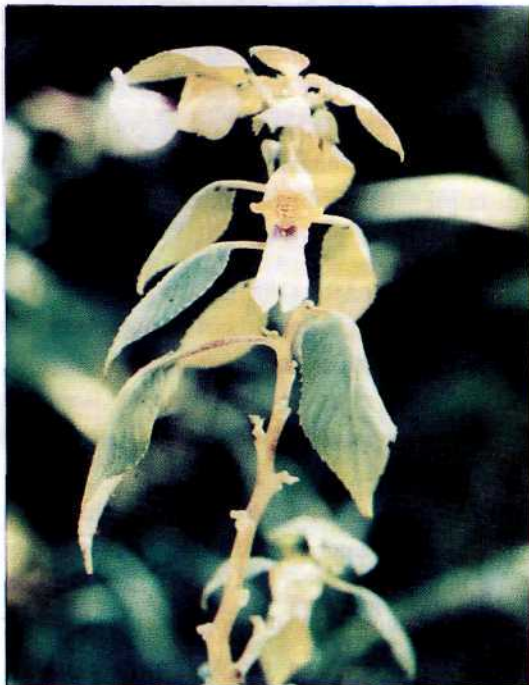
Gambar 1. Wujud morfologis I. arriensii (Zoll.) T. Shimizu

Berdasarkan karakter ini maka mereka memindahkan marga Semeiocardium ke dalam marga Impatiens . Pendapat ini diperkuat juga oleh