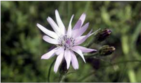
Die Violette Schwarzwurzel ( Scorzonera purpurea) kommt in Sachsen-Anhalt nur noch auf wenigen kontinentalen Kalktrockenrasen vor. Nebra, 28.4.2009