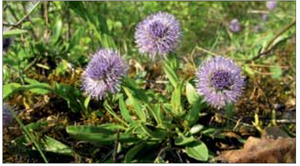
Im Saaletal sind die nördlichsten Vorkommen der Kugelblume ( Globularia bisnagarica) in Deutschland. Köllme, 24.4.2009