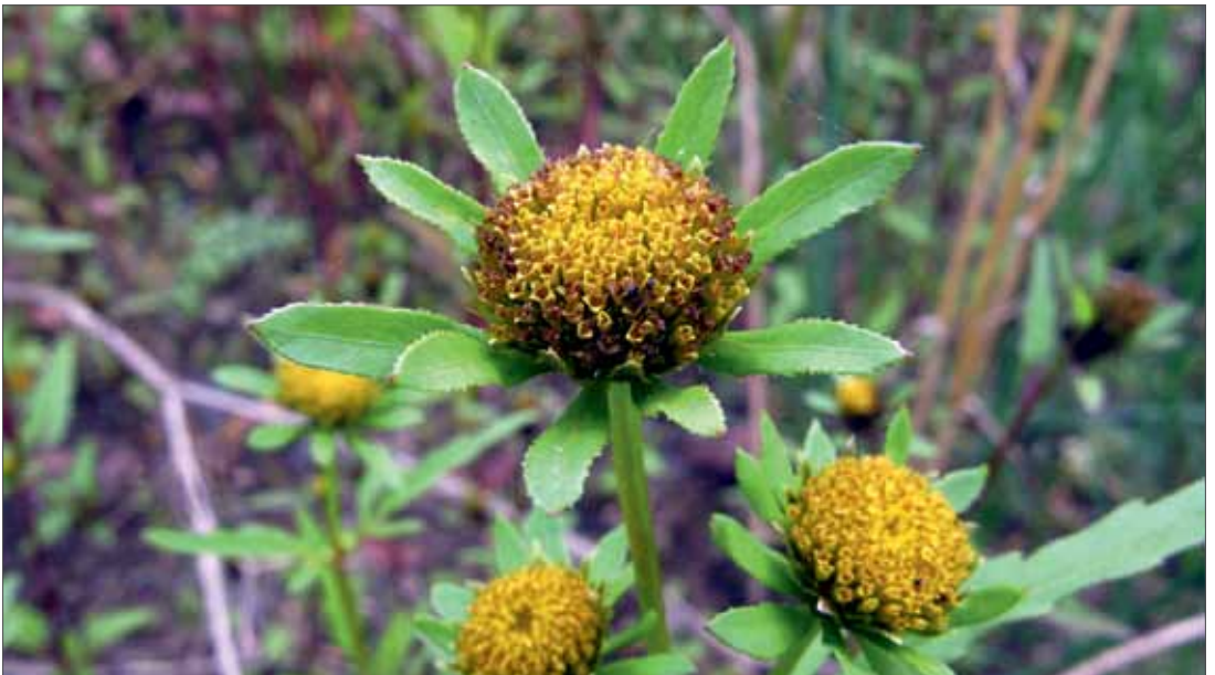
Der Strahlige Zweizahn ( Bidens radiata ) ist eine Stromtalpflanze und kommt in Sachsen-Anhalt fast ausschließlich im Elbegebiet vor. Bleddin, 5.9.2012, Foto: D. Frank.