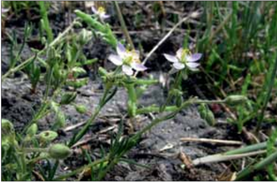
Auf den Salzstellen im Mitteldeutschen Trockengebiet ist die Flügel-samige Schuppenmiere ( Spargularia media) regelmäßig anzutreffen. Teutschenthal, 26.5.2012