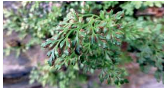
Die Mauerraute ( Asplenium ruta-muraria) war früher in Mauerfugen weit verbreitet. Nach Sanierungen findet die Art kaum noch Wuchsorte. Magdeburg, 12.9.2012