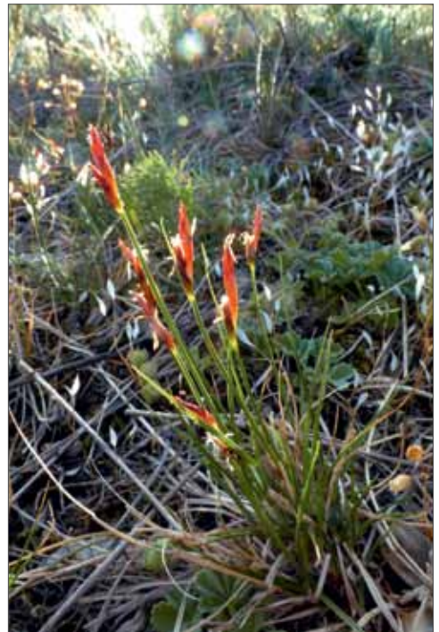
Eine Art der kontinentalen Steppenrasen ist die Niedrige Segge ( Carex supina ). Brachwitz, 1.5.2011, Foto: D. Frank.