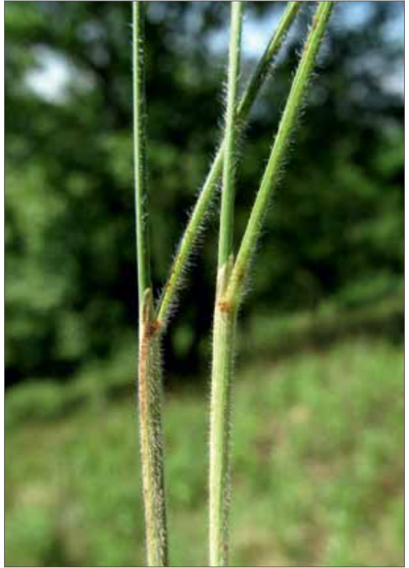
Vom Weichhaarigen Federgras ( Stipa dasyphylla) überdauert seit Jahrzehnten eine einzige Pflanze auf einem Trockenhang im Unstruttal. Es ist das einzige Vorkommen in Deutschland. Nebra, 24.5.2012