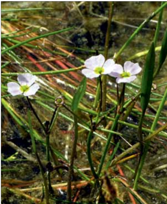
Seit der Schaffung geeigneter Biotopstrukturen im ehemaligen Grenzstreifen hat sich der schon verschollene Igelschlauch ( Baldellia ranunculoides) wieder angesiedelt. Hoyersburg, 20.6.2009