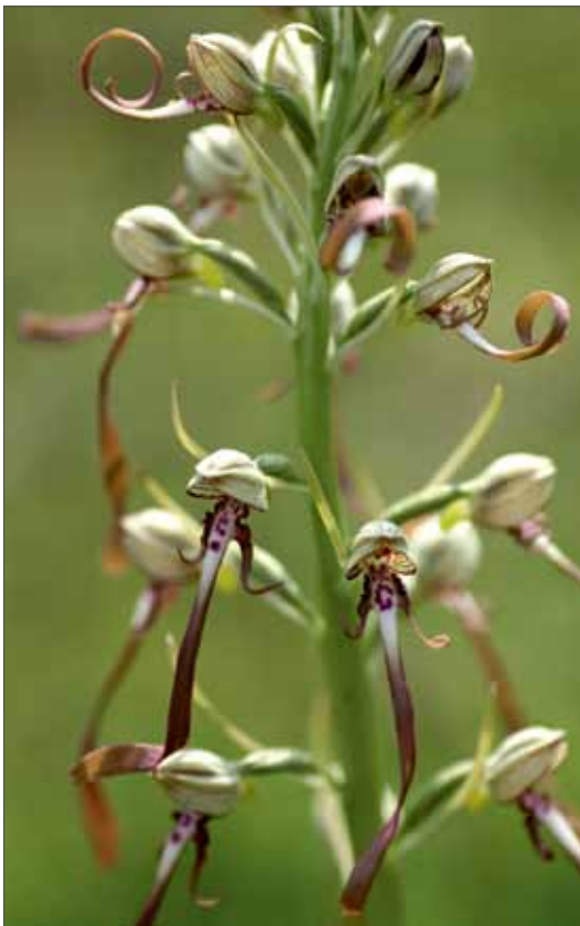
Die Bocks-Riemenzunge ( Himantoglossum hircinum) hat in den letzten zwei Jahrzehnten auch Populationen in ST begründet. Am Nordharzrand finden sich die nördlichsten Vorkommen Deutschlands. Ballenstedt, 12.6.2013