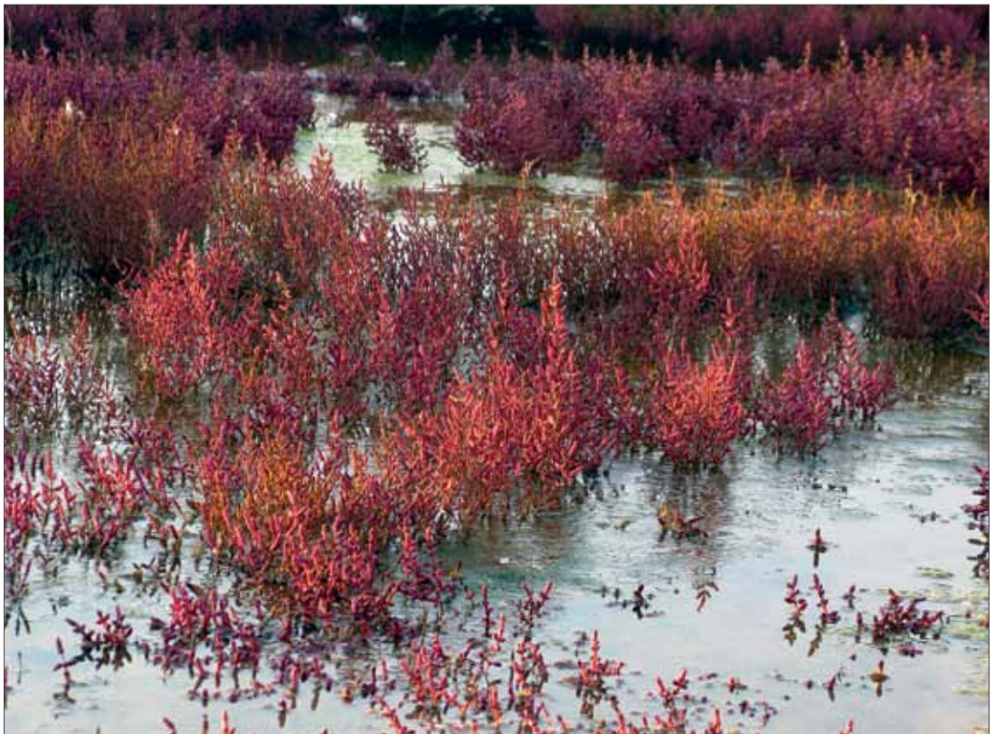
Der Kurzähren-Queller ( Salicornia europaea subsp. brachystachya) kommt sowohl an den naturnahen Salzstellen des Mitteldeutschen Trockengebiets als auch im Bereich der Abraumhalden des Salzbergbaus vor. Sülldorf, 8.10.2010