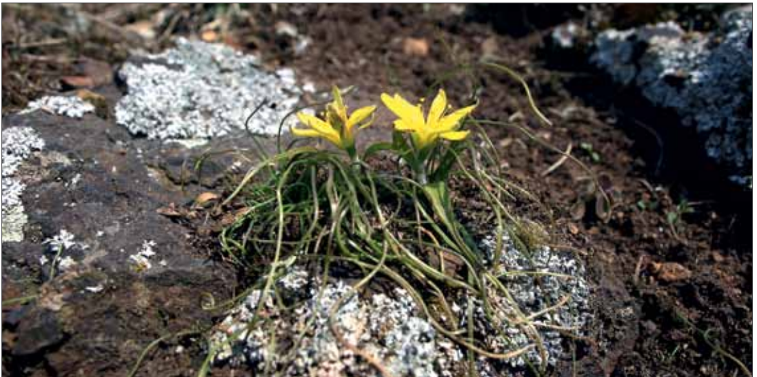
Auf flachgründigen Felshängen oder Kuppen ohne Gehölzdeckung im Mitteldeutschen Trockengebiet ist der Felsen-Goldstern ( Gagea bohemica ) eine der ersten blühenden Arten. Im vegetativen Zustand ähneln die Blätter denen von Gras-Arten. Rothenburg, 8.1.2014, Foto: D. Elias.