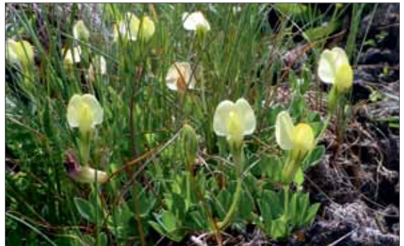
Die Gelbe Spargelerbse ( Lotus maritimus) besiedelt im Mitteldeutschen Trockengebiet quellige, oft salzbeeinflusste Wiesen. Teutschenthal, 26.5.2012