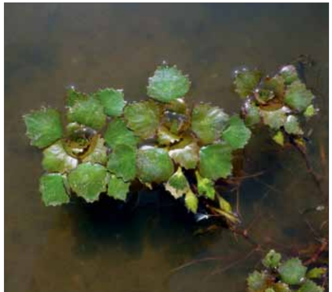
Die Wassernuss ( Trapa natans ) ist eine Stromtalpflanze, die in Altarmen und Tümpeln der Elbe um Dessau und Wittenberg anzutreffen ist. Die linke Abb. zeigt den namensgebenden Fruchtkörper in einer trockengefallenen Flutrinne. Bleddin, 5.5.2014, Fotos: D. Frank.