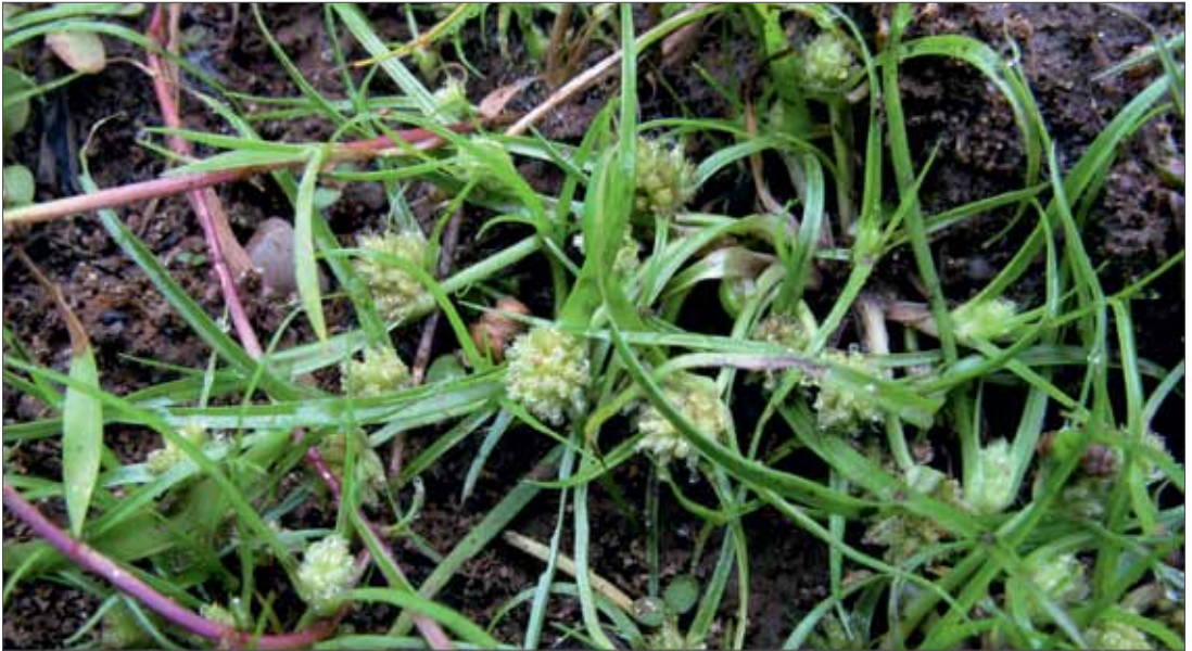
Das Zwerg-Zypergras ( Cyperus michelianus ) kommt in Deutschland fast ausschließlich auf Schlammfluren im Wittenberger Elbegebiet vor. Bleddin, 5.9.2012, Foto: D. Frank.