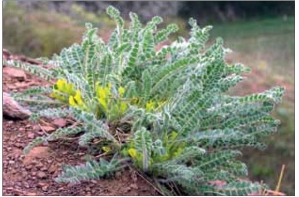
Der Stengellose Tragant ( Astragalus exscapus ) ist eine charakteristische Art der Steppenrasen des Mitteldeutschen Trockengebiets im Lee des Harzes. Nelben, 5.4.2014, Foto: M. Bulau.