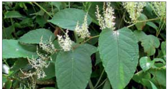
Der Bastard-Staudenknöterich ( Fallopia bohemica) ist in vielen Regionen Sachsens-Anhalts die häufigste Staudenknöterich-Art. Wülperode, 17.8.2012