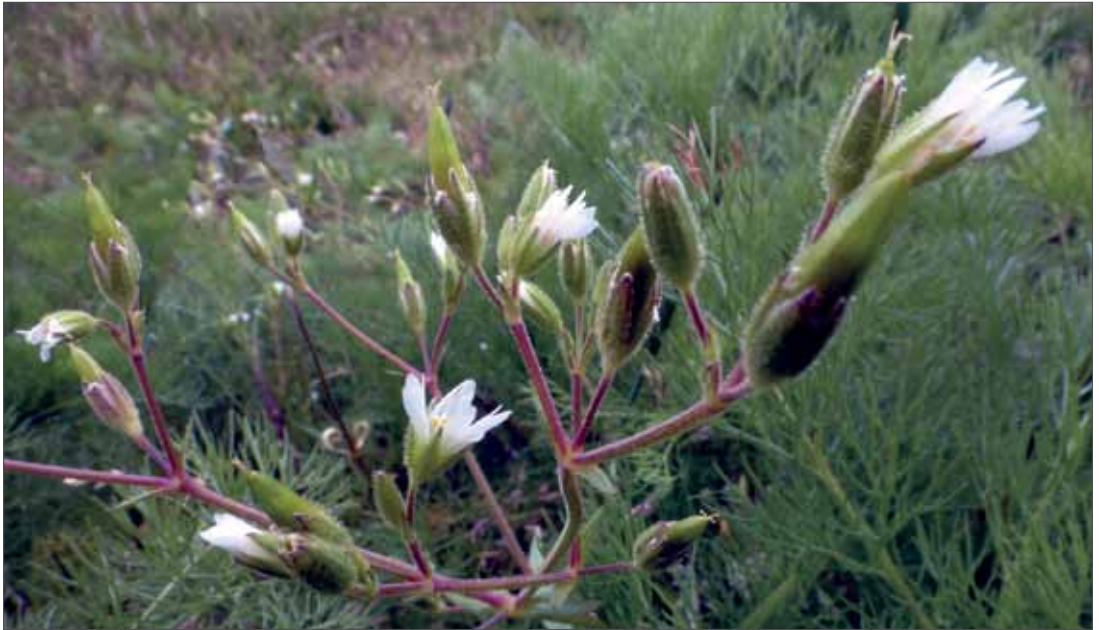
Das Klebrige Hornkraut ( Cerastium dubium ) ist eine Stromtalpflanze, die insbesondere entlang der Elbe zu finden ist. Bleddin, 5.5.2014, Foto: D. Frank.