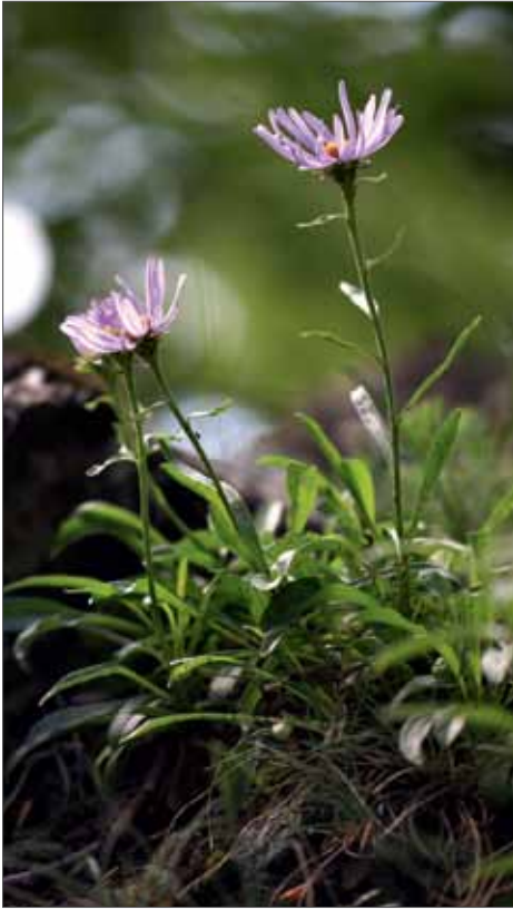
Das deutschlandweit nördlichste Vorkommen der Alpen-Aster ( Aster alpinus) befindet sich im Harz. Bodeltal, 10.6.2010