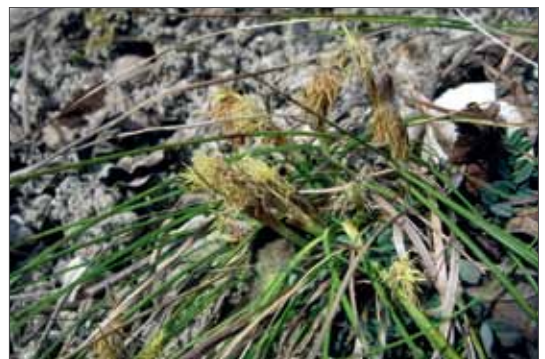
Die Erd-Segge ( Carex humilis), eine im Vorfrühling blühende charakteristische Art intensiv beweideter Trockenrasen, verschwindet oft nach Einstellung der Weidewirtschaft. Bad Kösen, 12.3.2011