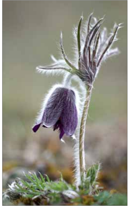
Die Wiesen-Kuhschelle ( Pulsatilla pratensis) kommt nur im Nordosten Deutschlands vor und besiedelt lichte Kiefern- oder Eichenwälder, deren Säume bzw. Trockenrasen. Nordharz, 20.4.2008