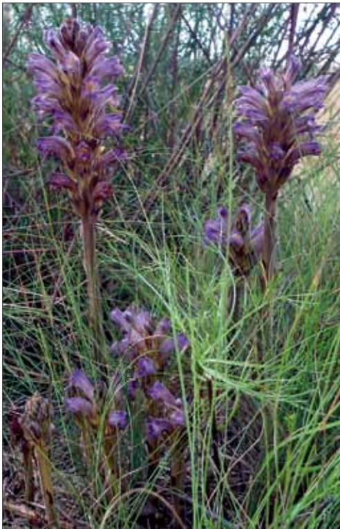
Die Böhmisches Sommerwurz ( Orobancha bohemica ) ist eine der in Deutschland seltensten Arten der allgemein stark gefährdeten Sommerwurzgewächse. Quedlinburg, 5.7.2013, Foto: N. Rußwurm.