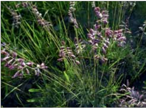
Der Zierliche Schwingel ( Festuca pulchra ) ist auf feinerdereichen Böden (oft Löss) im Mitteldeutschen Trockengebiet und im Elbtal anzutreffen. Pfützthal, 5.6.2013, Foto: D. Frank.