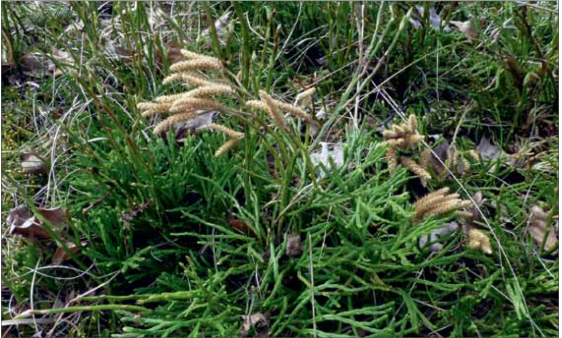
Zeillers Flachbärlapp ( Diphasiastrum zeileri ) kommt nur noch auf einer Sukzessionsfläche im Nationalpark Harz vor. 7.4.2014, Foto: D. Frank.