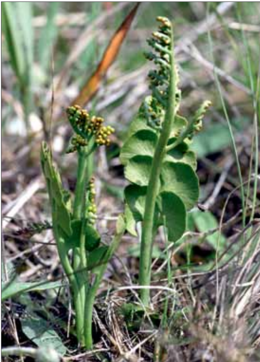
Durch Eutrophierung und Nutzungsintensivierung sind die meisten der ehemaligen Vorkommen der Echten Mondraute ( Botrychium lunaria) erloschen. Oranienbaumer Heide, 20.5.2009