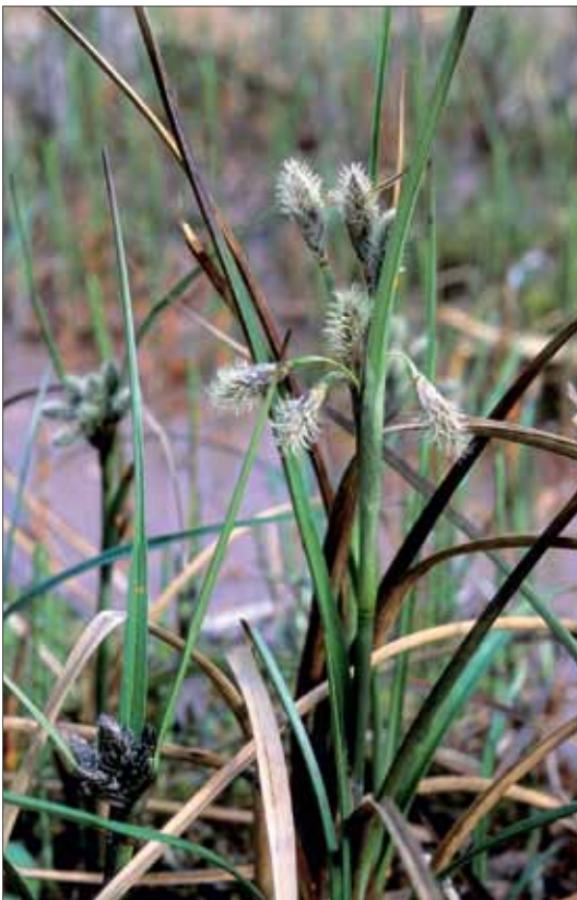
Das Schmalblättrige Wollgras ( Eriophorum angustifolium) ist durch Melioration und Flurbereinigung gefährdet. Bergwitz, 26.4.2013