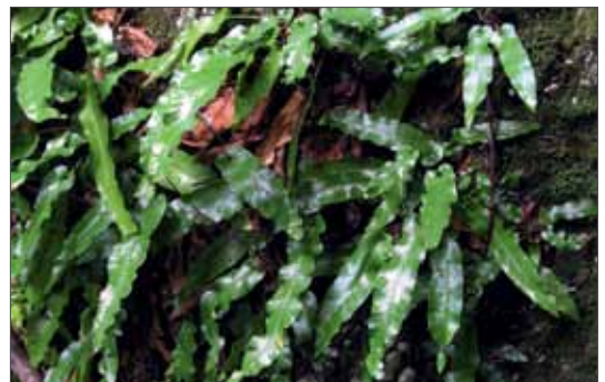
Die Hirschzunge ( Asplenium scolopendrium) erreicht in den wärmebegünstigten Schluchten des Südharzes ihre nordöstliche Verbreitungsgrenze. Sangerhausen, 13.9.2009