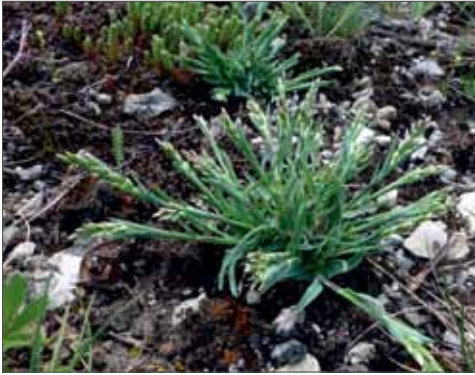
Auf flachgründigen Böden über basischem Gestein wächst das Badener Rispengras ( Poa badensis). Freyburg, 10.5.2013