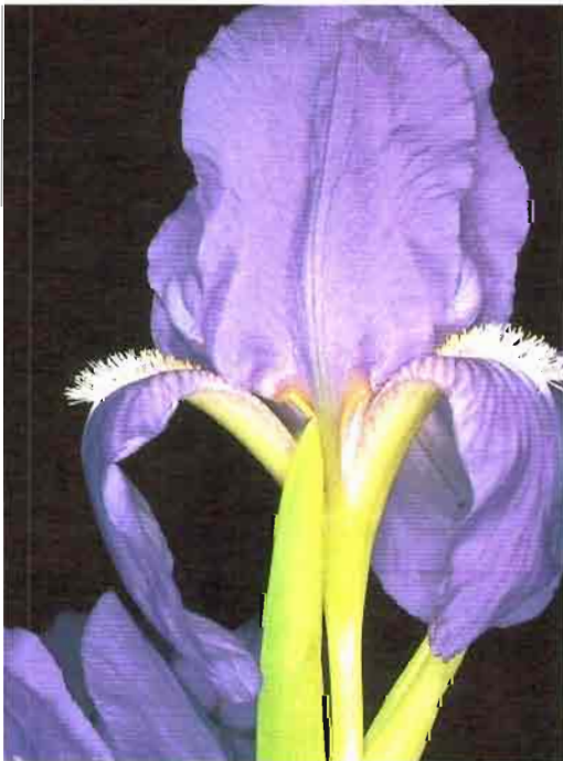
59. Iris subbiflora Brot.