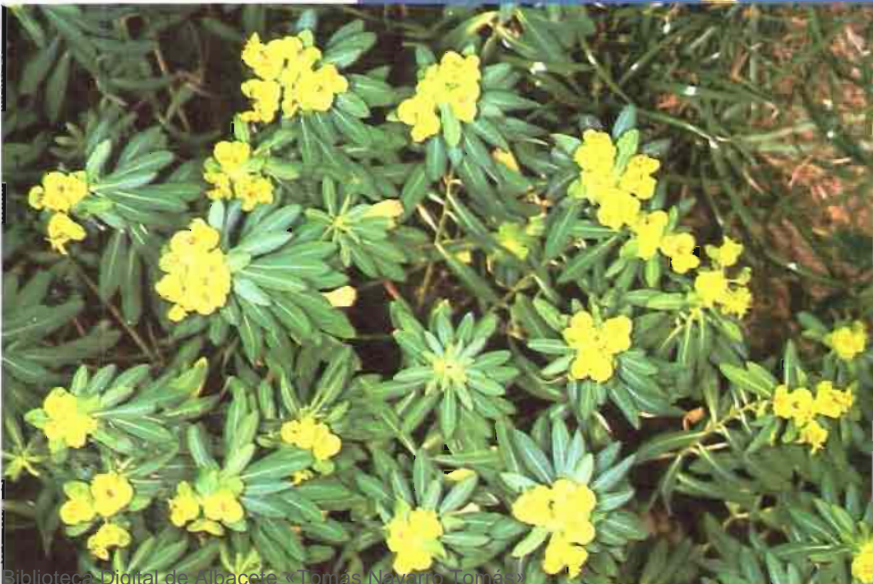
29. Euphorbia squamigera Loisel