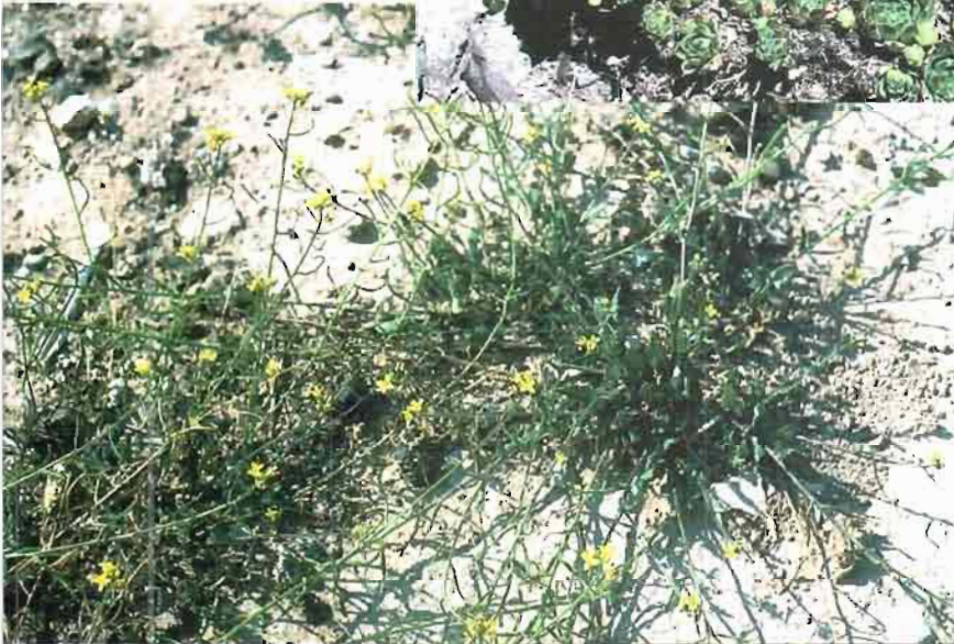
25. Lycocarpus fugax (Lag.) O.E. Schultz in Engl.