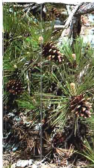
2. Pinus nigra Arnold subsp. mauretanica (Maire & Peyerimh.) Heywood