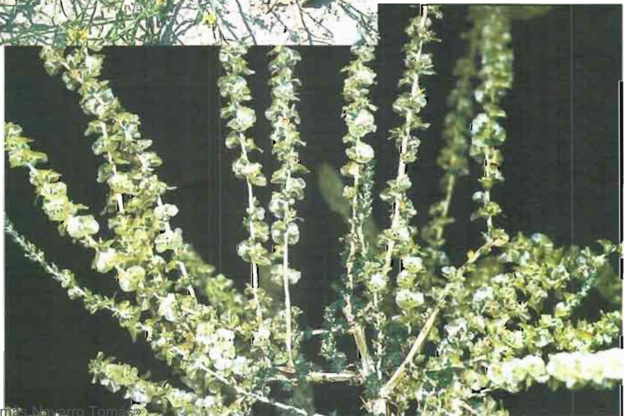
26. Salsola vermiculata L.