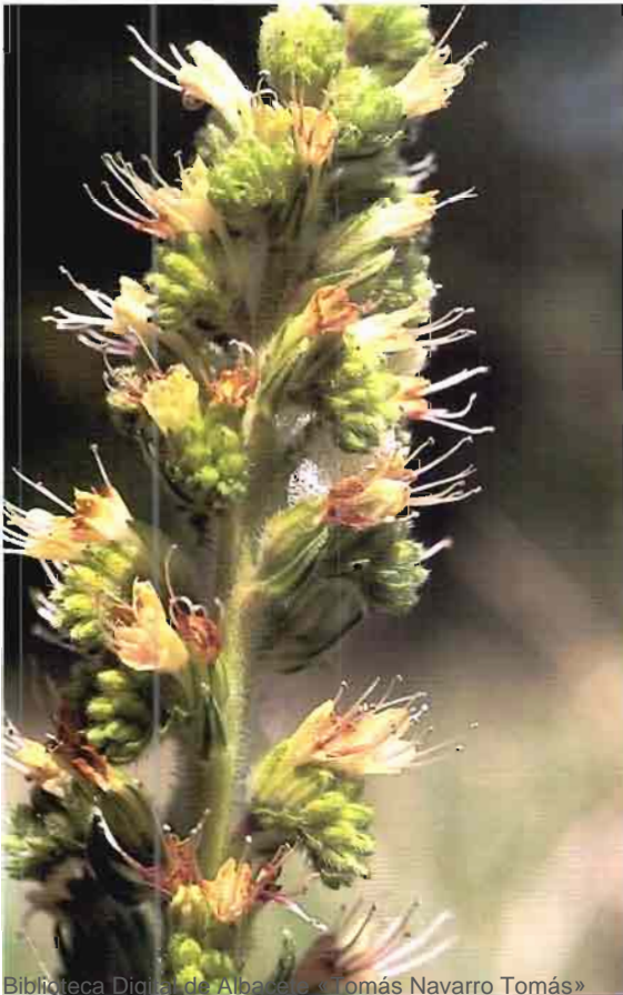
8. Echium flavum Desf.