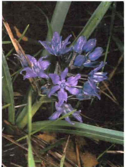
60. Scilla paui Lacaita