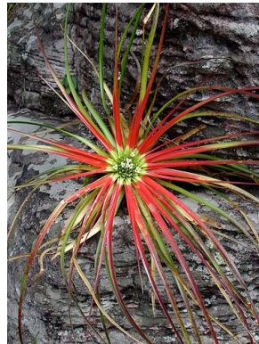
8 O. heleniceae