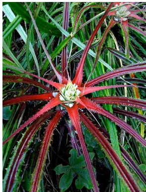
16 O. pseudovagans