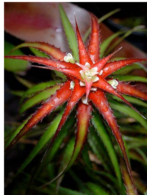
18 O. vagans