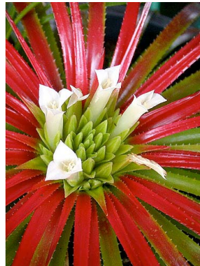
13 O. navioides