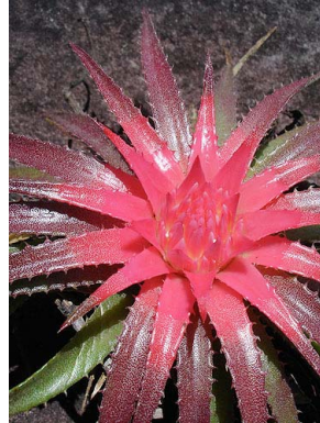
3 O. amoenum