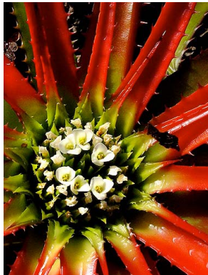
7 O. hatschbachii