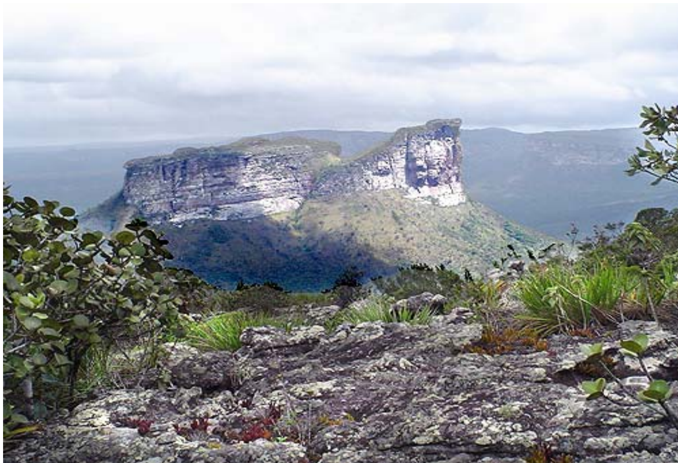
Morro do Camelo. Chapada Diamantina – BA. Espinhaço Range