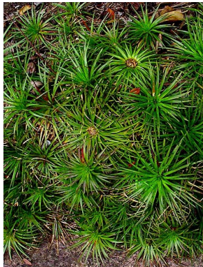
11 O. mucugense