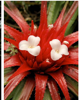
15 O. ophiuroides