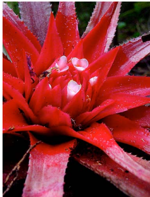
6 O. burle-marxii