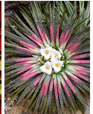
10 O. humile