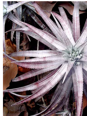
19 O. zanonii