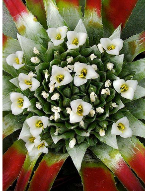
2 O. albopictum