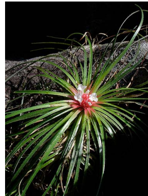
14 O. ophiuroides