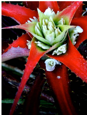
17 O. pseudovagans