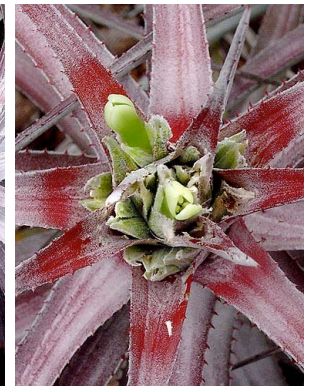
20 O. zanonii