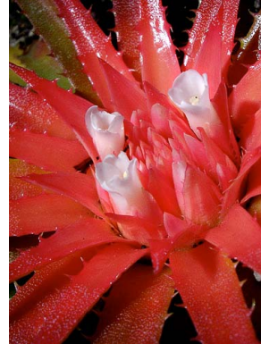
4 O. amoenum