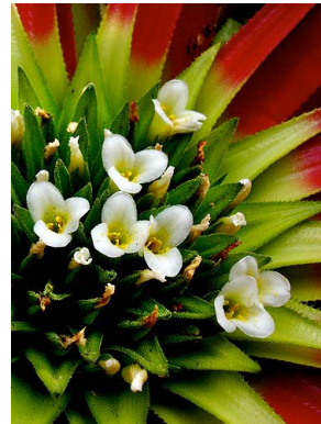
9 O. heleniceae