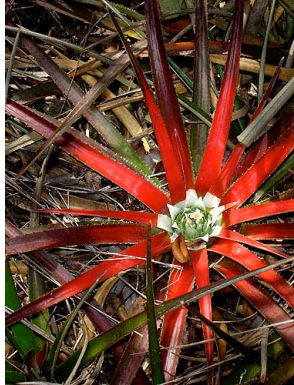
1 O. albopictum

[RRC@fmnh.org] [www.fmnh.org/plantguides/] Rapid Color Guide # 251 versão 1 03/2009