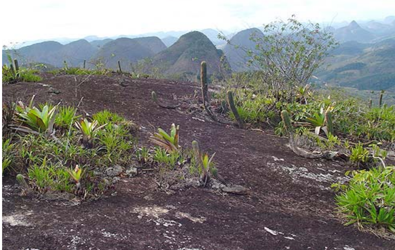
Pedra do Vidal. Pancas – ES. Inselbergs in Atlantic Rain Forest domain.