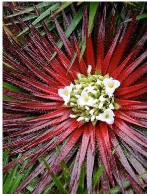
12 O. mucugense