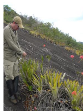
99 Estação Ecológica de Murici Alagoas - Brazil