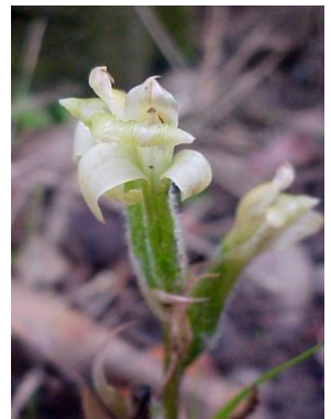
90 Sarcoglottis acaulis (Sm.) Schltr.