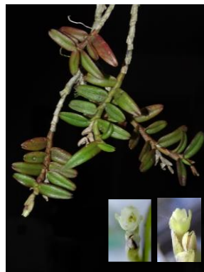
47 Epidendrum strobiliferum Rchb.f.