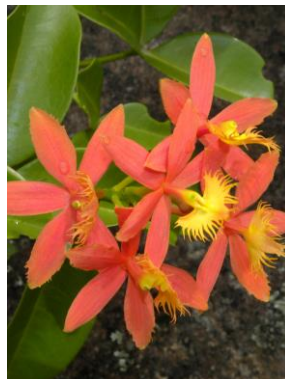
38 Epidendrum cinnabarinum Salzm.