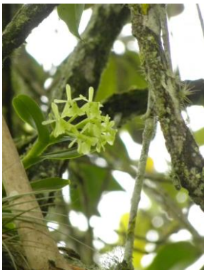
36 Epidendrum campaccii Hägsater & L.Sánchez