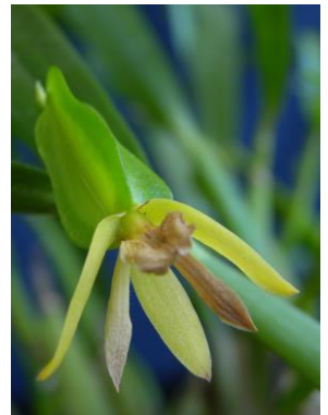
85 Prosthechea alagoensis (Pabst) W.E.Higgins (another color) (fruit)