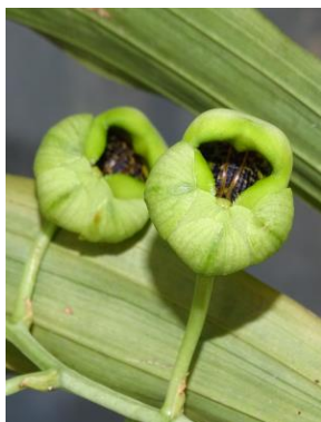
13 Catasetum hookeri Lindl. ♂ (another color)