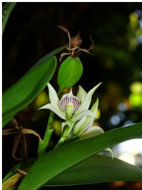
81 Prosthechea aemula (Lindl.) W.E.Higgins