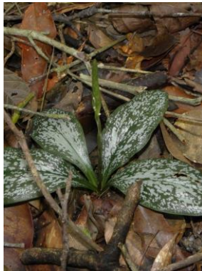
72 Mesadenella cuspidata (Lindl.) Garay