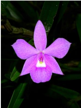
26 Dimerandra emarginata (G. Mey.) Hoehne