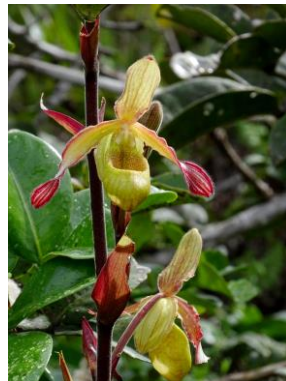
78 Phragmipedium sargentianum (Rolfe) Rolfe