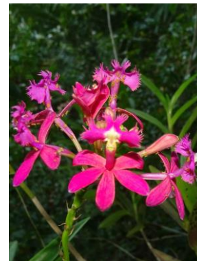
49 Epidendrum × sp. 2