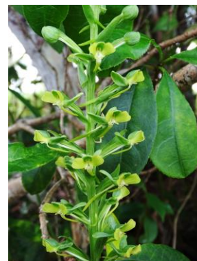
54 Habenaria petalodes Lindl.