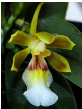
91 Trichocentrum fuscum Lindl.