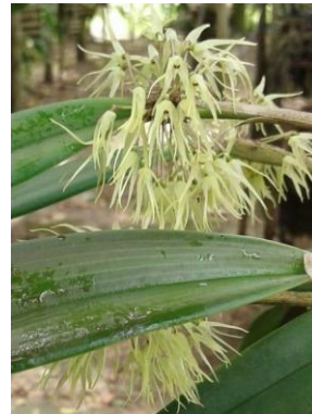
74 *Myoxanthus exasperatus (Lindl.) Luer