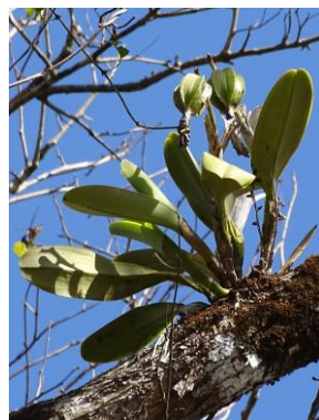
20 Cattleya labiata (fruit) Lindl.