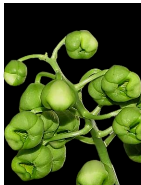
11 Catasetum hookeri Lindl. ♂