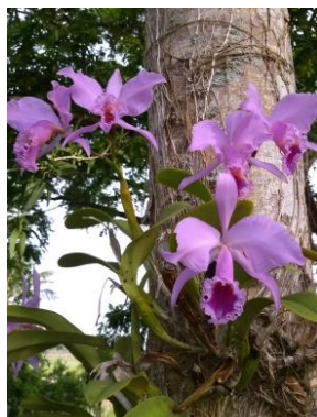
19 Cattleya labiata Lindl.