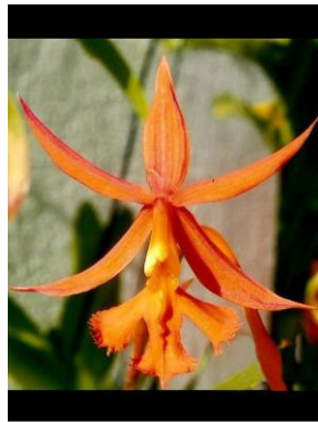
42 *Epidendrum macrocarpum Rich.