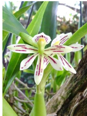
83 Prosthechea alagoensis (Pabst) W.E.Higgins