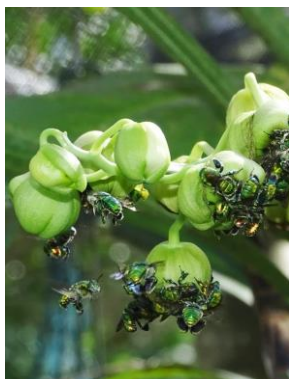
12 Catasetum hookeri Lindl. ♂ (pollinator Euglossa sp.)