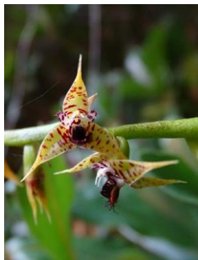
8 Bulbophyllum meridense Rchb.f.