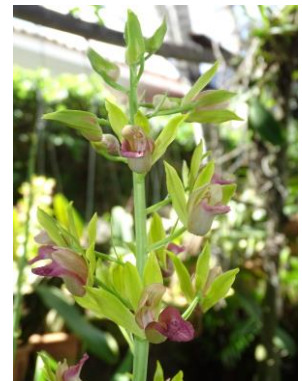
50 Eulophia alta (L.) Fawc. & Rendle