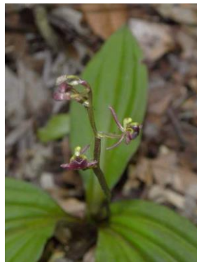
57 Liparis nervosa (Thunb.) Lindl.