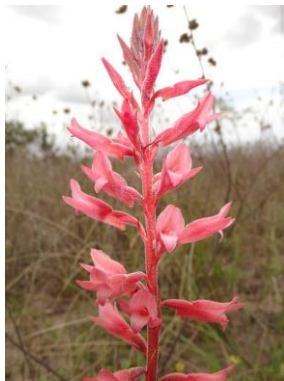
87 Sacoila lanceolata (Aubl.) Garay