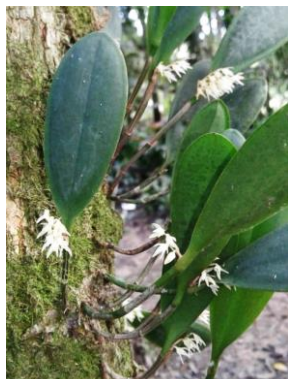
6 *Anathallis obovata (Lindl.) Pridgeon & M.W.Chase