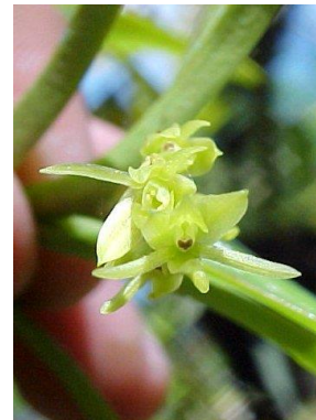
44 Epidendrum ramosum Jacq.