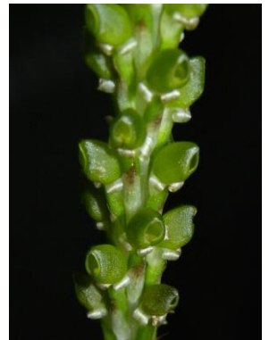
80 Prescottia stachyodes (Sw.) Lindl.