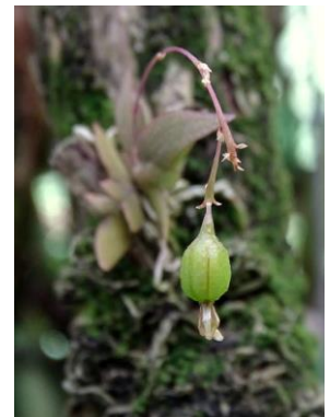
60 Macroclinium roseum (fruit) Barb.Rodr.