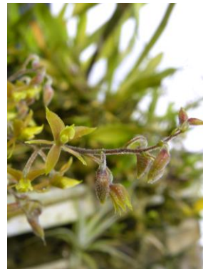
34 Epidendrum avicula Lindl.