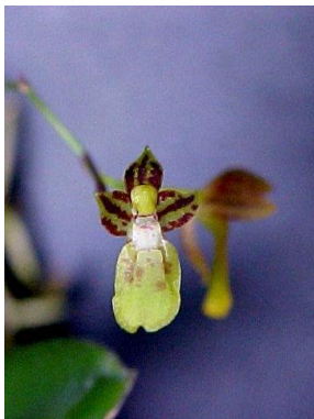
56 Leochilus labiatus (Sw.) Kuntze