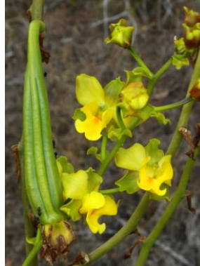
23 Cyrtopodium flavum (fruit) Link & Otto ex Rehb.