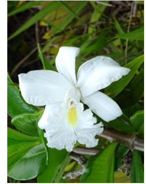
85 Sobralia liliastrum Lindl.