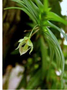
24 Dichaea panamensis Lindl.