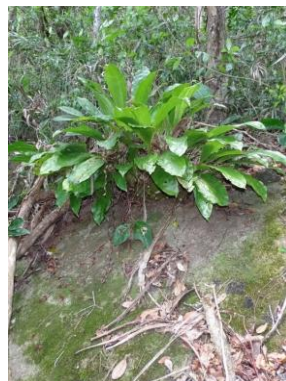
53 Gongora nigrita Lindl. (on rock)