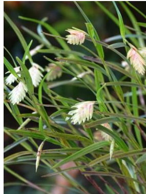
28 Elleanthus linifolius C. Presl