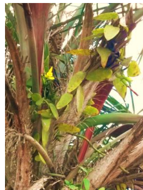
94 Vanilla palmarum (Salzm. ex Lindl.) Lindl.