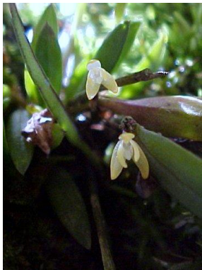
76 Octomeria exigua C.Schweinf.