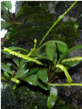
86 Stelis deregularis Barb.Rodr.