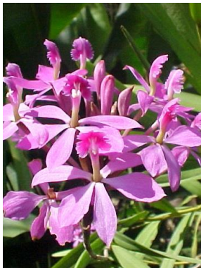
41 Epidendrum flexuosum G. Mey.