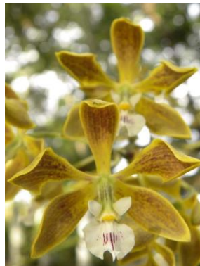
33 Encyclia oncidoides (Lindl.) Schltr.