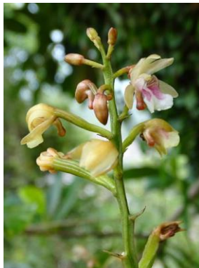
77 Oeoclaudes maculata (Lindl.) Lindl. (flowers and fruits)