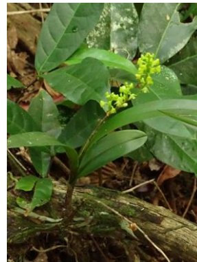
79 Polystachya concreta (Jacq.) Garay & H.R.Sweet