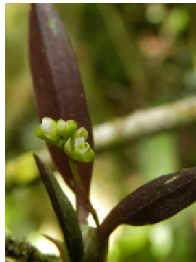
88 Sanderella discolor (Barb.Rodr.) Cogn.