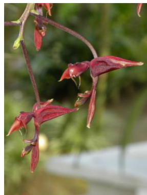
52 Gongora nigrita Lindl.