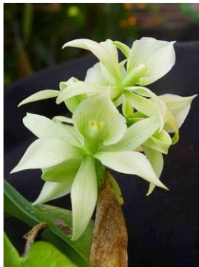
82 Prosthechea aemula (Lindl.) W.E.Higgins, (another color)