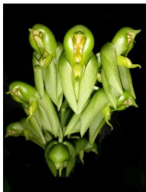
16 Catasetum uncatum Rolfe ♂