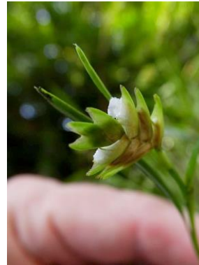
29 Elleanthus linifolius C. Presl