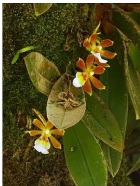
92 Trichocentrum fuscum Lindl.