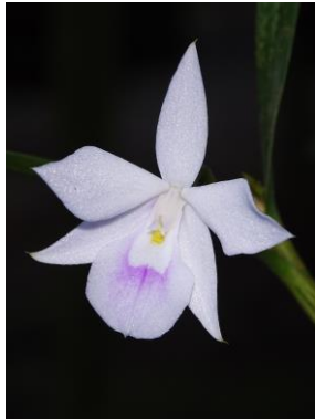
27 Dimerandra emarginata (G. Mey.) Hoehne (another color)