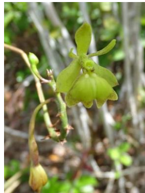
43 Epidendrum orchidiflorum (Salzm.) Lindl.