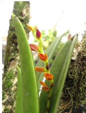
3 Acianthera ochreatea (Lindl.) Pridgeon & M.W.Chase