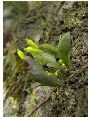
89 Stelis oligantha Barb.Rodr.