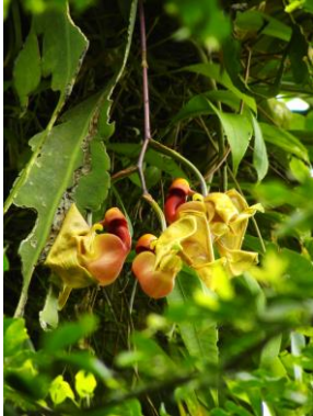
21 Coryanthes speciosa Hook.