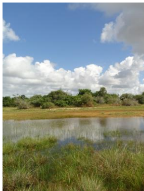
97 APA Piaçabuçu Alagoas - Brazil