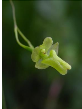
83 Scaphyglottis livida (Lindl.) Schltr.