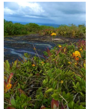
95 Serra Lisa, Chã Preta Alagoas - Brazil