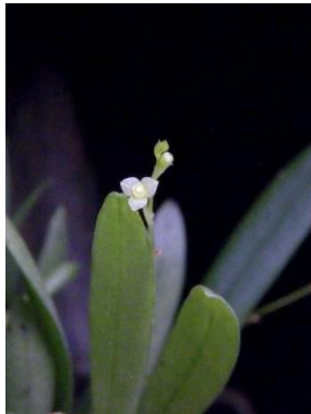
87 Stelis oligantha Barb.Rodr.