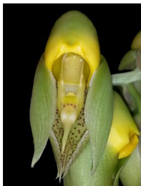
14 Catasetum macrocarpum Rich. ex Kunth ♂