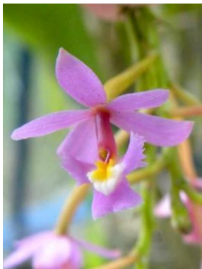
46 Epidendrum secundum Jacq.