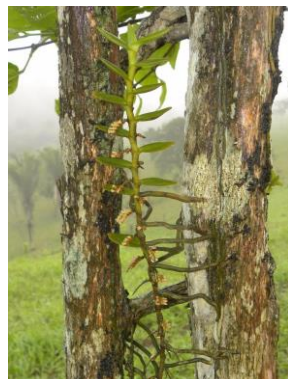
10 Campylocentrum crassirhizum Hoehne