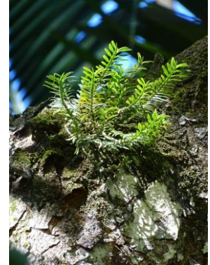
25 Dichaea panamensis Lindl.