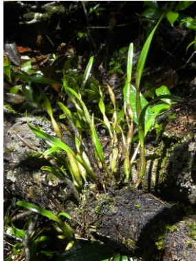
82 Scaphyglottis fusiformis (Griseb.) R.E.Schult.