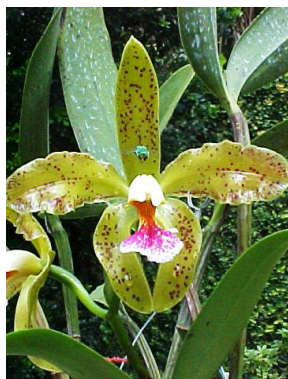
18 Cattleya granulosa Lindl. (pollinator Euglossa sp.)