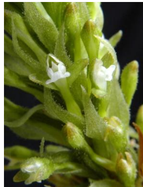
5 Aspidogyne foliosa (Poepp. & Endl.) Garay