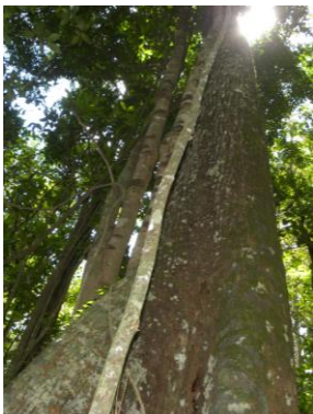
96 Coímbra, Ibataguara Alagoas - Brazil