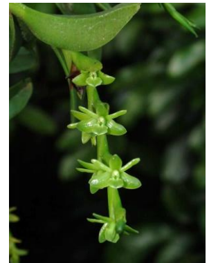
45 Epidendrum rigidum Jacq.