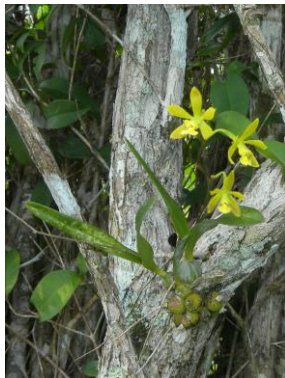
32 Encyclia bohnkiana V.P.Castro & Campacci