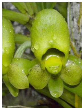
15 Catasetum macrocarpum Rich. ex Kunth ♀