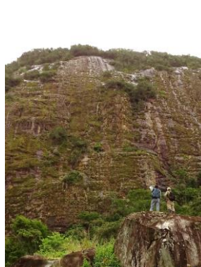
98 Serra da Nasceia, Boca da Mata Alagoas - Brazil