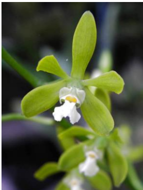
31 Encyclia bohnkiana V.P.Castro & Campacci