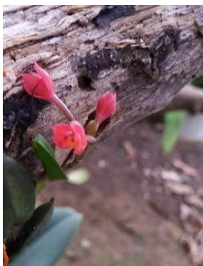
17 Cattleya alagoensis (V.P.Castro & Chiron) Van den Berg