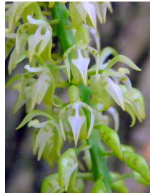
75 Notylia inversa Barb.Rodr.