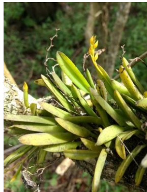
2 Acianthera glumacea (Lindl.) Pridgeon & M.W.Chase