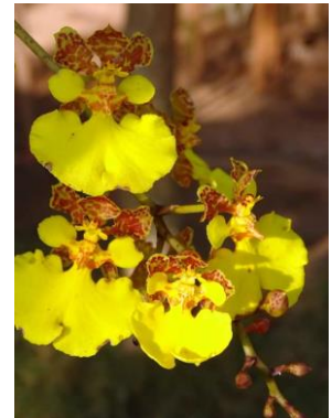
90 Trichocentrum caatingaense (Cetzal, V.P.Castro & Marçal) J.M.H.Shaw