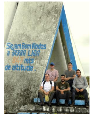
100 Serra Lisa, Chã Preta Alagoas - Brazil