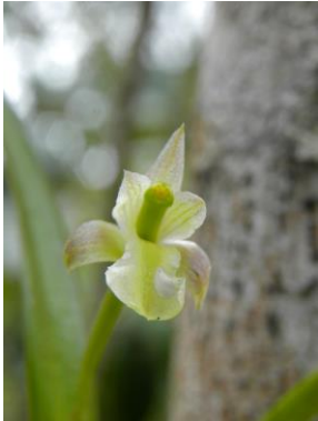
81 Scaphyglottis fusiformis (Griseb.) R.E.Schult.