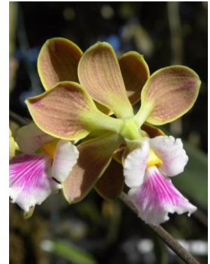
30 Encyclia advena (Rehb.f.) Porto & Brade