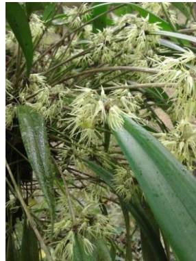
73 *Myoxanthus exasperatus (Lindl.) Luer