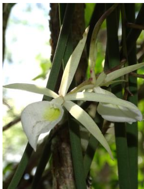
7 Brassavola tuberculata Hook.