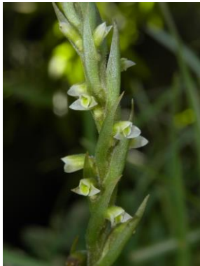
71 Mesadenella cuspidata (Lindl.) Garay