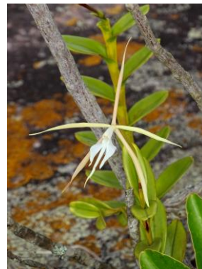
39 Epidendrum erectum Brieger & Bicalho