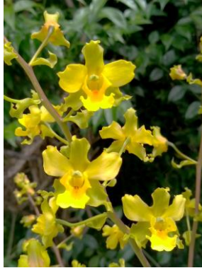
22 Cyrtopodium flavum Link & Otto ex Rehb.