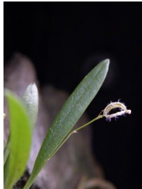
88 Stelis oligantha (open fruit) Barb.Rodr.