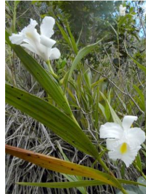
84 Sobralia liliastrum Lindl.