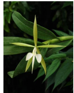
13 Epidendrum bahiense Rehb.f