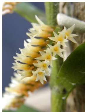
9 Campylocentrum crassirhizum Hoehne