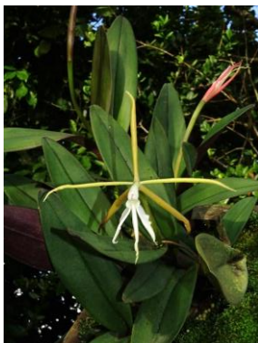
37 Epidendrum carpophorum Barb.Rodr.