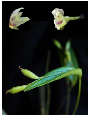
1 Acianthera auriculata (Lindl.) Pridgeon & M.W.Chase