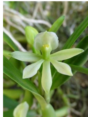
84 Prosthechea alagoensis (Pabst) W.E.Higgins (another color)