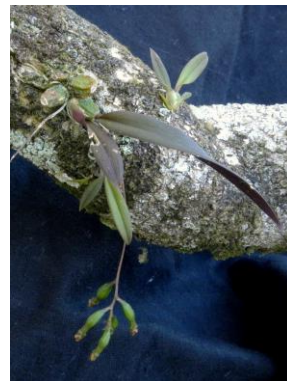
89 Sanderella discolor (Barb. Rodr.) Cogn. (fruit)