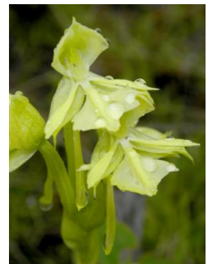
55 Habenaria pratensis (Salzm. ex Lindl.) Rchb.f.