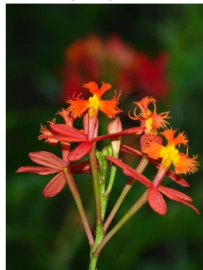
48 Epidendrum × sp. 1