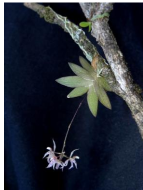
58 Macroclinium roseum Barb.Rodr.