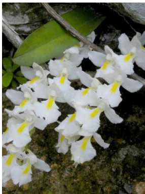
86 Rodríguezia bahiensis Rehb.f.