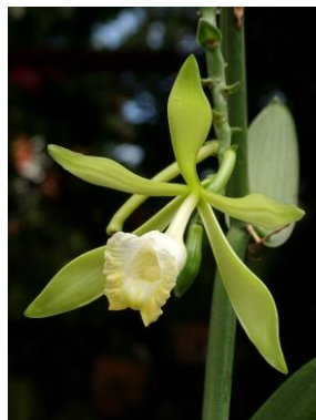
93 Vanilla bahiana Hoehne