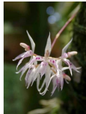
59 Macroclinium roseum Barb.Rodr.