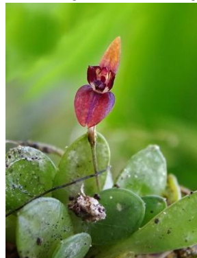
4 Anathallis barbulata (Lindl.) Pridgeon & M.W.Chase