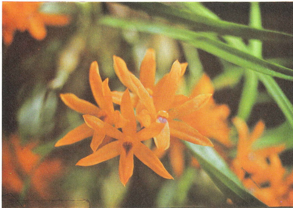
Hexisea bidentata Lindley Hexisea imbricata (Lindley) Rchb.f.