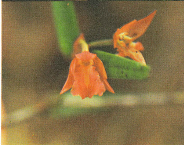
Hexisea arctata X Scaphyglottis amparoana