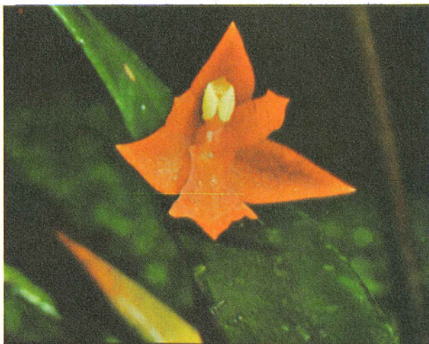
Hexisea arctata Dressler