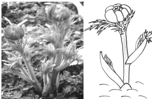
Рис. 4. Разворачивание листьев

Через 4–5 дней после начала раскрытия листьев (7 апреля) наступила фаза разворачивания листьев; у срединных листьев хорошо различимы сегменты, а боковые побеги увеличились в размерах (рис. 4). Главные побеги 5–6 см высотой.