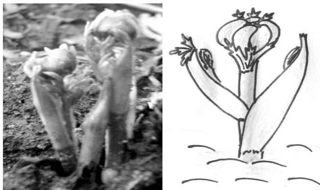
Рис. 3. Начало разворачивания листьев

Через 4–5 дней после появления бутонов (3 апреля) начали раскрываться листья (рис. 3). В эту фазу можно увидеть боковые побеги в желобках низовых листьев.