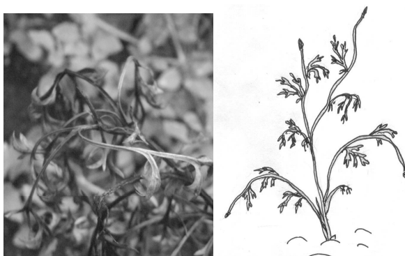
Рис. 10. Окончание вегетации

Закончилась вегетация, т.е. частичное, а затем полное засыхание надземной массы к 5–7 августа, после чего наступил период покоя (рис. 10).