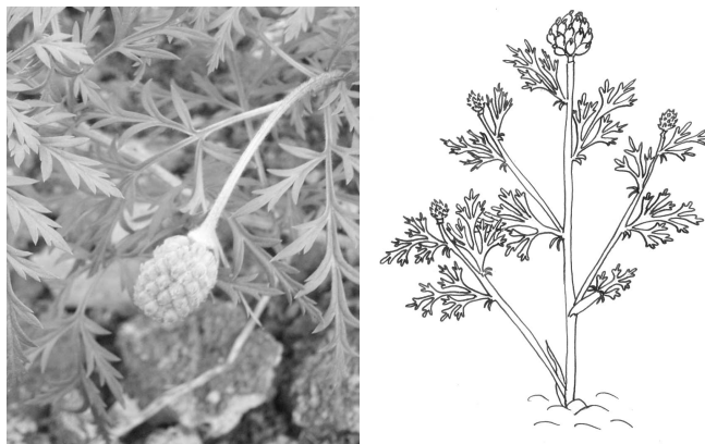
Рис. 7. Образование плодов

Созревание плодов, т.е. изменение окраски (с зеленой на желтую) и опадение, началось с 27 мая. Массовое созревание плодов – 5 июня, а опадение – 10 июня (рис. 8). Было обнаружено, что муравьи разносили и поедали семена стародубки, что осложняло их сбор. Стебли растений и боковые побеги в эту фазу стали хрупкими и легко ломались у оснований. После полного опадения семян растения продолжали вегетировать и оставались зелеными около месяца, каких-либо видимых изменений не наблюдалось.