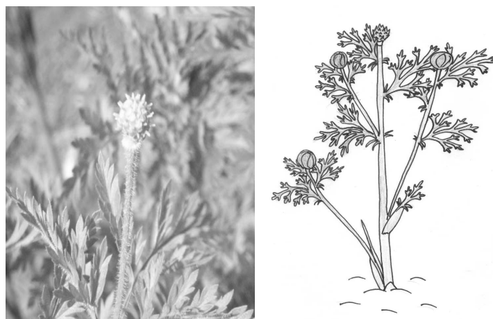
Рис. 6. Начало плодоношения

Начало плодоношения наступило на 13-й день после фазы цветения, средняя дата – 26 апреля. Лепестки и верховые листья главного побега опали, а завязь увеличилась в размерах (рис. 6). Одновременно на некоторых кустах цвели боковые побеги, на которых завязь не образовалась. Возможно, это связано с увеличением длины светового дня.