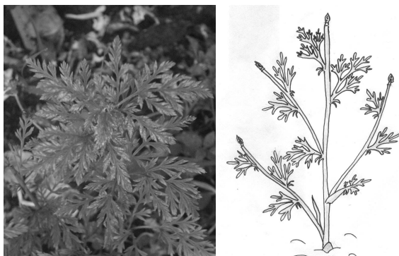
Рис. 9. Появление осенней окраски

Закончилась вегетация, т.е. частичное, а затем полное засыхание надземной массы к 5–7 августа, после чего наступил период покоя (рис. 10).