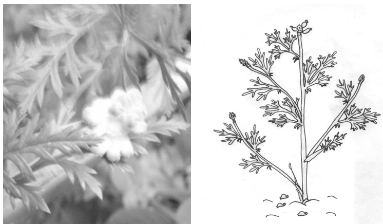
Рис. 8. Созревание и опадение плодов

Созревание плодов, т.е. изменение окраски (с зеленой на желтую) и опадение, началось с 27 мая. Массовое созревание плодов – 5 июня, а опадение – 10 июня (рис. 8). Было обнаружено, что муравьи разносили и поедали семена стародубки, что осложняло их сбор. Стебли растений и боковые побеги в эту фазу стали хрупкими и легко ломались у оснований. После полного опадения семян растения продолжали вегетировать и оставались зелеными около месяца, каких-либо видимых изменений не наблюдалось.