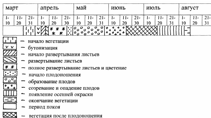
Фенологический спектр Adonis villosa

Начало цветения Adonis villosa зависит от климатических особенностей местообитания и погодных условий; цветет в апреле–мае. В начале цветения появляются малооблиственные главные побеги. Побегов несколько, из которых часть цветonoсные; все побеги вместе образуют куст. Боковые побеги и пластинки листьев развиваются полностью только к концу цветения и в начале плодоношения. К середине июня созревают плоды и полностью прекращается рост всех надземных органов.