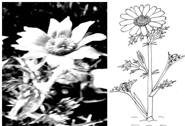
Рис. 5. Полное разворачивание листьев и цветение

Начало плодоношения наступило на 13-й день после фазы цветения, средняя дата – 26 апреля. Лепестки и верховые листья главного побега опали, а завязь увеличилась в размерах (рис. 6). Одновременно на некоторых кустах цвели боковые побеги, на которых завязь не образовалась. Возможно, это связано с увеличением длины светового дня.