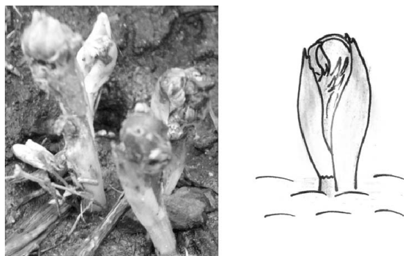
Рис. 2. Бутонизация

Развитие побегов происходило быстро. Бутонизация началась через 8–9 дней (29 марта) после начала вегетации. Побеги 2,8–4,0 см высотой. Хорошо видны бутон коричнево-сиреневого цвета и короткий густоопушенный красноватый стебель (рис. 2).