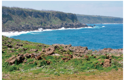
図1. 半崎:リュウキュウタイゲキ, イソノギク, モクビャッコウが自生する隆起サンゴ礁の海岸.

大野照好 (1971) 沖永良部島の植物. 鹿児島県文化財調査報告書第19-20集. 鹿児島県教育委員会.