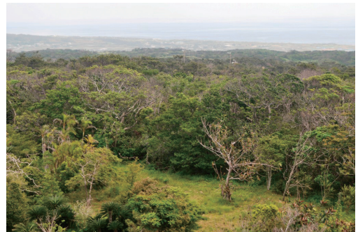
図2. 大山:アオバナハイノキ, イジュ, スダジィなどの照葉樹が自生する大山山頂付近の非石灰岩地帯. ミヤコジマハナワラビもこの付近でみられる.