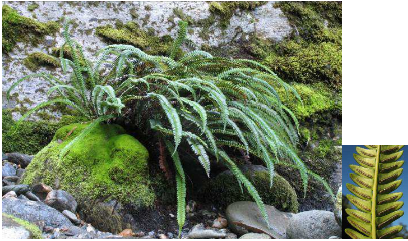
Blechnum arcuatum